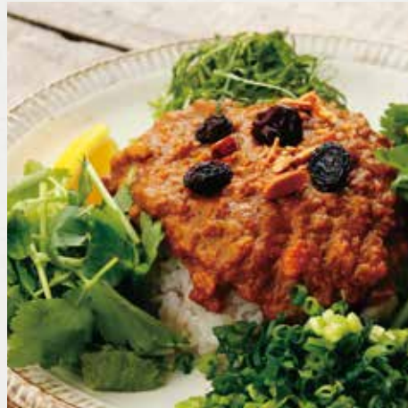
BASE CAMP ORIGINAL HERB KEEMA CURRY & RICE BC オリジナル香草スパイスキーマカレー ¥1,030 季節により香草は変更いたします。