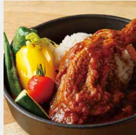
CHICKEN LEG CURRY & RICE 骨付き鶏もも肉の BASE CAMP カレー ¥1,350