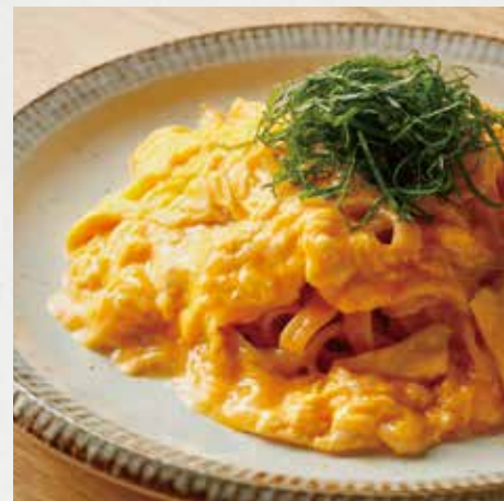
MENTAIKO OMELETTE PASTA オム明太子パスタ ¥1,130

PLEASE CHECK OUR TODAY'S SPECIALS ON ANOTHER MENU. 日替わりのメニューは別紙にてご覧下さい。