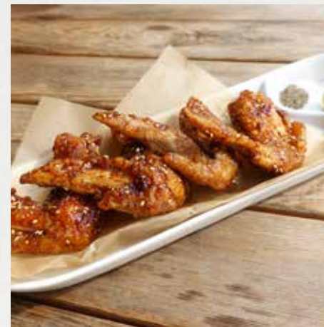
DEEP FRIED CHICKEN WING, NAGOYA STYLE / 4P