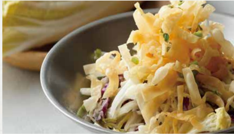
CHINESE CHICKEN SALAD