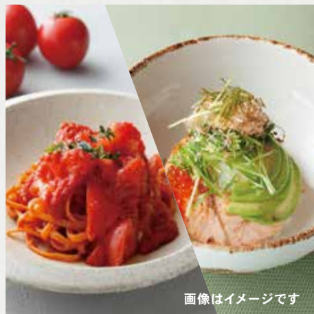
TODAY'S RECOMMENDED NOODLE / RICE 本日のパスタ or ヌードル または ライス ¥ASK 画像はイメージです