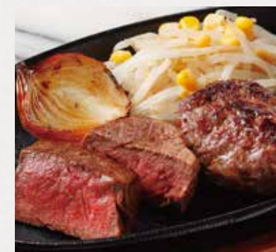
BEEF TENDERLOIN & HAMBURG STEAK