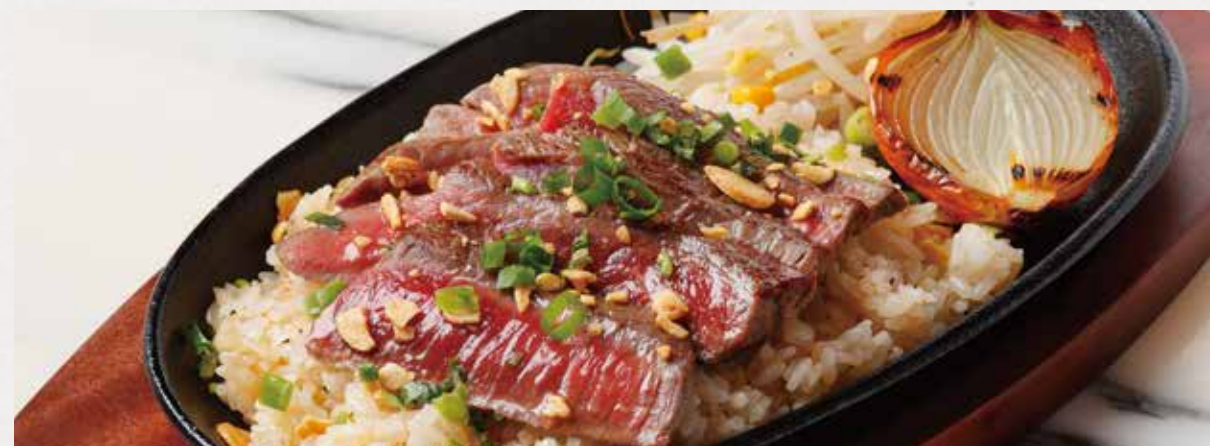
TEPPAN BBQ PLATE / BEEF & BEEF