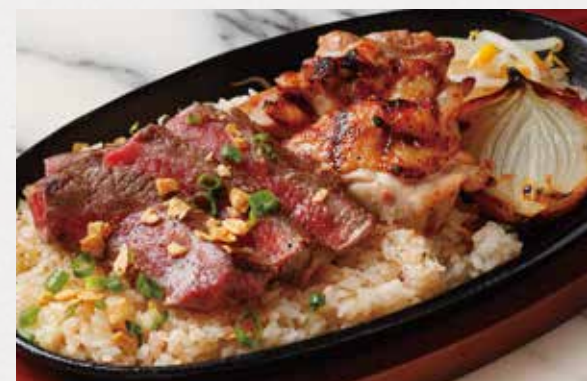
BEEF & CHICKEN