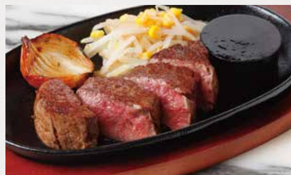
BEEF TENDERLOIN STEAK