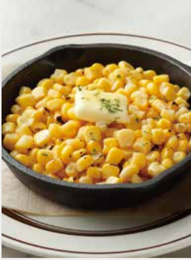
BUTTERED CORN バターコーン ¥550