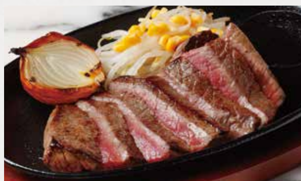
BEEF ROUND STEAK