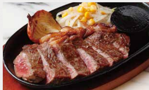
BEEF SIRLOIN STEAK