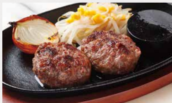
100% JAPANESE BEEF HAMBURG STEAK