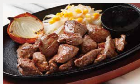
BEEF MIXED CUT STEAK