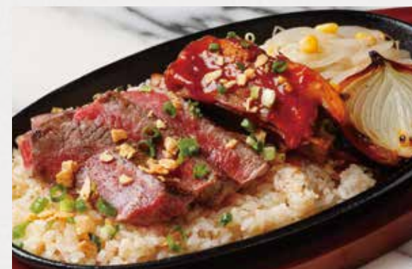
BEEF & PORK SPARE RIBS