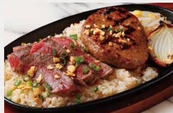
BEEF & HAMBURG