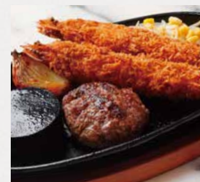
FRIED PRAWN & HAMBURG STEAK