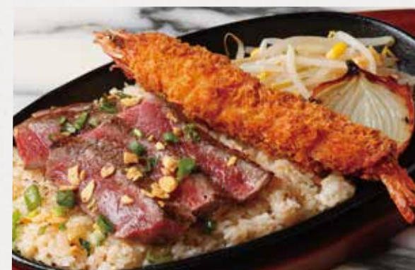
BEEF & FRIED PRAWN