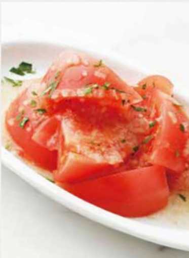
CHOPPED TOMATO カットトマト ¥480