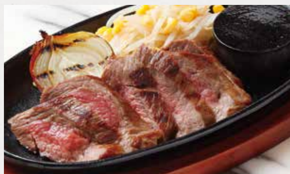
BEEF RIB STEAK