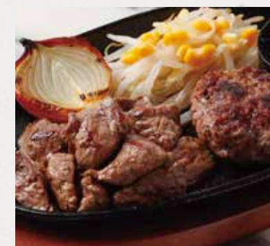
BEEF MIXED CUT & HAMBURG STEAK