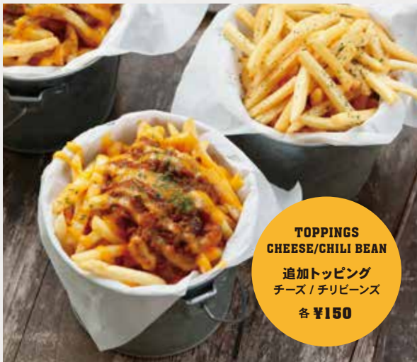
FRENCH FRIES フライドポテト ¥750