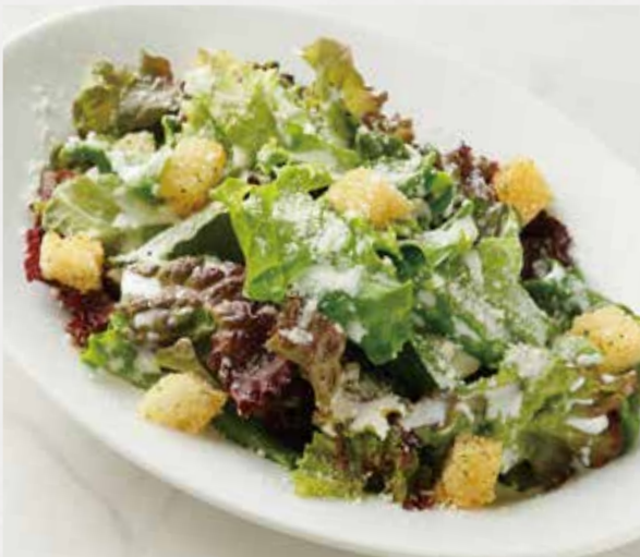
CAESAR SALAD シーザーサラダ レギュラー ¥920 / ハーフ ¥570