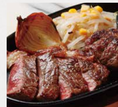
BEEF SIRLOIN & HAMBURG STEAK