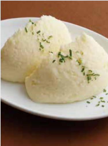
MASHED POTATO マッシュポテト ¥560