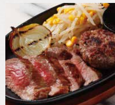
BEEF RIB & HAMBURG STEAK