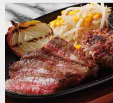
BEEF ROUND & HAMBURG STEAK