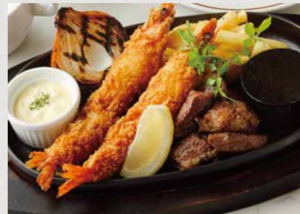
STEAK & FRIED PRAWN 選べるステーキと大海老フライ