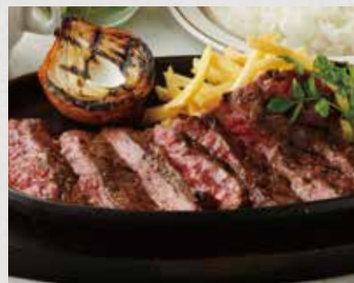
OUTSIDE SKIRT STEAK ハラミステーキ