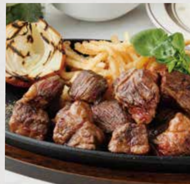
MIXED CUT STEAK ミックスカットステーキ

200g / 1550 +税 300g / 2050 +税 400g / 2550 +税