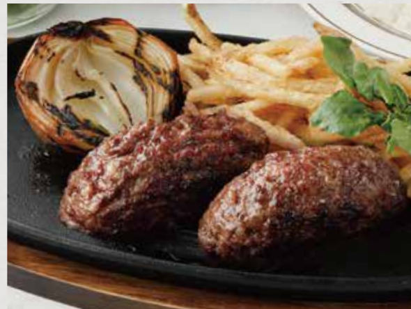
JAPANESE BEEF100% HAMBURG STEAK

国産牛ビーフ 100% ハンバーグ 250g / 1550 +税 ダブル 500g / 2850 +税