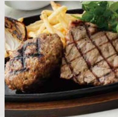
SIRLOIN STEAK & HAMBURG STEAK サーロインステーキ&ハンバーグ