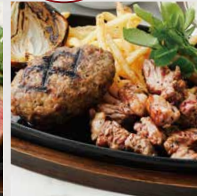
MIXED CUT STEAK & HAMBURG STEAK ミックスカットステーキ&ハンバーグ