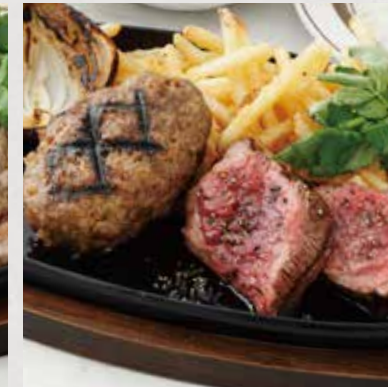
CHUCK STEAK & HAMBURG STEAK ザブトン&ハンバーグ