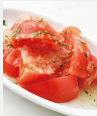
CHOPPED TOMATO カットトマト ¥420