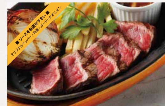
HALF STEAK (ROUND) ハーフステーキ (モモ) 120g / ¥1,200