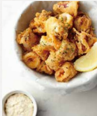
CALAMARI FRITTER カラマリフリット ¥720