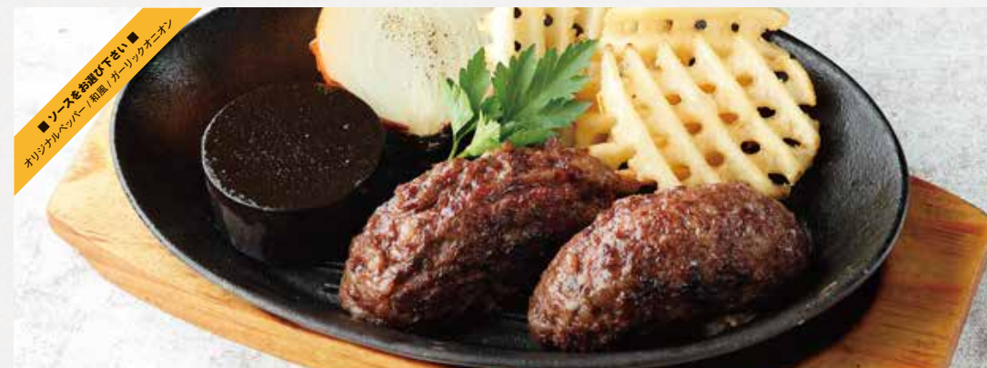
JAPANESE BEEF 100% HAMBURG STEAK 国産牛ビーフ 100% ハンバーグ 250g / ¥1,650