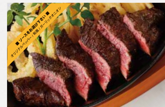
TOP BLADE MUSCLE STEAK ミスジステーキ 200g / ¥1,900