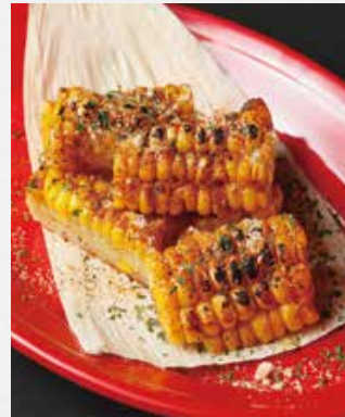
GRILLED CHEESE CORN グリルチーズコーン ¥550