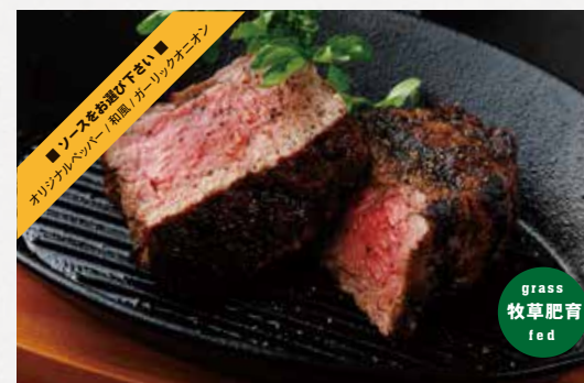
FILLET STEAK フィレステーキ 180g / ¥2,550