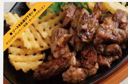
MIXED CUT STEAK ミックスカットステーキ 200g / ¥1,650