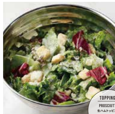
CAESAR SALAD シーザーサラダ 税別 ¥772 (税込み ¥850)

TOPPINGS PROSCIUTTO 生ハムトッピング 税別 + ¥345 (税込 + ¥380)