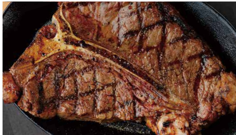
BEEF T-BONE STEAK T ボーンステーキ (450g) 税別 ¥5,910 (税込み ¥6,500)