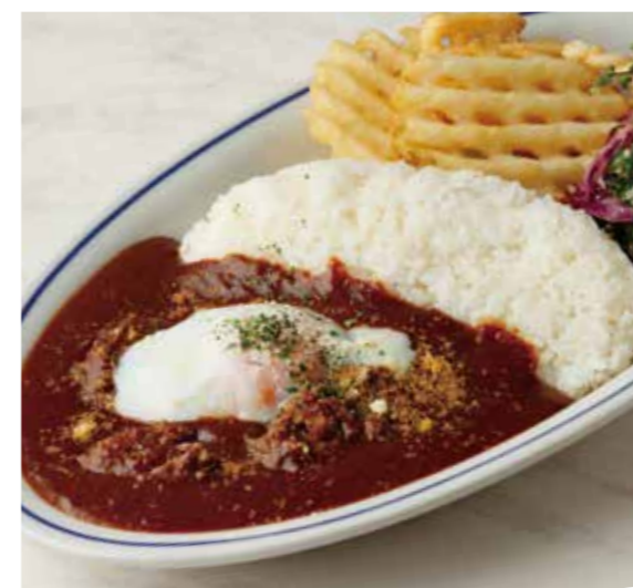
BEEF TENDON CURRY PLATE ステーキ屋さんの牛すじカレープレート 税別 ¥1,091 (税込み ¥1,200) + ¥110 (税込み) でガーリックライスに変更できます