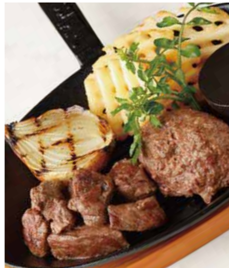
BEEF MIXED CUT STEAK & HAMBURG ミックスカットステーキ (100g) & ハンバーグ (150g) 税別 ¥1,636 (税込み ¥1,800)