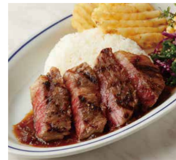
KUROGE WAGYU SIRLOIN STEAK PLATE 黒毛和牛サーロインステーキ (90g) プレート 税別 ¥2,728 (税込み ¥3,000) + ¥110 (税込み) でガーリックライスに変更できます