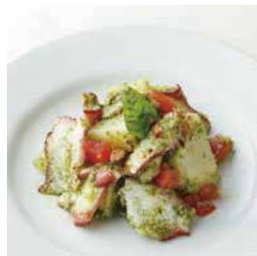
OCTOPUS & POTATO GENOVESE タコとポテトのジェノベーゼ 税別 ¥636 (税込み ¥700)