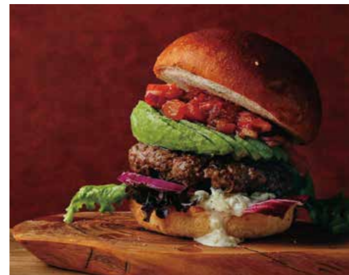
AVOCADO SALSA BURGER アメリカンビーフ 100% 極厚ビーフパテのアボカドサルサバーガー 税別 ¥1,591 (税込み ¥1,750)