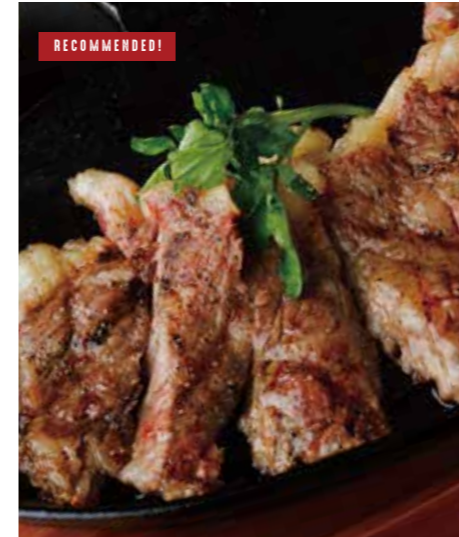
AUSTRALIAN BEEF SIRLOIN STEAK サーロインステーキ / オーストラリア産 225g 税別 ¥2,182 (税込み ¥2,400) 450g 税別 ¥3,819 (税込み ¥4,200)