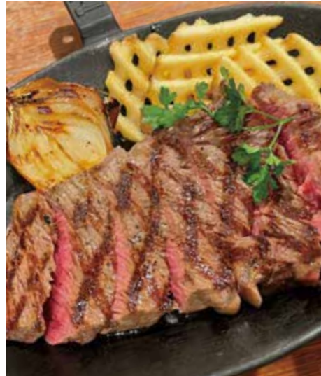
BEEF RUMP STEAK ランプステーキ (200g) 税別 ¥1,636 (税込み ¥1,800)

※ ステーキ、ハンバーグの焼き加減はレアで提供しています。 お好みございましたら スタッフにお申し付け下さいませ。 ※ 食物アレルギーをお持ちの方はスタッフにお声がけ下さい。