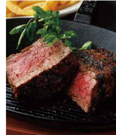
BEEF TENDERLOIN STEAK フィレステーキ (180g) 税別 ¥3,182 (税込み ¥3,500)