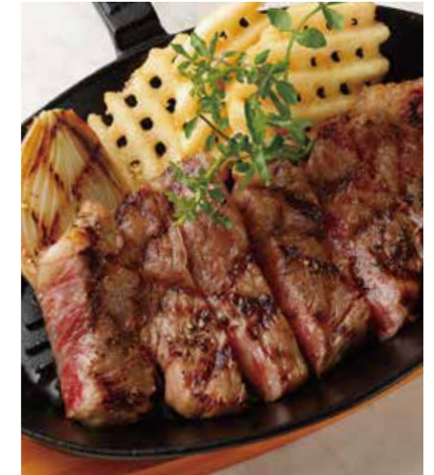
KUROGE WAGYU BEEF SIRLOIN STEAK 国産 黒毛和牛 サーロインステーキ (180g) 税別 ¥5,410 (税込み ¥5,950)