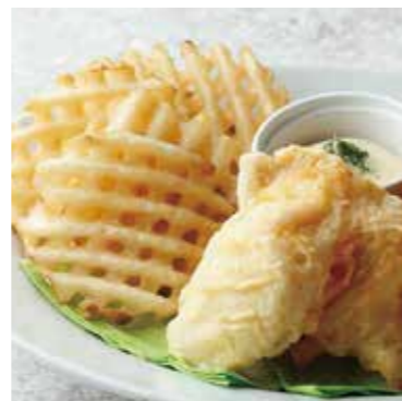
FISH & CHIPS フィッシュ & チップス 税別 ¥800 (税込み ¥880)