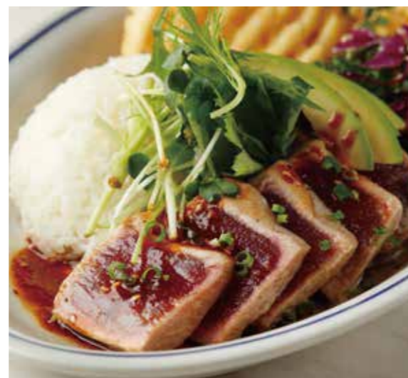
TUNA & AVOCADO STEAK PLATE マグロアボカドステーキプレート 税別 ¥1,273 (税込み ¥1,400) + ¥110 (税込み) でガーリックライスに変更できます