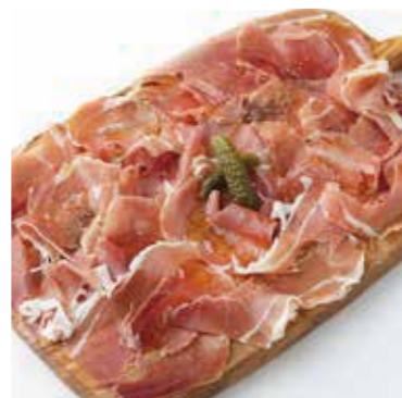
PROSCIUTTO PLATTER 生ハムプレート 税別 ¥1,318 (税込み ¥1,450)

TOPPINGS 各税別 + ¥100 (税込 + ¥110) + CHILI BEAN チリビーンズ + GRAVY グレービー + CHEESE チーズ