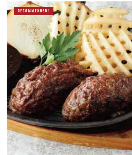
JAPANESE BEEF 100% HAMBURG 国産牛 100% のハンバーグ (250g) 税別 ¥1,619 (税込み ¥1,780)