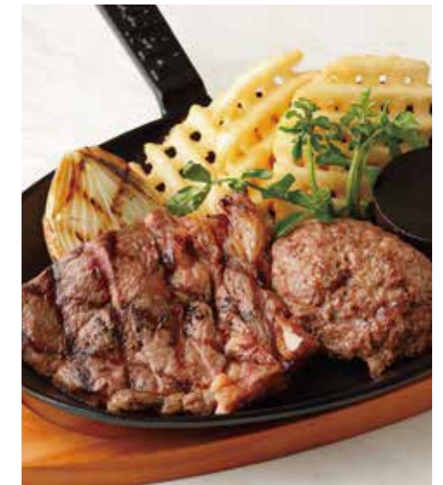
BEEF SIRLOIN STEAK & HAMBURG サーロインステーキ (100g) & ハンバーグ (150g) 税別 ¥2,091 (税込み ¥2,300)