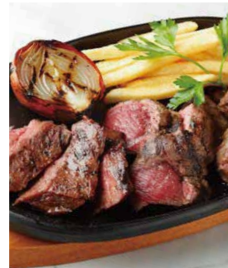
ASSORTED 3 PARTS STEAK TOP BLADE MUSCLE, OUTSIDE SKIRT, & OTHER PARTS OF THE DAY 3種ミックスステーキ (ミスジ、ハラミ、ミックスカット) 税別 ¥2,546 (税込み ¥2,800)