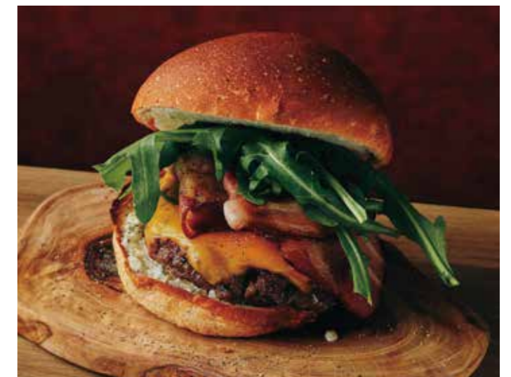
ROCKET & BACON GARLIC PEPPER BURGER アメリカンビーフ 100% 極厚ビーフパテ ルッコラとベーコンのガーリックペッパーバーガー 税別 ¥1,591 (税込み ¥1,750)