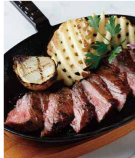
BEEF OUTSIDE SKIRT STEAK ハラミステーキ (180g) 税別 ¥1,710 (税込み ¥1,880)