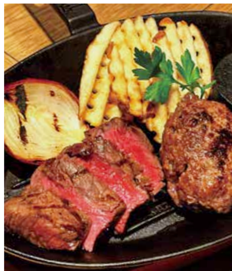
BEEF RUMP STEAK & HAMBURG ランプステーキ (100g) & ハンバーグ (150g) 税別 ¥1,636 (税込み ¥1,800)