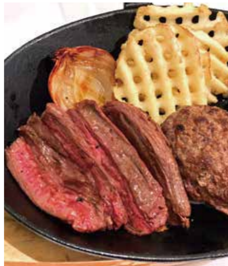
BEEF OUTSIDE SKIRT STEAK & HAMBURG ハラミステーキ (90g) & ハンバーグ (150g) 税別 ¥1,710 (税込み ¥1,880)