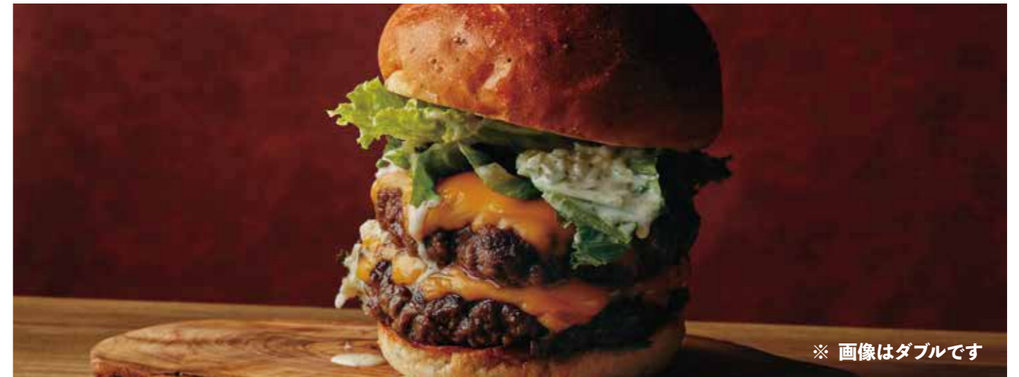
CHEESE BURGER (Single patty or Double patty) アメリカンビーフ 100% 極厚ビーフパテのチーズバーガー (シングル / single) 税別 ¥1,500 (税込み ¥1,650) (ダブル / double) 税別 ¥2,364 (税込み ¥2,600)