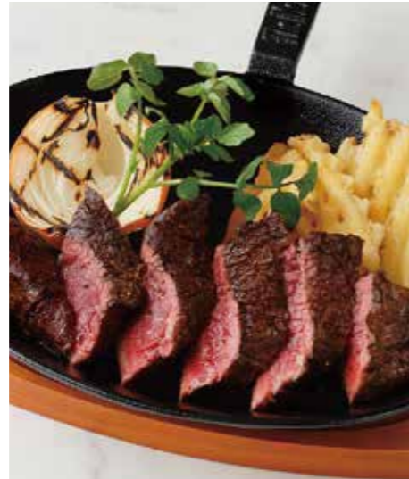
BEEF TOP BLADE MUSCLE STEAK ミスジステーキ (180g) 税別 ¥1,710 (税込み ¥1,880)