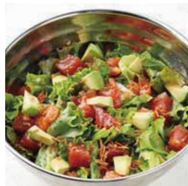
TUNA & AVOCADO SALAD マグロとアボカドのサラダ 税別 ¥890 (税込み ¥980)

TOPPINGS PROSCIUTTO 生ハムトッピング 税別 + ¥345 (税込 + ¥380)