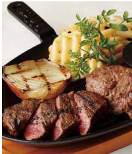
BEEF TOP BLADE MUSCLE STEAK & HAMBURG ミスジステーキ (90g) & ハンバーグ (150g) 税別 ¥1,710 (税込み ¥1,880)

※牛 100% につき、パティの焼き加減はレアで提供しています。 お好みございましたら スタッフにお申し付け下さいませ。 ※食物アレルギーをお持ちの方はスタッフにお声がけ下さい。