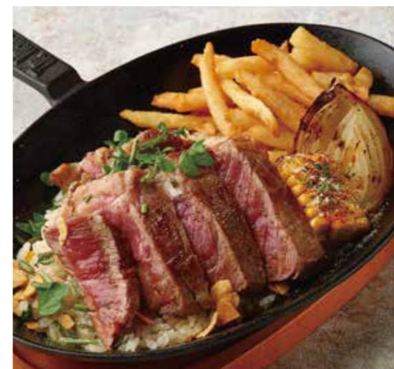
BEEF & BEEF WITH GARLIC RICE TEPPAN PLATE ビーフ&ビーフ (150g) とガーリックライスの鉄板プレート 税別 ¥1,500 (税込み ¥1650)