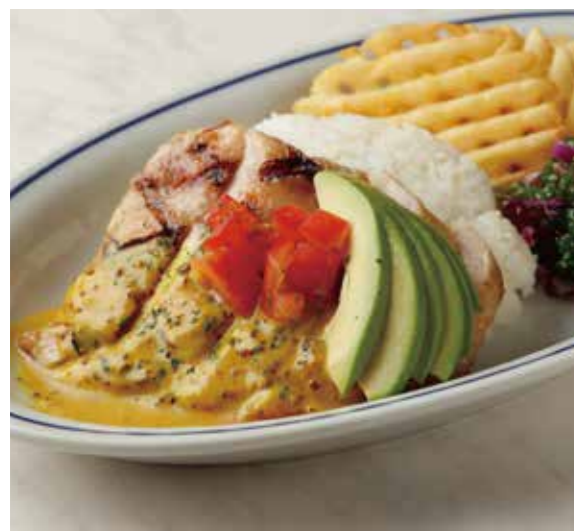
MUSTARD CHICKEN PLATE マスタードチキンプレート 税別 ¥1,228 (税込み ¥1,350) + ¥110 (税込み) でガーリックライスに変更できます