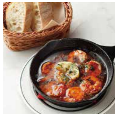
SHRIMP AJILLO AND BAGUETTE 海老のアヒージョ (バゲット付き) 税別 ¥800 (税込み ¥880)