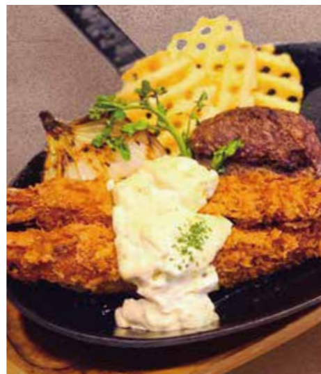
FRIED PRAWN & HAMBURG 海老フライ & ハンバーグ (150g) 税別 ¥1,591 (税込み ¥1,750)