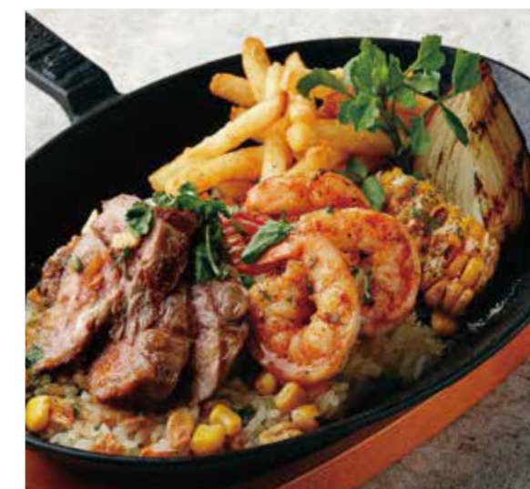
BEEF & SHRIMP WITH GARLIC RICE TEPPAN PLATE ビーフ&シュリンプとガーリックライスの鉄板プレート 税別 ¥1,500 (税込み ¥1650)