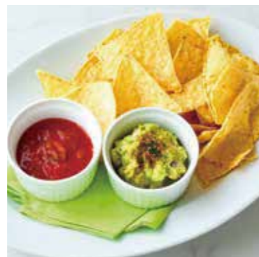
AVOCADO DIP & TORTILLA CHIPS アボカドディップとトルティーヤチップス 税別 ¥727 (税込み ¥800)