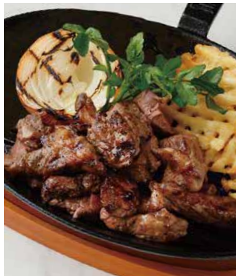
BEEF MIXED CUT STEAK ミックスカットステーキ 200g 税別 ¥1,636 (税込み ¥1,800) 300g 税別 ¥2,363 (税込み ¥2,600)