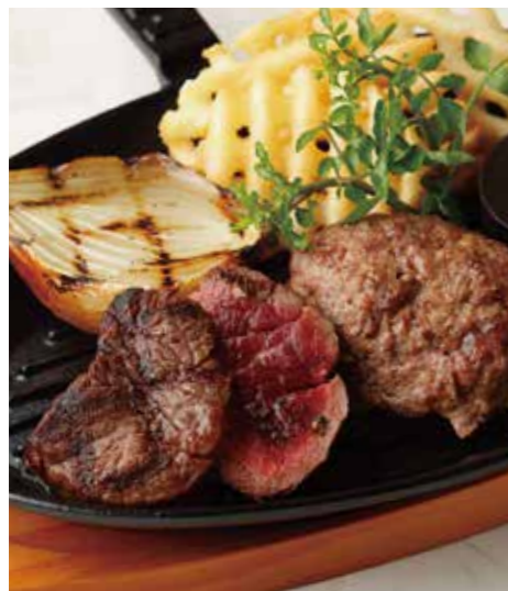
BEEF TENDERLOIN STEAK & HAMBURG フィレステーキ (90g) & ハンバーグ (150g) 税別 ¥2,636 (税込み ¥2,900)