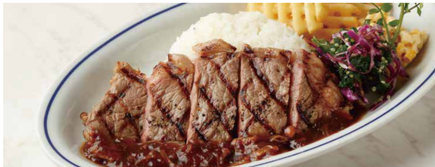
BEEF RUMP STEAK PLATE 麦黒牛ランプステーキ (150g) プレート 税別 ¥1,500 (税込み ¥1,650) + ¥110 (税込み) でガーリックライスに変更できます

※ プレートの各ステーキの焼き加減はレアで提供しています。 お好みございましたら スタッフにお申し付け下さいませ。 ※食物アレルギーをお持ちの方はスタッフにお声がけ下さい。