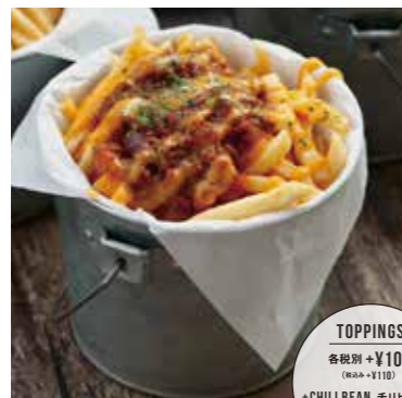
FRENCH FRIES フレンチフライ 税別 ¥590 (税込み ¥650)

TOPPINGS 各税別 + ¥100 (税込 + ¥110) + CHILI BEAN チリビーンズ + GRAVY グレービー + CHEESE チーズ