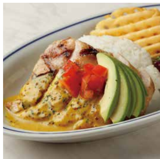
MUSTARD CHICKEN PLATE マスタードチキンプレート 税別 ¥1,228 (税込み ¥1,350) + ¥110 (税込み) でガーリックライスに変更できます