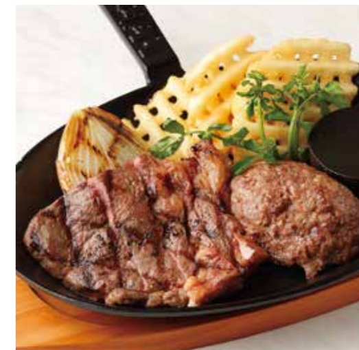
BEEF SIRLOIN STEAK & HAMBURG サーロインステーキ (100g) & ハンバーグ (150g) 税別 ¥2,091 (税込み ¥2,300)