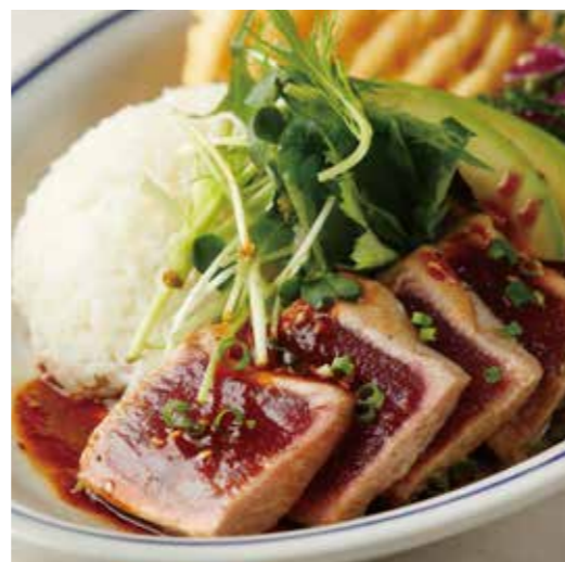
TUNA & AVOCADO STEAK PLATE マグロアボカドステーキプレート 税別 ¥1,273 (税込み ¥1,400) + ¥110 (税込み) でガーリックライスに変更できます