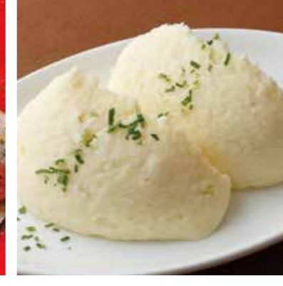
MASHED POTATO マッシュポテト 税別 ¥500 (税込み ¥550)