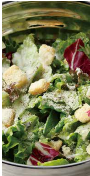
CAESAR SALAD シーザーサラダ