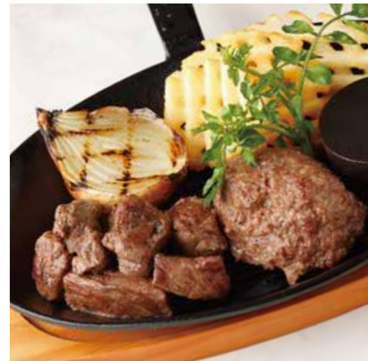
BEEF MIXED CUT STEAK & HAMBURG ミックスカットステーキ (100g) & ハンバーグ (150g) 税別 ¥1,636 (税込み ¥1,800)

※焼き加減はレアで提供しています。 お好みの焼き加減がございましたら、スタッフにお申し付け下さいませ。 ※食物アレルギーをお持ちの方はスタッフにお声がけ下さいますようお願い致します。