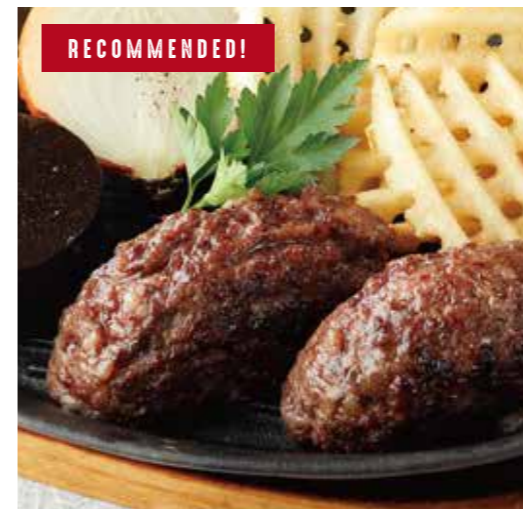
JAPANESE BEEF 100% HAMBURG RECOMMENDED! 国産牛100%のハンバーグ (250g) 税別 ¥1,619 (税込み ¥1,780)

※焼き加減は レア で提供しています。 お好みの焼き加減がございましたら、スタッフにお申し付け下さいませ。 ※食物アレルギーをお持ちの方はスタッフにお声がけ下さいますようお願い致します。