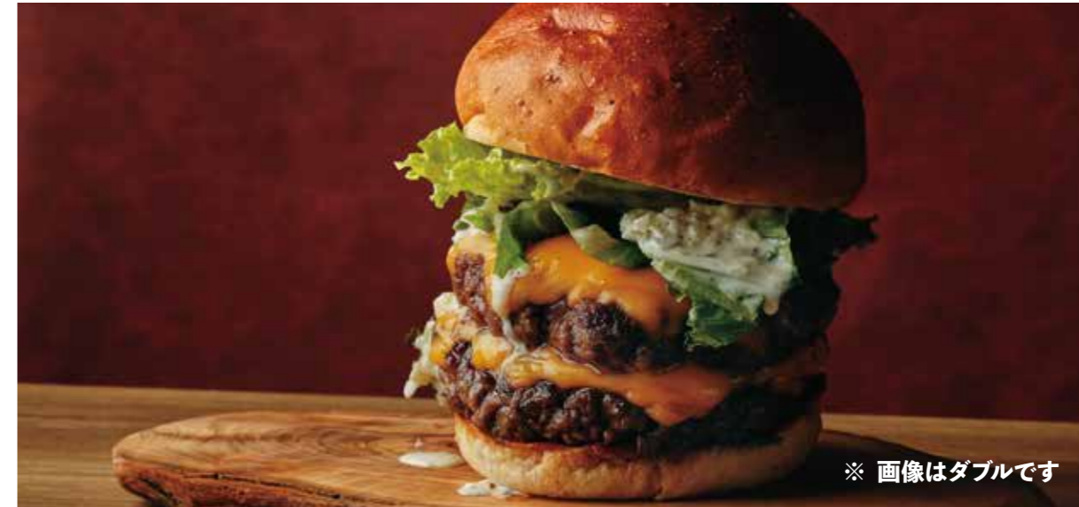
CHEESE BURGER (Single patty or Double patty) アメリカンビーフ 100% 極厚ビーフパテのチーズバーガー

※牛 100% につき、パティの焼き加減はレアで提供しています。 お好みの焼き加減がございましたら、スタッフにお申し付け下さいませ。 ※食物アレルギーをお持ちの方はスタッフにお声がけ下さいますようお願い致します。