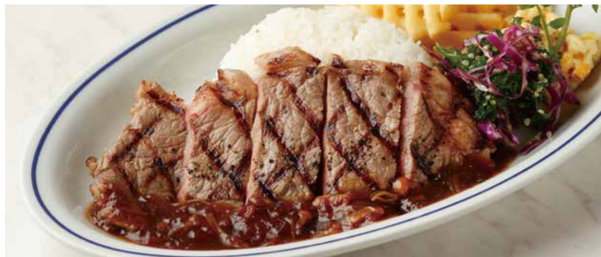
BEEF RUMP STEAK PLATE 麦黒牛ランプステーキ (150g) プレート 税別 ¥1,500 (税込み ¥1,650)