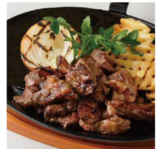
BEEF MIXED CUT STEAK ミックスカットステーキ 200g 税別 ¥1,636 (税込み ¥1,800) 300g 税別 ¥2,363 (税込み ¥2,600)