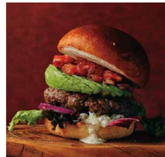
AVOCADO SALSA BURGER アメリカンビーフ 100% 極厚ビーフパテのアボカドサルサバーガー 税別 ¥1,591 (税込み ¥1,750)