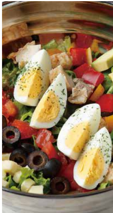
COBB SALAD コブサラダ