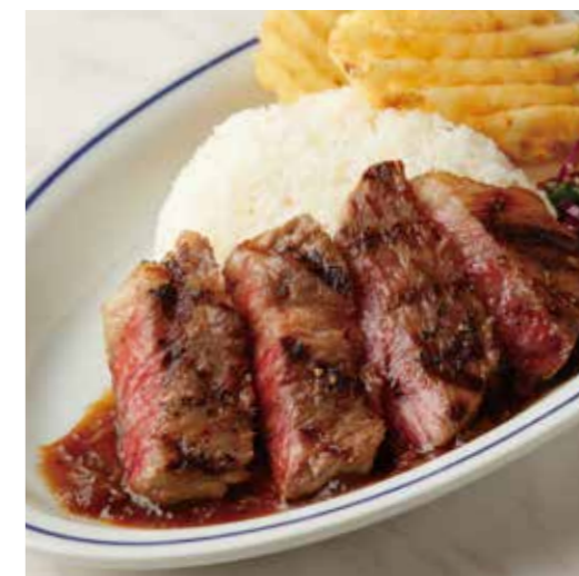
KUROGE WAGYU SIRLOIN STEAK PLATE 黒毛和牛サーロインステーキ (90g) プレート 税別 ¥2,728 (税込み ¥3,000) + ¥110 (税込み) でガーリックライスに変更できます