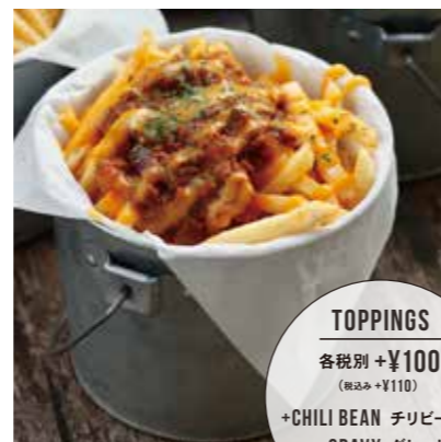
FRENCH FRIES フレンチフライ 税別 ¥590 (税込み ¥650)

TOPPINGS 各税別 +¥100 (税込み +¥110) +CHILI BEAN チリビーンズ +GRAVY グレービー +CHEESE チーズ