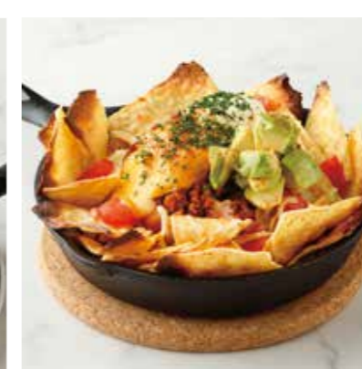
MEXICAN NACHOS メキシカンナチョス 税別 ¥800 (税込み ¥880)