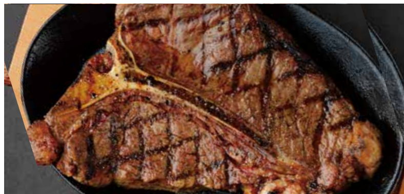
BEEF T-BONE STEAK T ボーンステーキ (450g) 税別 ¥5,910 (税込み ¥6,500)

※焼き加減は レア で提供しています。 お好みの焼き加減がございましたら、スタッフにお申し付け下さいませ。 ※食物アレルギーをお持ちの方はスタッフにお声がけ下さいますようお願い致します。