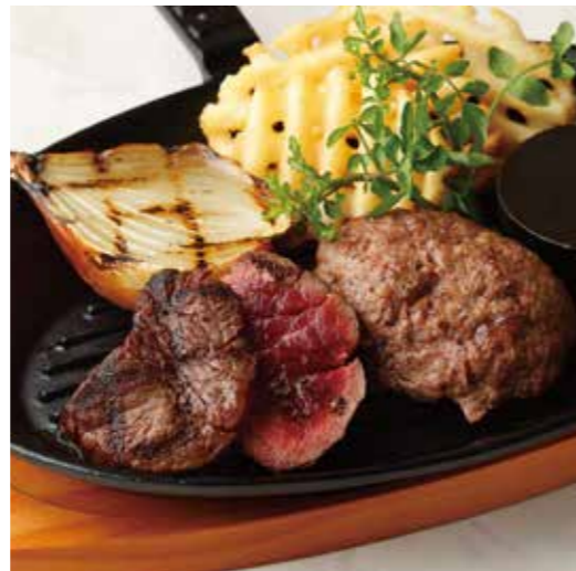
BEEF TENDERLOIN STEAK & HAMBURG フィレステーキ (90g) & ハンバーグ (150g) 税別 ¥2,636 (税込み ¥2,900)

※焼き加減はレアで提供しています。 お好みの焼き加減がございましたら、スタッフにお申し付け下さいませ。 ※食物アレルギーをお持ちの方はスタッフにお声がけ下さいますようお願い致します。