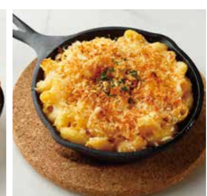
MAC'N CHEESE マック&チーズ 税別 ¥636 (税込み ¥700)