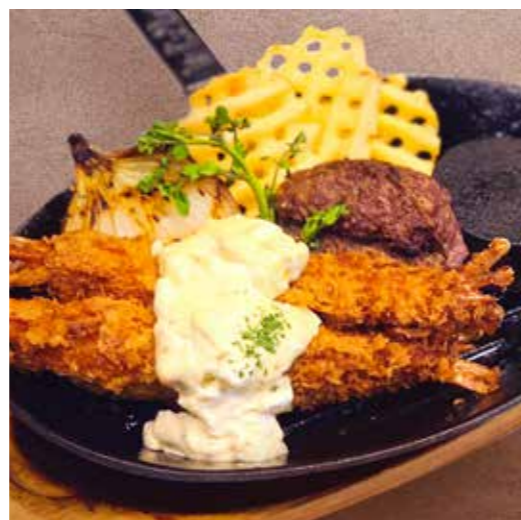
FRIED PRAWN & HAMBURG 海老フライ & ハンバーグ (150g) 税別 ¥1,591 (税込み ¥1,750)