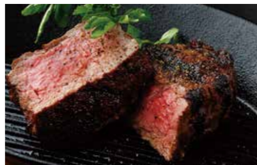
BEEF TENDERLOIN STEAK フィレステーキ (180g) 税別 ¥3,182 (税込み ¥3,500)