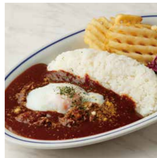
BEEF TENDON CURRY PLATE ステーキ屋さんの牛すじカレープレート 税別 ¥1,091 (税込み ¥1,200) + ¥110 (税込み) でガーリックライスに変更できます