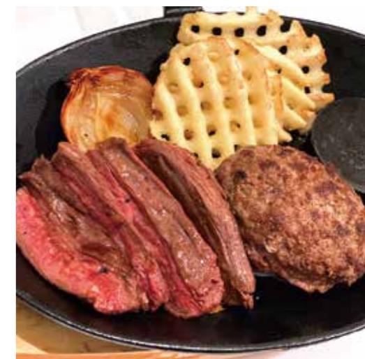
BEEF OUTSIDE SKIRT STEAK & HAMBURG ハラミステーキ (90g) & ハンバーグ (150g) 税別 ¥1,710 (税込み ¥1,880)