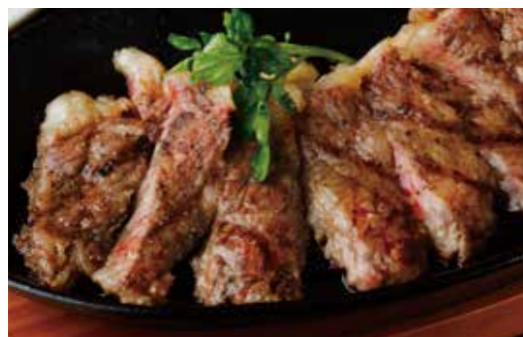
AUSTRALIAN BEEF SIRLOIN STEAK RECOMMENDED! サーロインステーキ / オーストラリア産 225g 税別 ¥2,182 (税込み ¥2,400) 450g 税別 ¥3,819 (税込み ¥4,200)