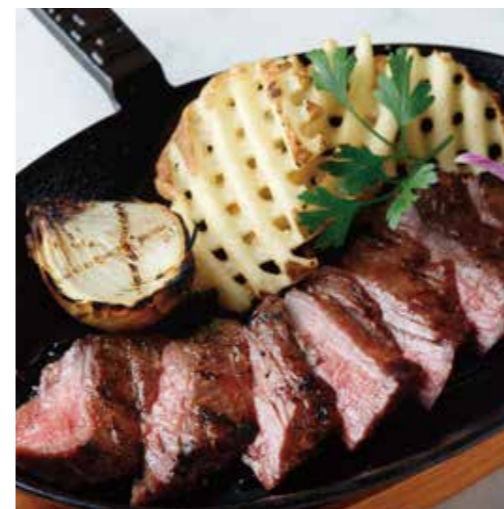
BEEF OUTSIDE SKIRT STEAK ハラミステーキ (180g) 税別 ¥1,710 (税込み ¥1,880)