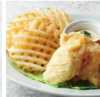
FISH & CHIPS フィッシュ & チップス 税別 ¥800 (税込み ¥880)