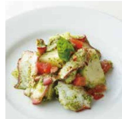
OCTOPUS & POTATO GENOVESE タコとポテトのジェノベーゼ 税別 ¥636 (税込み ¥700)