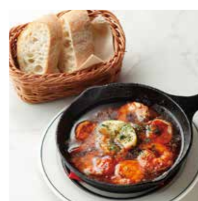
SHRIMP AJILLO AND BAGUETTE 海老のアヒージョ (バゲット付き) 税別 ¥800 (税込み ¥880)

TOPPINGS 各税別 +¥100 (税込み +¥110) +CHILI BEAN チリビーンズ +GRAVY グレービー +CHEESE チーズ