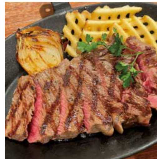
BEEF RUMP STEAK ランプステーキ (200g) 税別 ¥1,636 (税込み ¥1,800)

※焼き加減はレアで提供しています。 お好みの焼き加減がございましたら、スタッフにお申し付け下さいませ。 ※食物アレルギーをお持ちの方はスタッフにお声がけ下さいますようお願い致します。