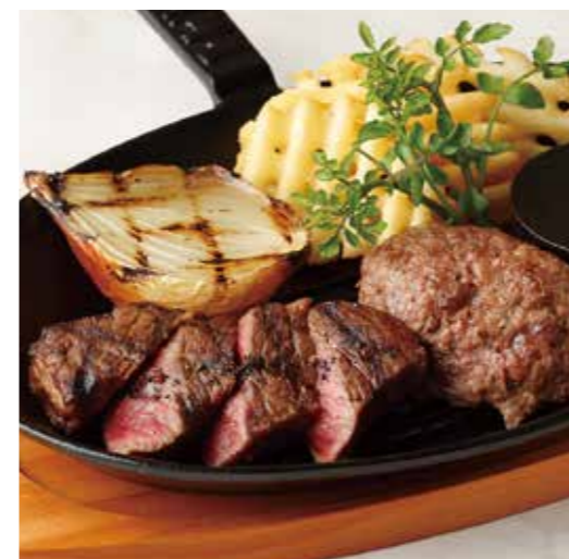
BEEF TOP BLADE MUSCLE STEAK & HAMBURG ミスジステーキ (90g) & ハンバーグ (150g) 税別 ¥1,710 (税込み ¥1,880)