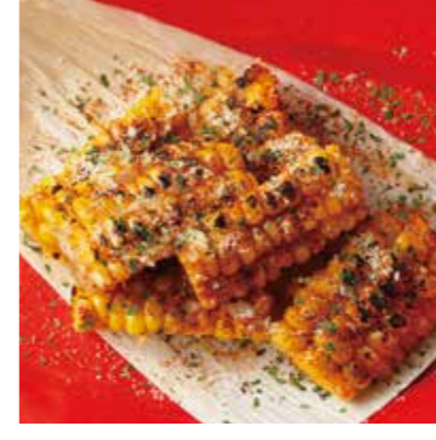
GRILLED CHEESE CORN グリルドチーズコーン 税別 ¥500 (税込み ¥550)