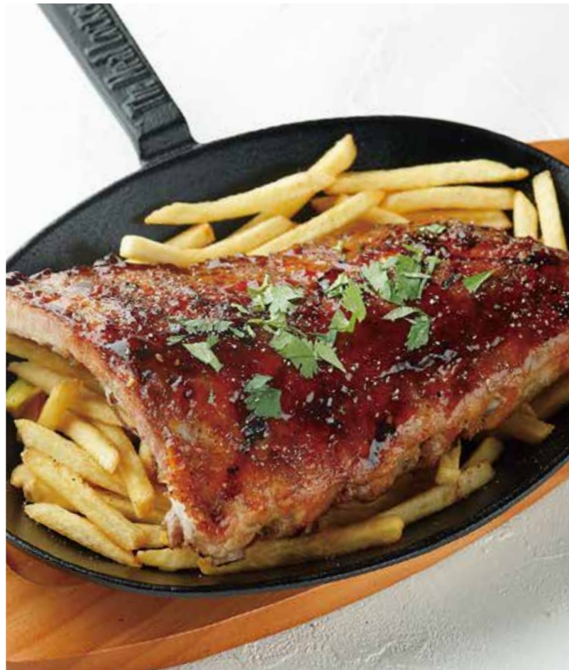
GRILLED PORK BACK RIB ポークバックリブ 税別 ¥1,909 (税込み ¥2,100)