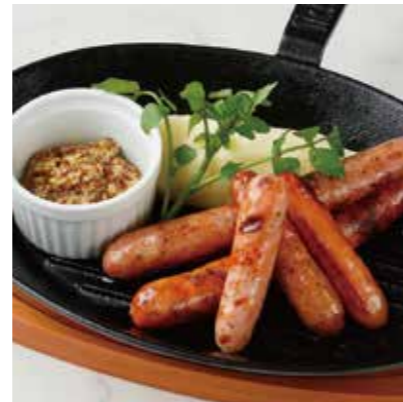
GRILLED SAUSAGES ソーセージのグリル 税別 ¥954 (税込み ¥1,050)