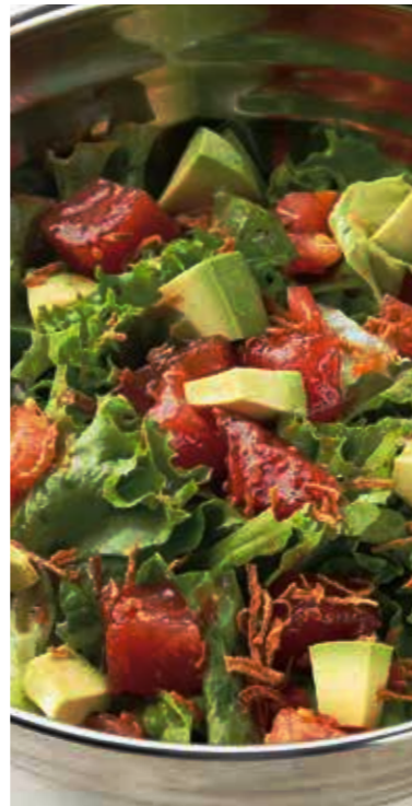
TUNA & AVOCADO SALAD マグロとアボカドのサラダ