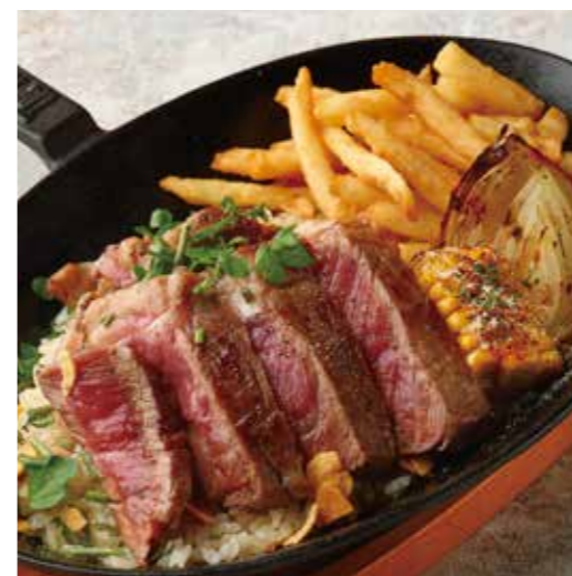
BEEF & BEEF WITH GARLIC RICE TEPPAN PLATE ビーフ&ビーフ (150g) とガーリックライスの 鉄板プレート 税別 ¥1,500 (税込み ¥1650)