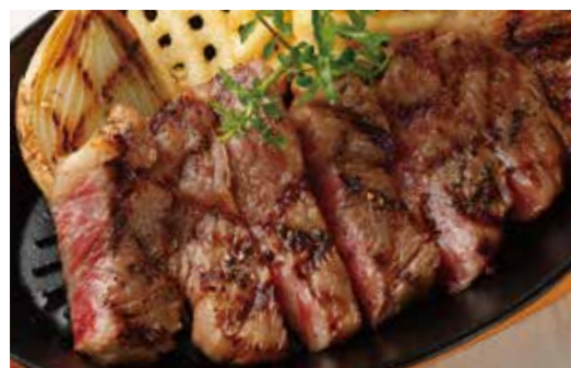
KUROGE WAGYU BEEF SIRLOIN STEAK 国産 黒毛和牛 サーロインステーキ (180g) 税別 ¥5,410 (税込み ¥5,950)