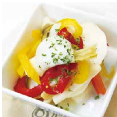
HOMEMADE PICKLES 自家製ピクルス 税別 ¥500 (税込み ¥550)