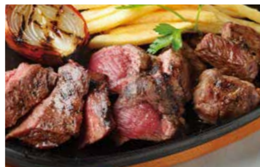
ASSORTED 3 PARTS STEAK TOP BLADE MUSCLE, OUTSIDE SKIRT, & OTHER PARTS OF THE DAY 3種ミックスステーキ (ミスジ、ハラミ、ミックスカット) 税別 ¥2,546 (税込み ¥2,800)