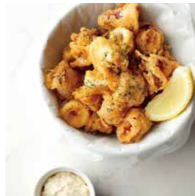
CALAMARI FRITTER カラマリフリット 税別 ¥636 (税込み ¥700)