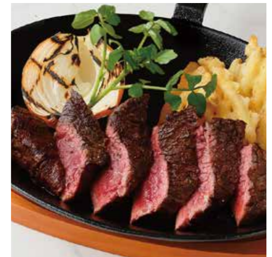
BEEF TOP BLADE MUSCLE STEAK ミスジステーキ (180g) 税別 ¥1,710 (税込み ¥1,880)