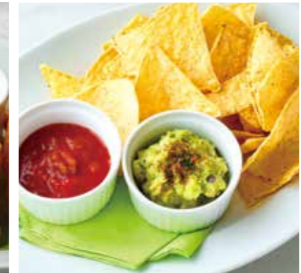
AVOCADO DIP & TORTILLA CHIPS アボカドディップとトルティーヤチップス 税別 ¥727 (税込み ¥800)