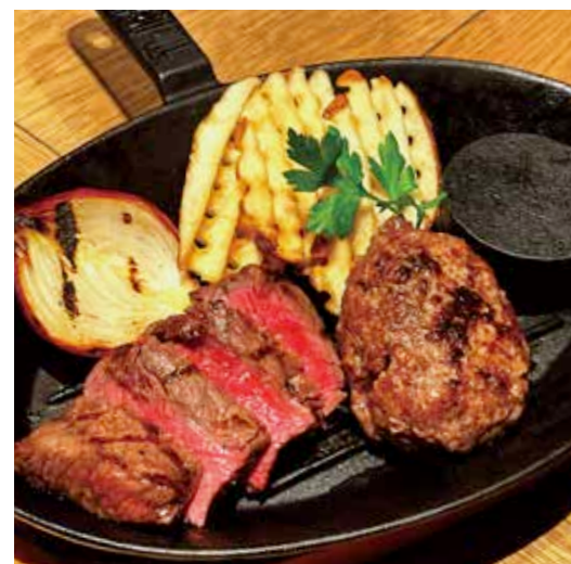
BEEF RUMP STEAK & HAMBURG ランプステーキ (100g) & ハンバーグ (150g) 税別 ¥1,636 (税込み ¥1,800)