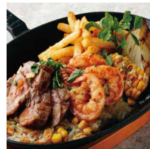
BEEF & SHRIMP WITH GARLIC RICE TEPPAN PLATE ビーフ&シュリンプ とガーリックライスの 鉄板プレート 税別 ¥1,500 (税込み ¥1650)