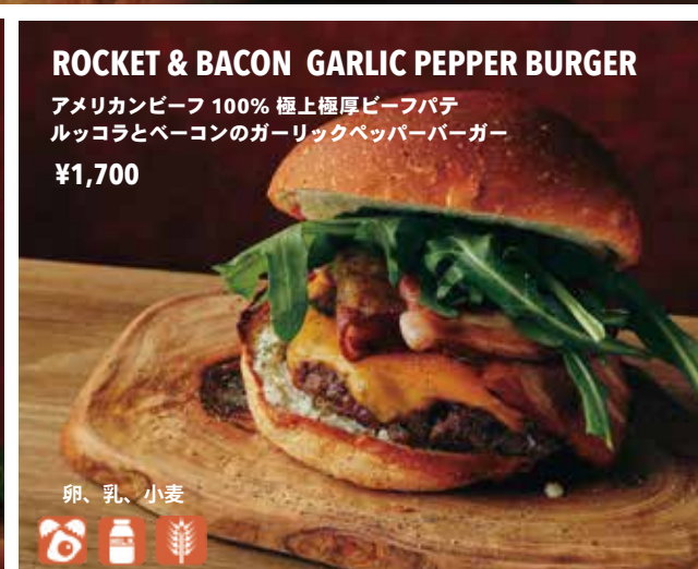
ROCKET & BACON GARLIC PEPPER BURGER アメリカンビーフ 100% 極上極厚ビーフパテ ルッコラとベーコンのガーリックペッパーバーガー ¥1,700