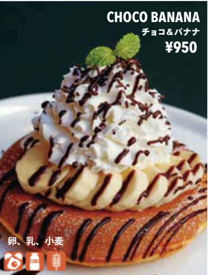
CHOCO BANANA チョコ&バナナ ¥950