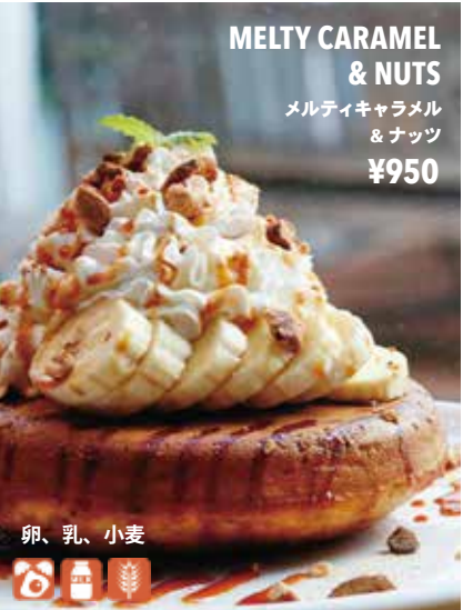
MELTY CARAMEL & NUTS メルティキャラメル & ナッツ ¥950