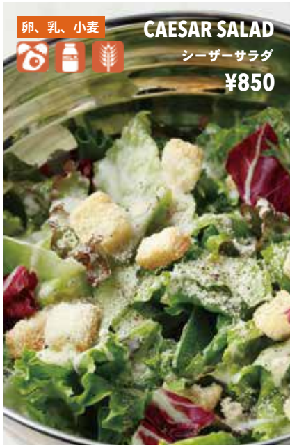
卵、乳、小麦 CAESAR SALAD シーザーサラダ ¥850