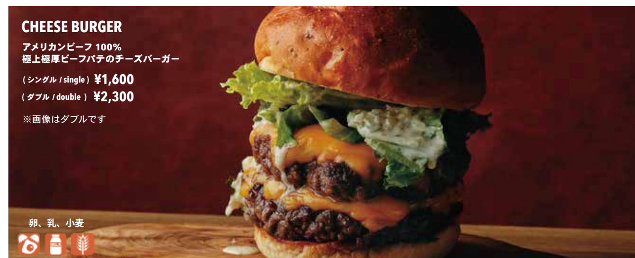
CHEESE BURGER アメリカンビーフ 100% 極上極厚ビーフパテのチーズバーガー (シングル / single) ¥1,600 (ダブル / double) ¥2,300 ※画像はダブルです