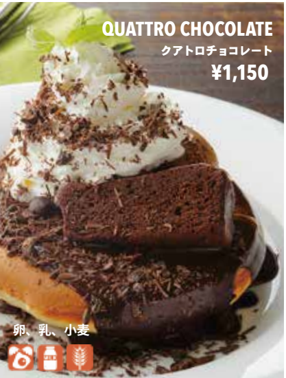
QUATTRO CHOCOLATE クアトロチョコレート ¥1,150