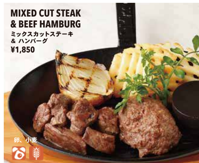
MIXED CUT STEAK & BEEF HAMBURG ミックスカットステーキ & ハンバーグ ¥1,850