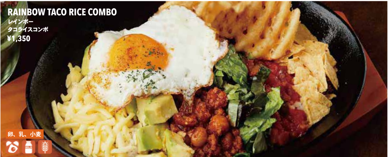
RAINBOW TACO RICE COMBO レインボー タコライスコンボ ¥1,350

黒毛和牛サーロインステーキ（100g）コンボ ..... ¥2,950 WAGYU BEEF SIRLOIN STEAK (100g) COMBO