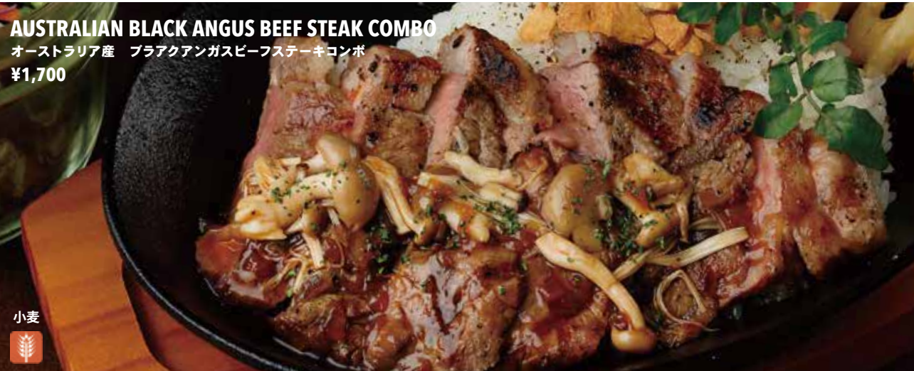
AUSTRALIAN BLACK ANGUS BEEF STEAK COMBO オーストラリア産 ブラックアンガスビーフステーキコンボ ¥1,700