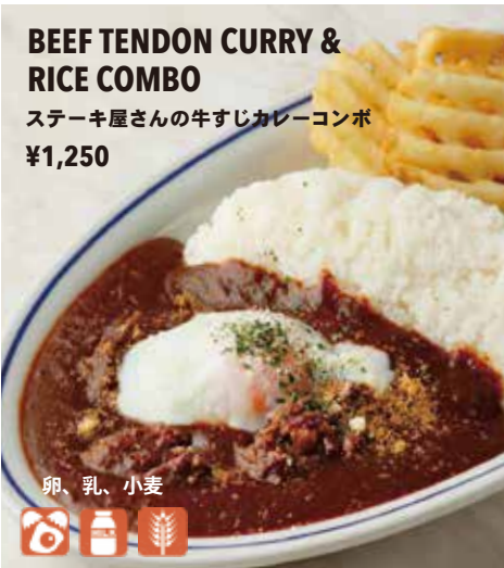
BEEF TENDON CURRY & RICE COMBO ステーキ屋さんの牛すじカレーコンボ ¥1,250