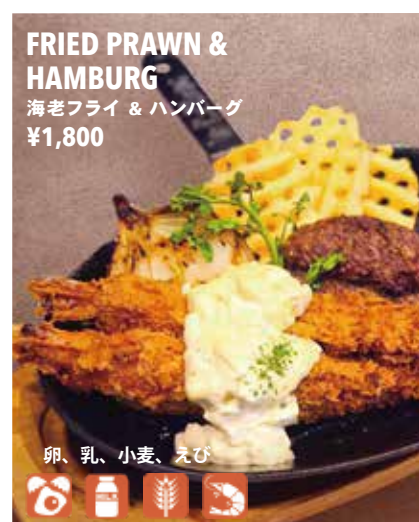
FRIED PRAWN & HAMBURG 海老フライ & ハンバーグ ¥1,800