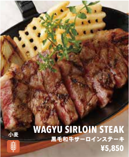
WAGYU SIRLOIN STEAK 黒毛和牛サーロインステーキ ¥5,850