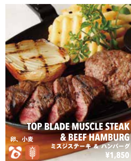
TOP BLADE MUSCLE STEAK & BEEF HAMBURG ミスジステーキ & ハンバーグ ¥1,850