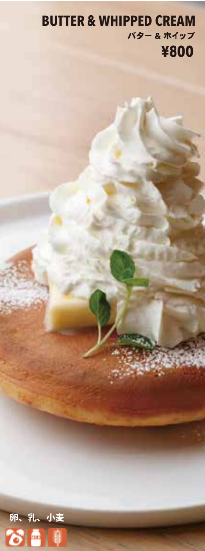
BUTTER & WHIPPED CREAM バター & ホイップ ¥800