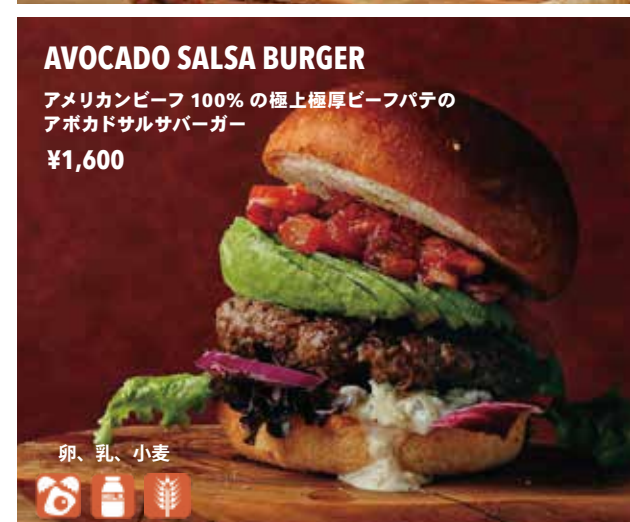
AVOCADO SALSA BURGER アメリカンビーフ 100% の極上極厚ビーフパテの アボカドサルサバーガー ¥1,600