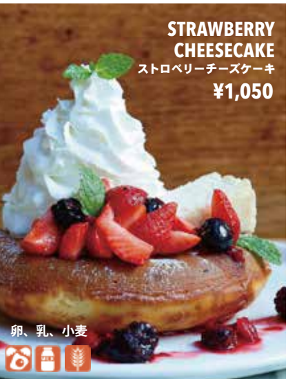
STRAWBERRY CHEESECAKE ストロベリーチーズケーキ ¥1,050