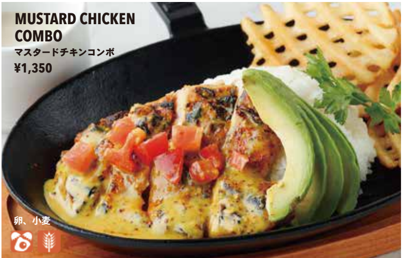
MUSTARD CHICKEN COMBO マスタードチキンコンボ ¥1,350