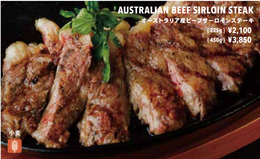
AUSTRALIAN BEEF SIRLOIN STEAK オーストラリア産ビーフサーロインステーキ (225g) ¥2,100 (450g) ¥3,850

with Fried Potato & Roasted Onion フライドポテト & ローストオニオン付き