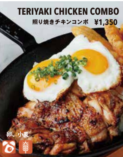
TERIYAKI CHICKEN COMBO 照り焼きチキンコンボ ¥1,350