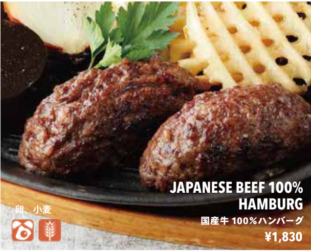
JAPANESE BEEF 100% HAMBURG 国産牛 100%ハンバーグ ¥1,830

ミスジステーキ (180g) ¥1,850 BEEF TOP BLADE MUSCLE STEAK