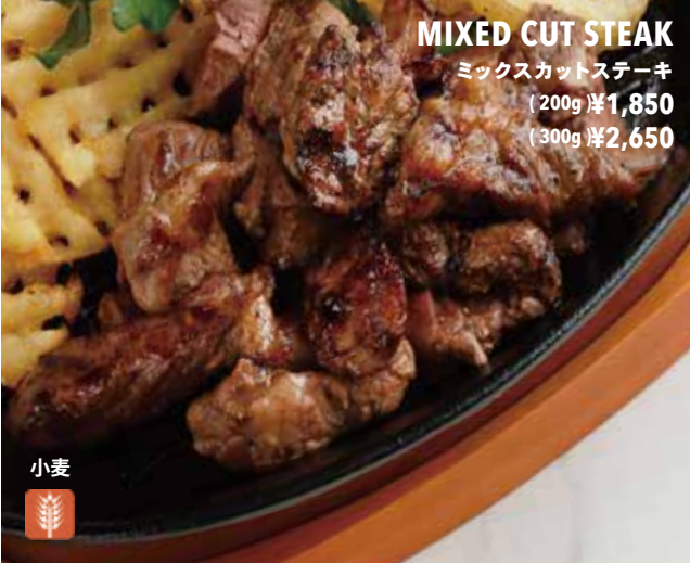
MIXED CUT STEAK ミックスカットステーキ (200g) ¥1,850 (300g) ¥2,650