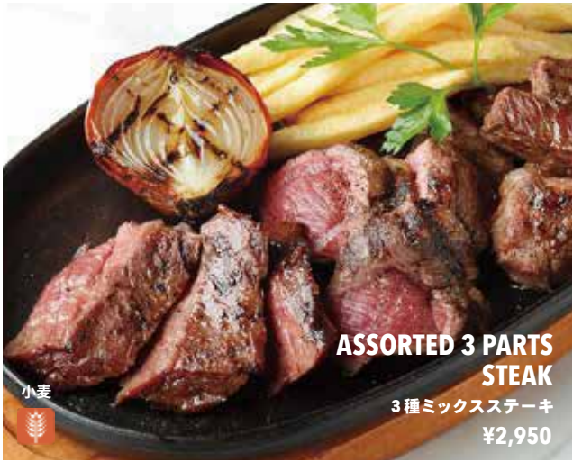
ASSORTED 3 PARTS STEAK 3 種ミックスステーキ ¥2,950