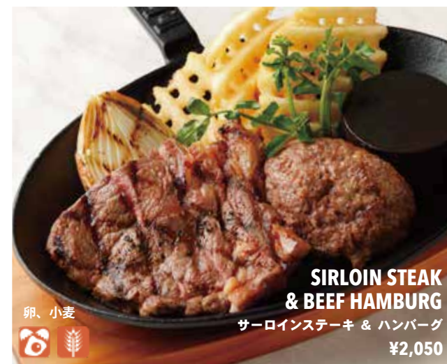
SIRLOIN STEAK & BEEF HAMBURG サーロインステーキ & ハンバーグ ¥2,050