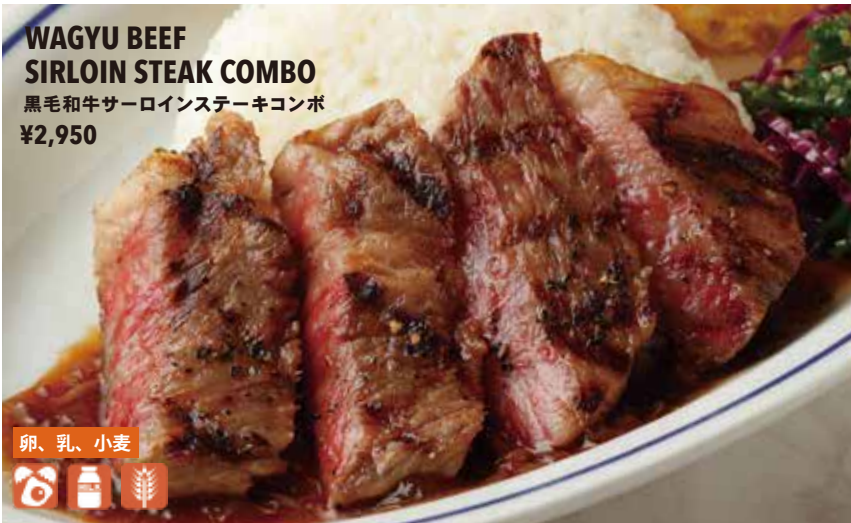
WAGYU BEEF SIRLOIN STEAK COMBO 黒毛和牛サーロインステーキコンボ ¥2,950