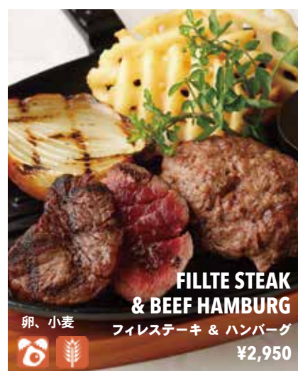
FILLTE STEAK & BEEF HAMBURG フィレステーキ & ハンバーグ ¥2,950