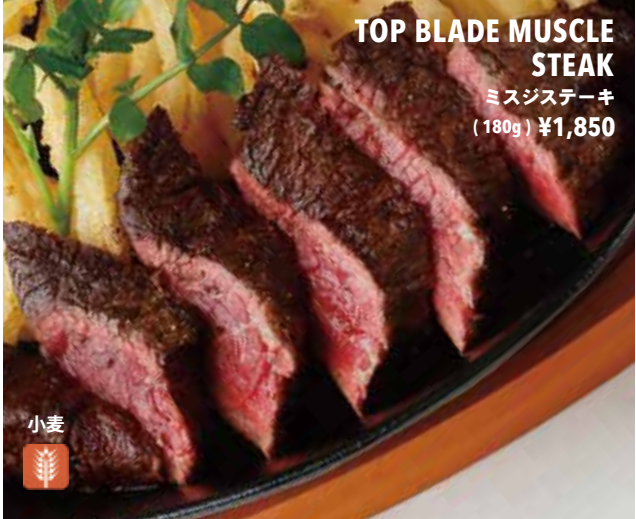
TOP BLADE MUSCLE STEAK ミスジステーキ (180g) ¥1,850

T ボーンステーキ (アメリカ産ブラックアンガス) (450g) ¥6,350 U.S. BLACK ANGUS BEEF T-BONE STEAK