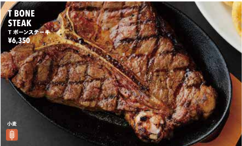
T BONE STEAK T ボーンステーキ ¥6,350

サーロインステーキ (オーストラリア産) (225g) ¥2,100 (450g) ¥3,850 AUSTRALIAN BEEF SIRLOIN STEAK