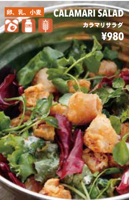
卵、乳、小麦 CALAMARI SALAD カラマリサラダ ¥980