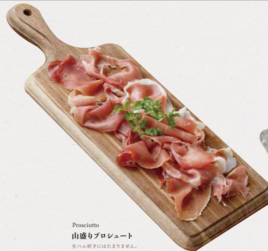
Prosciutto 山盛りプロシュート 生ハム好きにはたまりません。