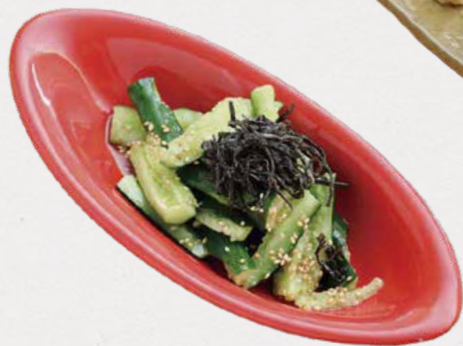
Cucumber w/ salted kelp 塩昆布たたきキュウリ さっぱり浅漬け風。