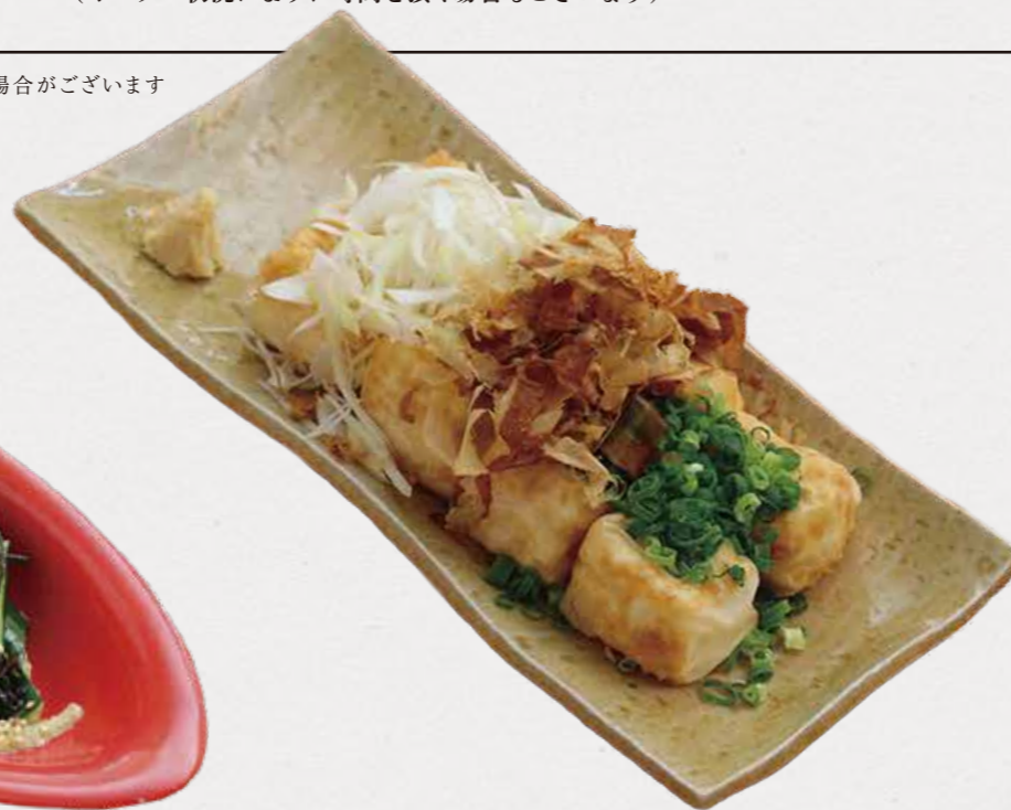
Fried tofu 揚げたて厚揚げ 薬味のせ たっぷりの葱と花カツオ、鹿児島醤油で。