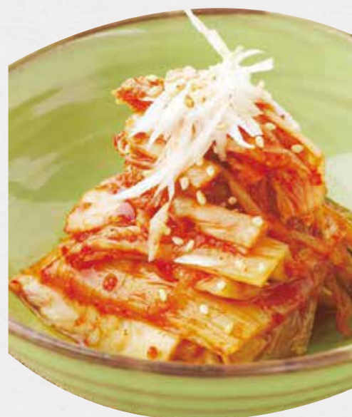
Kimch 白菜キムチ テーブルの上いつでも。