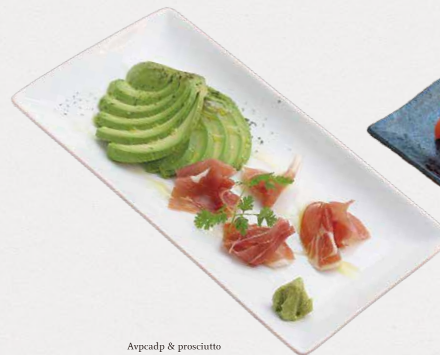
Avocado & prosciutto アボカドと生ハムの刺身 生ハム好きにはたまりません。