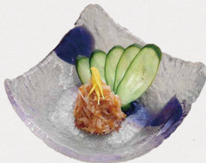
Chicken cartilage w/ umeboshi sauce コラーゲン梅なんこつ コリコリ食感が楽しい!