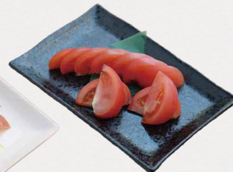
Chilled fresh tomato 冷やしトマト 旬のトマトをシンプルに。