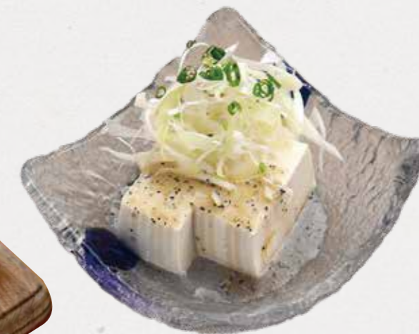
Tofu w/ scallion salt sauce さっぱりネギ塩やっこ ヘルシーな豆腐にさっぱり塩ダレ。