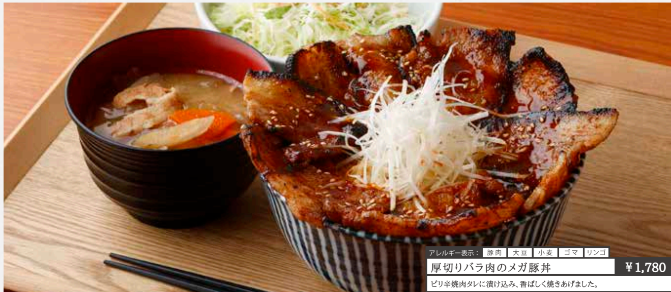
アレルギー表示: 豚肉 大豆 小麦 ゴマ リンゴ 厚切りバラ肉のメガ豚丼 ¥1,780 ビリ辛焼肉タレに漬け込み、香ばしく焼きあげました。