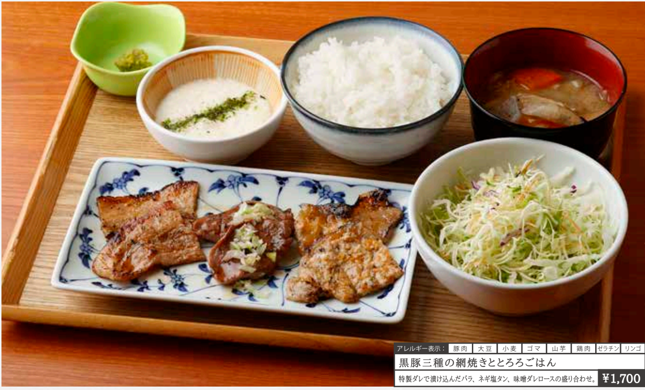
アレルギー表示: 豚肉 大豆 小麦 ゴマ 山芋 鶏肉 ゼラチン リンゴ 黒豚三種の網焼きととろろごはん 特製ダレで漬け込んだバラ、ネギ塩タン、味噌ダレロースの盛り合わせ。 ¥1,700