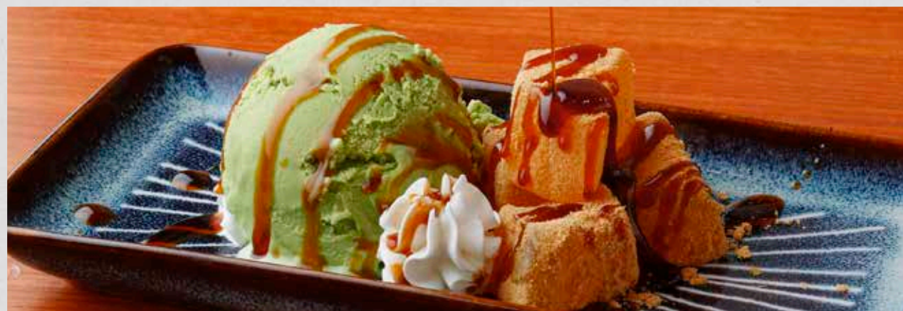
抹茶アイスとわらびもち ~黒蜜がけ~ 抹茶アイスとひんやりわらび餅 ¥380