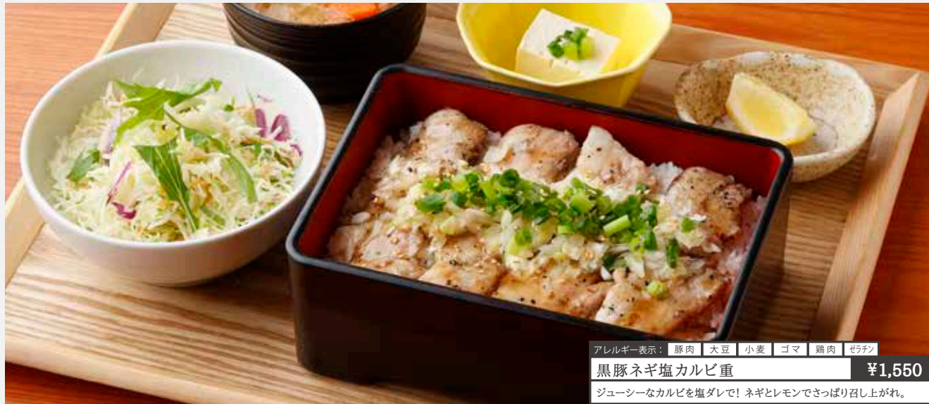
アレルギー表示: 豚肉 大豆 小麦 ゴマ 鶏肉 ゼラチン 黒豚ネギ塩カルビ重 ¥1,550 ジューシーなカルビを塩ダレで! ネギとレモンでさっぱり召し上がれ。