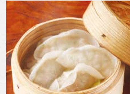
黒ぶた蒸し餃子 溢れる肉汁を想像してください 4個 ¥750