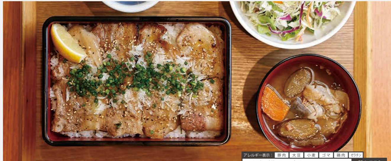
アレルギー表示: 豚肉 大豆 小麦 コマ 鶏肉 ゼラチン 黒豚ネギ塩カルビ重 ¥1,550 ジューシーなカルビを塩ダレで! ネギとレモンでさっぱり召し上がれ。