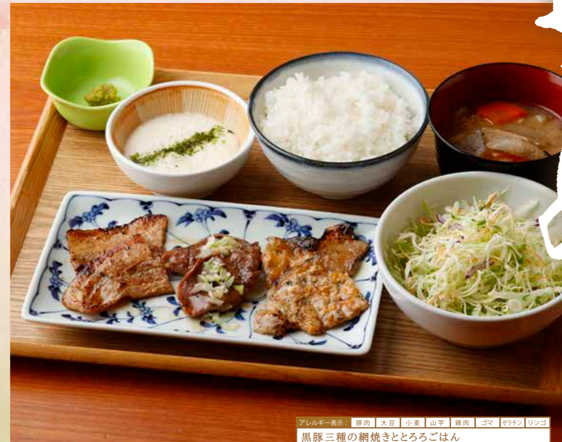
アレルギー表示：豚肉 大豆 小麦 山芋 鶏肉 ゴマ ゼラチン リンゴ 黒豚三種の網焼きととろろごはん 特製ダレで漬け込んだバラ、ネギ塩タン、味噌ダレロースの盛り合わせ。 ¥1700