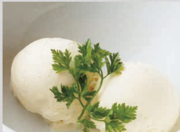
アイス(バニラ・チョコレート・抹茶・ヨーグルト) お食事の後にどうぞ! ¥330