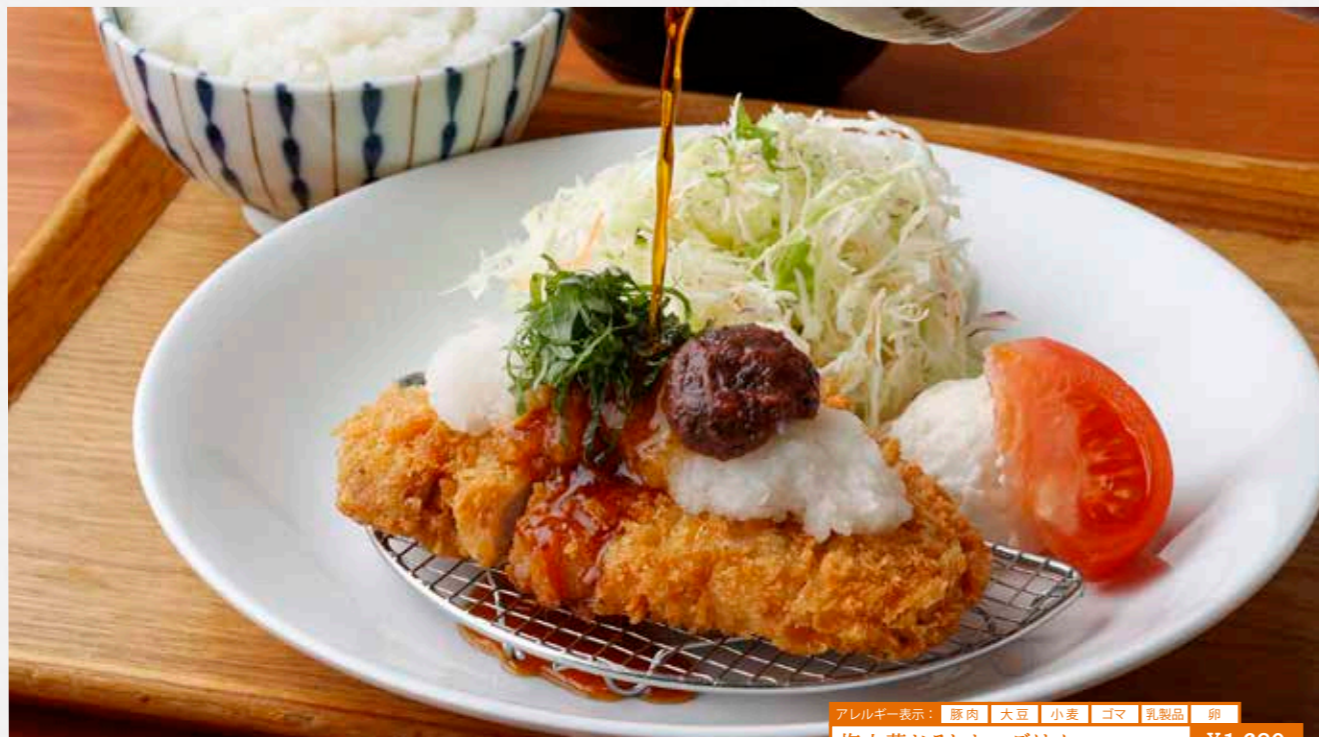
アレルギー表示: 豚肉 大豆 小麦 ゴマ 乳製品 卵 梅大葉おろしかつごはん ¥1,680 サクッと揚がったロースカツに、さっぱり薬味をのせました。