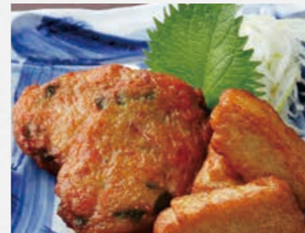
寺田屋の つけ揚げ(さつま揚げ) 鹿児島の新鮮な魚だけを使い 一つ一つ手作りで作りました ¥780