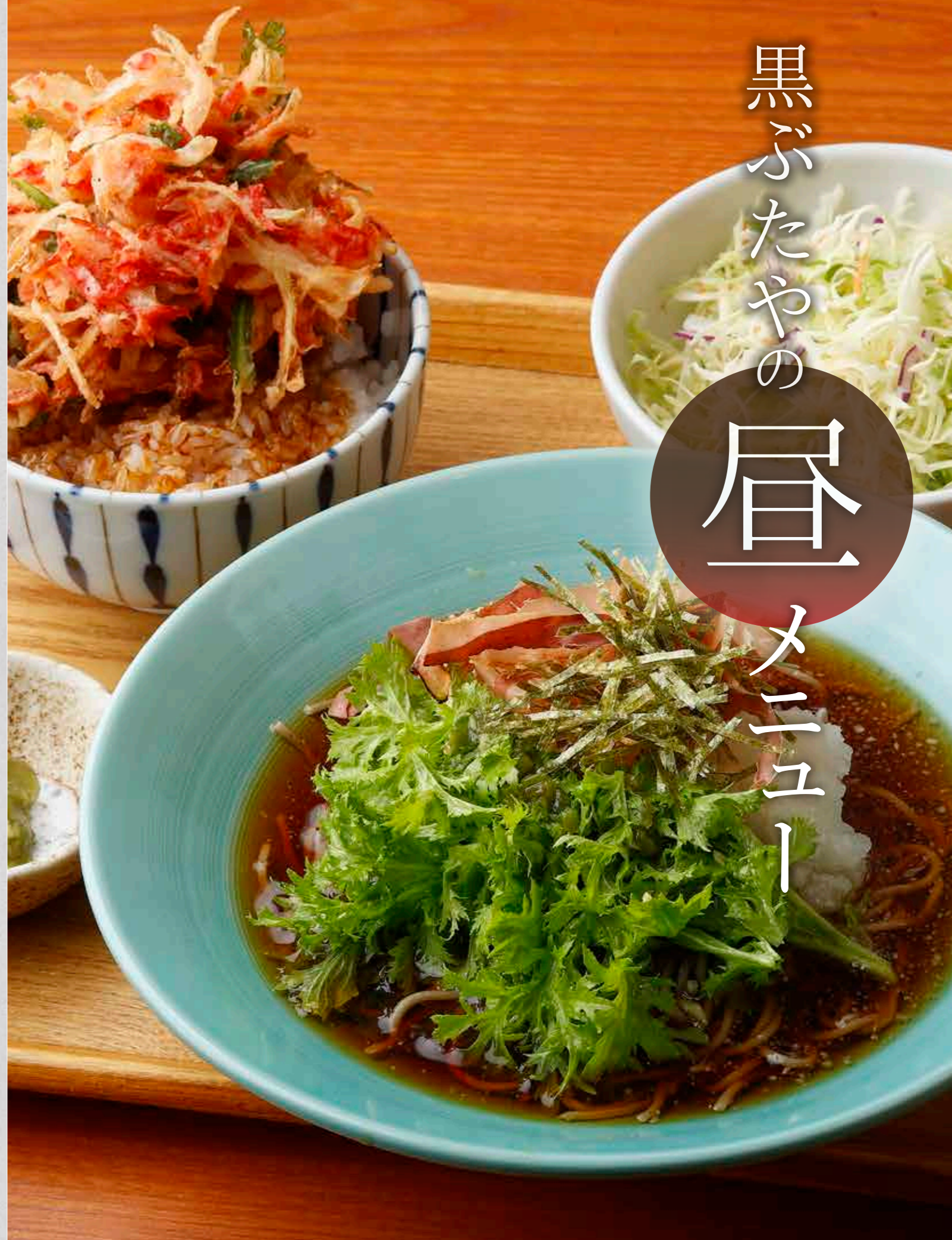
わさび菜おろしそばと春のかき揚げそば