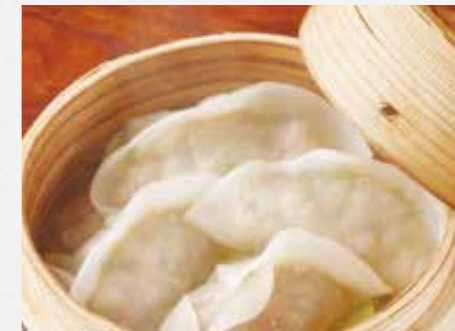
黒ぶた蒸し餃子 溢れる肉汁を想像してください 4個 ¥750