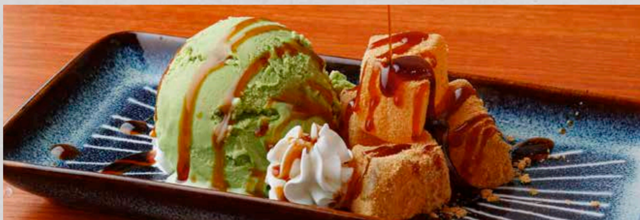
抹茶アイスとわらびもち ~黒蜜がけ~ 抹茶アイスとひんやりわらび餅 ¥380