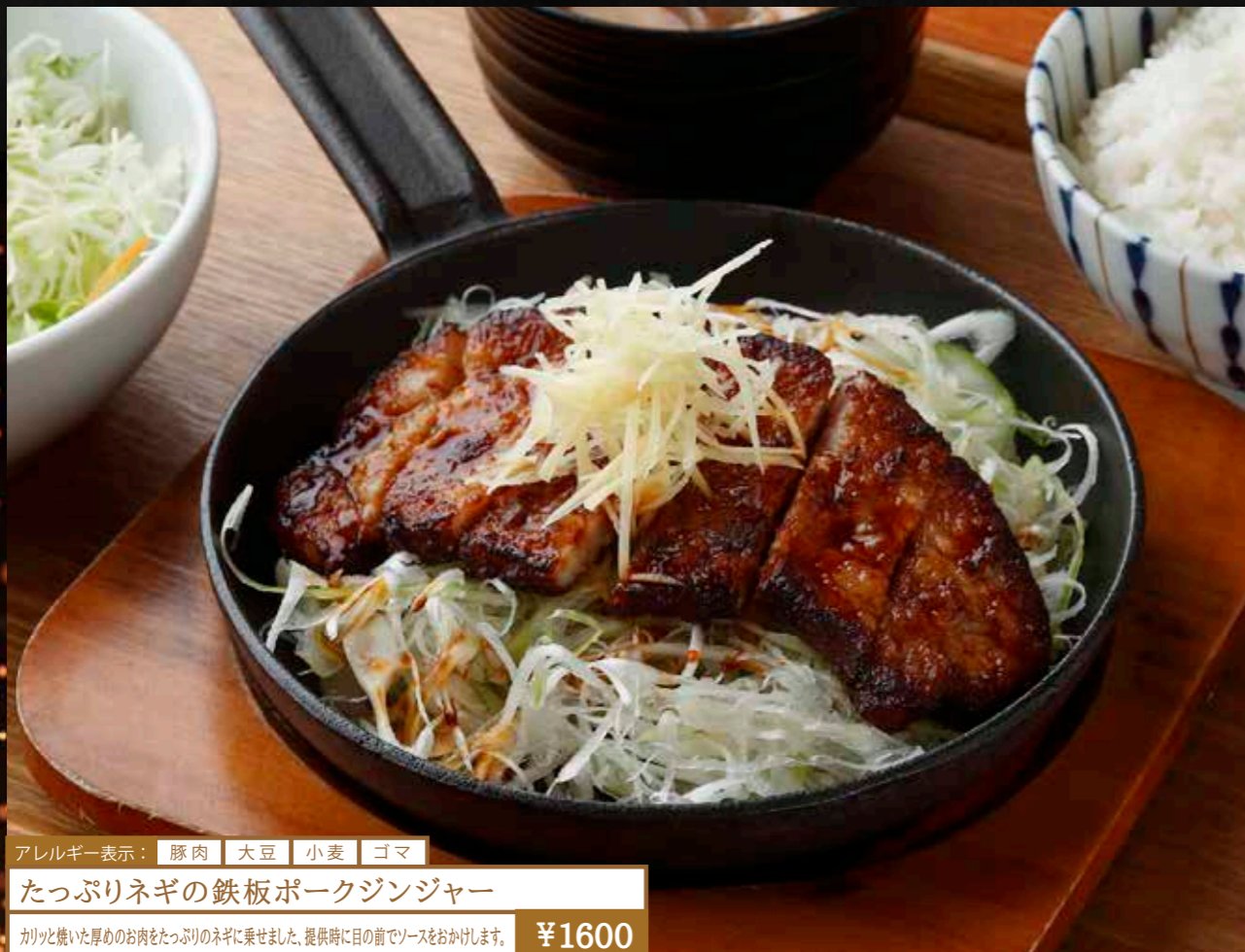
アレルギー表示： 豚肉 大豆 小麦 ゴマ たっぷりネギの鉄板ポークジンジャー カリッと焼いた厚めのお肉をたっぷりのネギに乗せました。提供時に目の前でソースをおかけします。 ¥1600