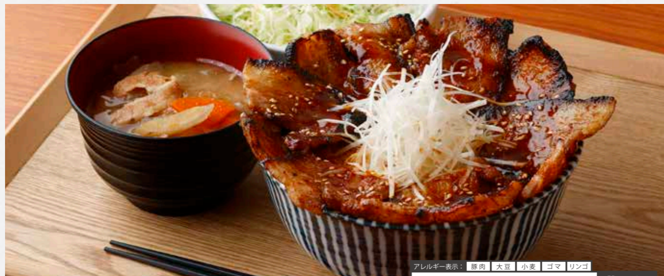
アレルギー表示: 豚肉 大豆 小麦 コマ リンゴ 厚切りバラ肉のメガ豚丼 ¥1,780 ピリ辛焼肉タレに漬け込み、香ばしく焼きあげました。