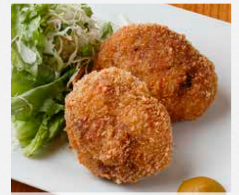
黒豚メンチカツ スタッフいち押しメニュー! 溢れ出す肉汁 2個 ¥750