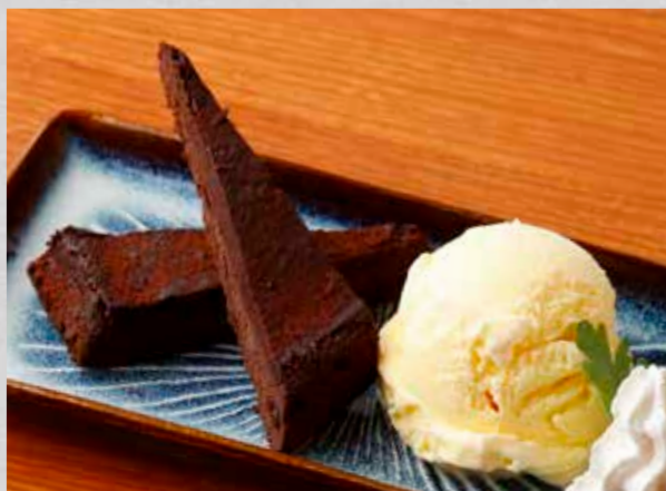
ガトーショコラ ~バニラアイス添え~ しっとり濃厚な仕上がります ¥480