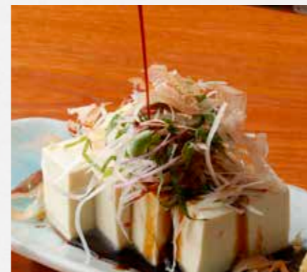
薬味たっぷり冷奴 鹿児島のブレンド醤油で! ¥480