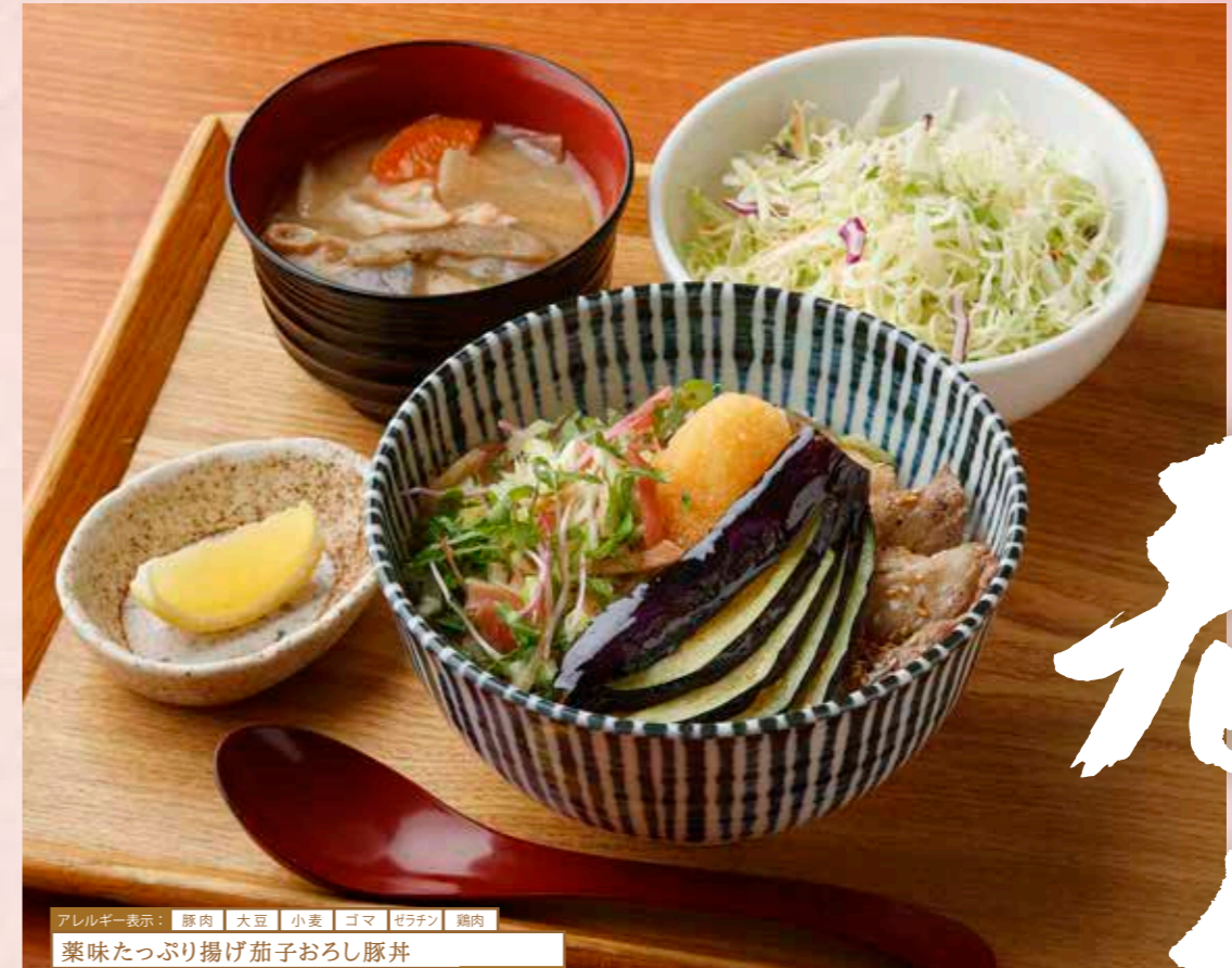
アレルギー表示：豚肉 大豆 小麦 ゴマ ゼラチン 鶏肉 薬味たっぷり揚げ茄子おろし豚丼 レモンを搾ってさっぱりと! ¥1380