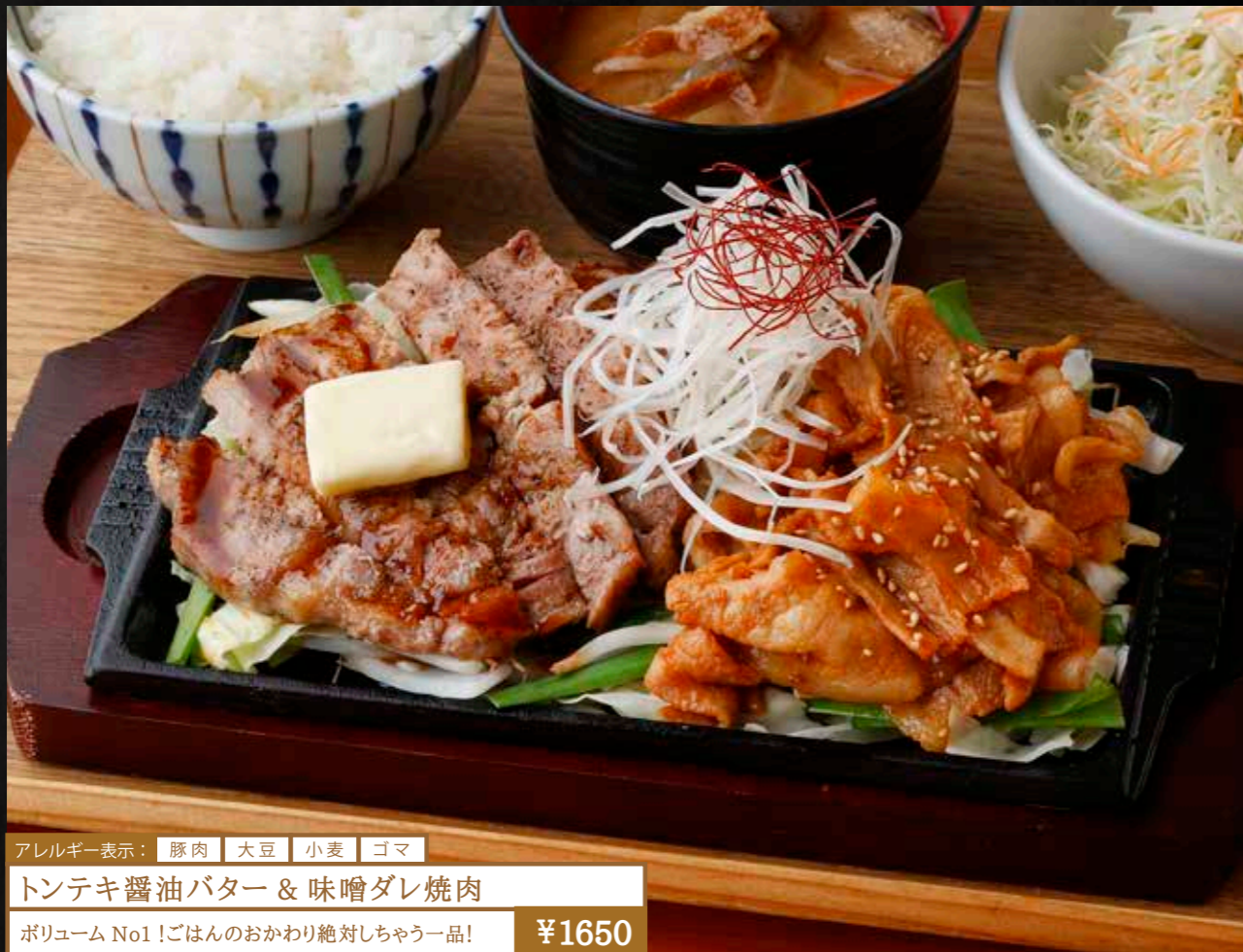
アレルギー表示： 豚肉 大豆 小麦 ゴマ トンテキ醤油バター & 味噌ダレ焼肉 ボリューム No1 !ごはんのおかわり絶対しちゃう一品! ¥1650