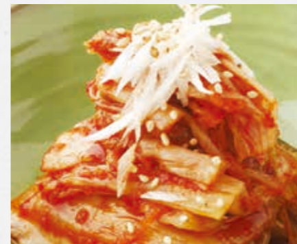
白菜キムチ テーブルの上いつでも ¥450