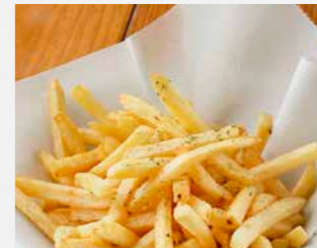
フライドポテト 塩味 or ガーリック みんな大好きフライドポテト ¥580