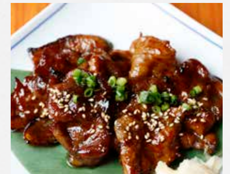
特製ダレのモモ焼き タレをもみ込んで焼き 上げました ¥750