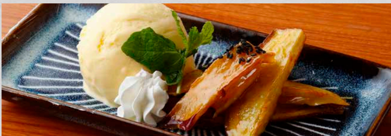
バニラアイスと大学芋 バニラアイスとアツアツの自家製大学芋 ¥380