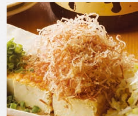
どっちらネギの厚揚げ たっぶりのネギと花かつお ¥680 / ハーフサイズ ¥480