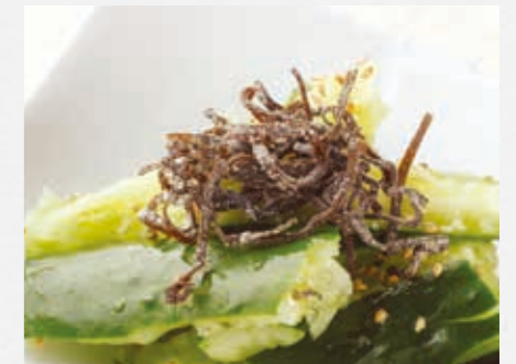
塩昆布たたききゅうり さっぱり浅漬け風の人気メニュー ¥480