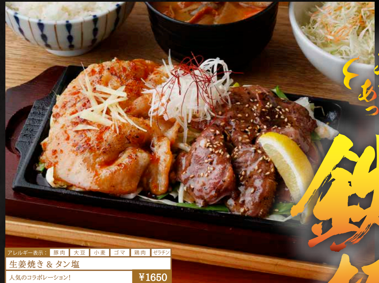
アレルギー表示： 豚肉 大豆 小麦 ゴマ 鶏肉 ゼラチン 生姜焼き & タン塩 人気のコラボレーション! ¥1650