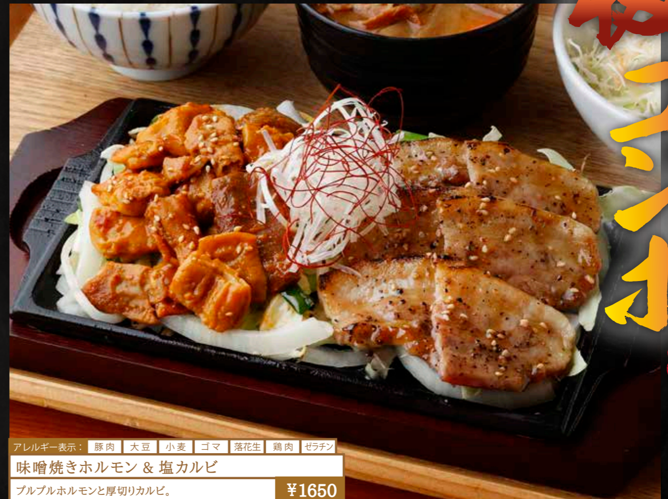
アレルギー表示： 豚肉 大豆 小麦 ゴマ 落花生 鶏肉 ゼラチン 味噌焼きホルモン & 塩カルビ プルプルホルモンと厚切りカルビ。 ¥1650