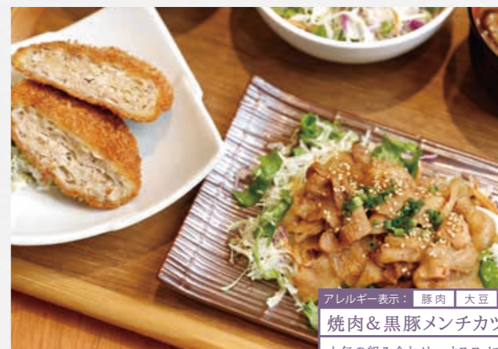
Sauteed pork & Minced pork cutlet

アレルギー表示: 豚肉 大豆 小麦 卵 ゴマ リンゴ 焼肉&黒豚メンチカツコンボ ¥1,380 +税 人気の組み合わせ。オススメです!