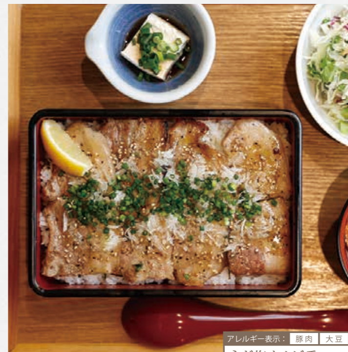
Broiled Short Rib w/scallion salt sauce on the rice