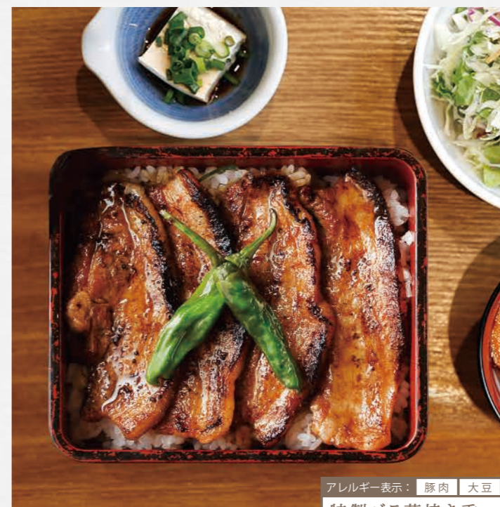
Soy sauce broiled pork on the rice

Choice : Steak sauce or Lemon salt sauce