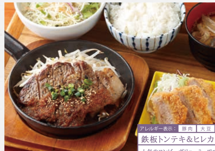
Pork steak & Pork fillet cutlet

アレルギー表示: 豚肉 大豆 小麦 卵 ゴマ リンゴ 乳 鉄板トンテキ&ヒレカツのコンボ ¥1,430 +税 人気のコンビ、ボリュームです!