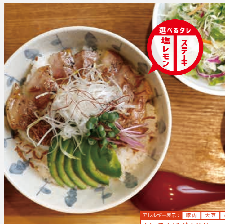
Pork steak & avocado rice bowl

Choice : Steak sauce or Lemon salt sauce