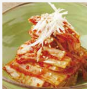
白菜キムチ テーブルの上に いつでも。