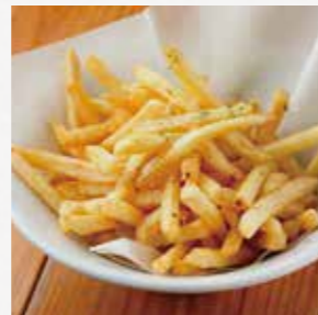
フライドポテト みんな大好き フライドポテト。