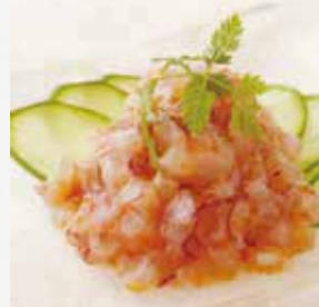
コラーゲン 梅なんこつ コリコリ食感の軟骨。 コラーゲンたっぷりです。