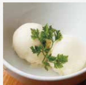
本日のアイス スタッフにおたずね下さい。