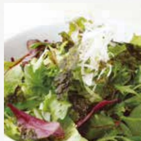
韓国海苔の グリーンサラダ 新鮮野菜に 韓国風醤油ベースの ドレッシングで。