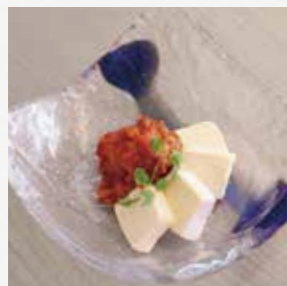
チャンジャ クリームチーズ 相性ばっちりの 組み合わせです。