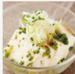
ネギ塩やっこ ヘルシーな豆腐と さっぱり塩ダレ。