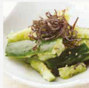
塩昆布 たたききゅうり さっぱり浅漬け風の 人気メニュー。