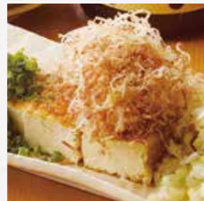
どっちゃんネギの 厚揚げ たっぷりのネギと花かつお、 鹿児島醤油で。