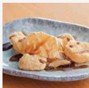
わらび餅 やさしい甘味、 食後にいかが？