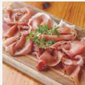
ハモンセラーノ イベリコ豚の 生ハムです。