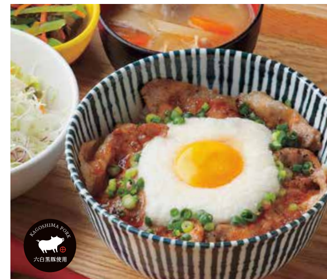
黒ぶたとろろ月見丼 ¥1,500