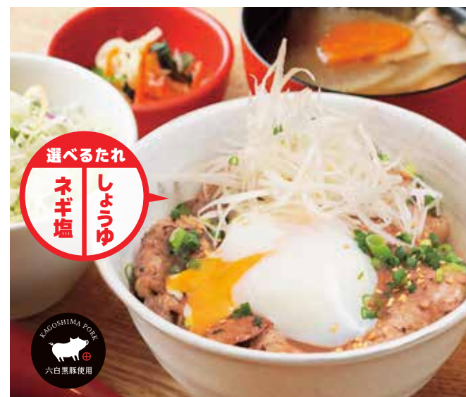
網焼き黒ぶた丼 ¥1,280 (温玉のせ +¥100)