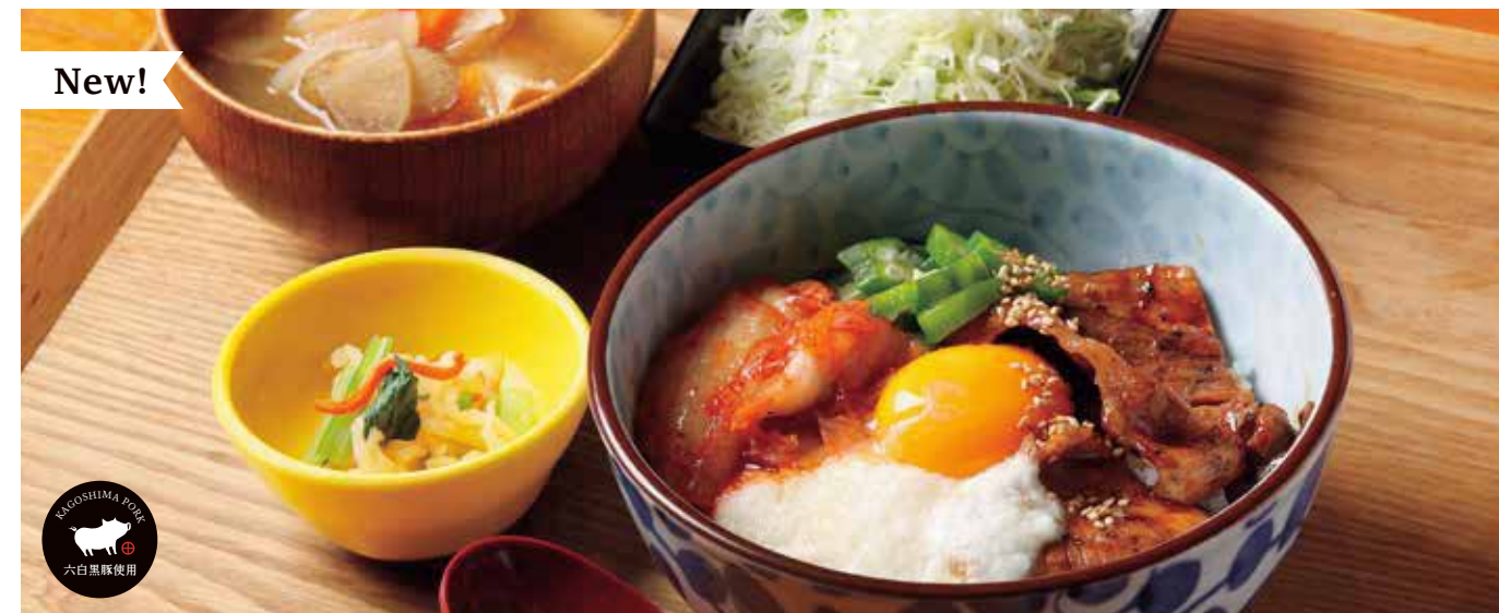
黒ぶたバクダン丼 ¥1,600