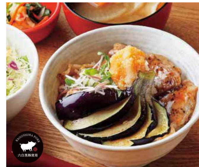
揚げ茄子おろしぶた丼 ¥1,500