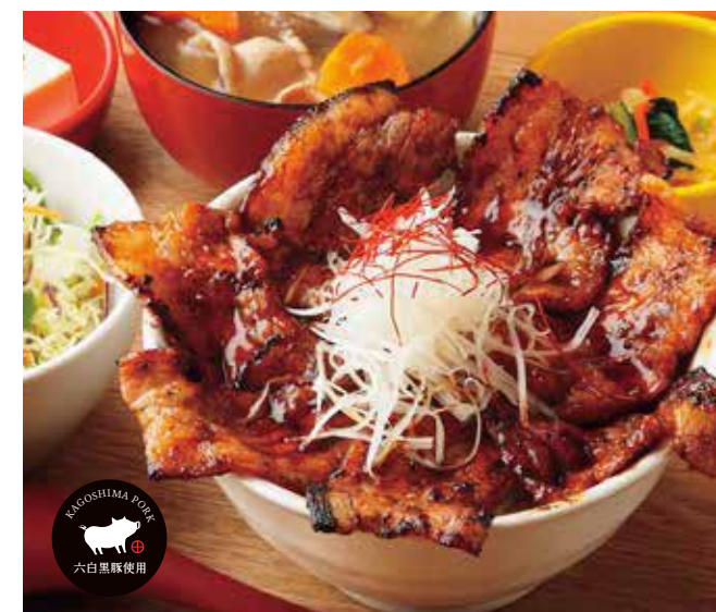
六白黒豚の炙りカルビ丼 ¥1,700