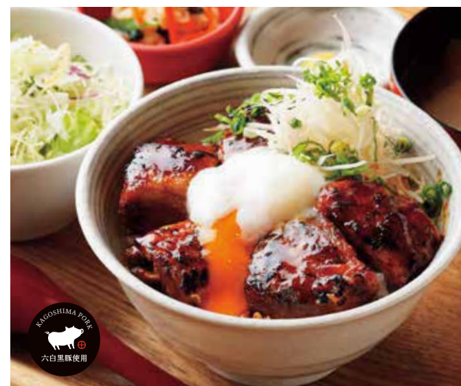
黒ぶたチャーシュー丼 温玉乗せ ¥1,600