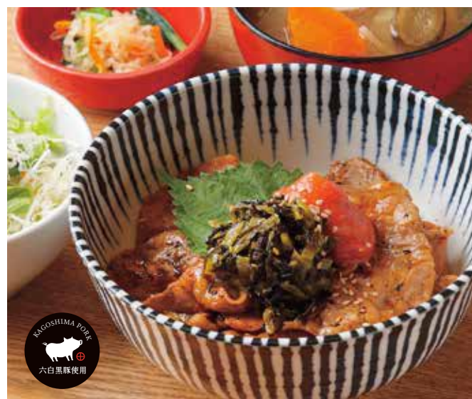
黒ぶた明太高菜丼 ¥1,500

特定原材料： 小麦 / さば / 豚肉 / 大豆 / ごま / ゼラチン （温玉のせ：+卵）