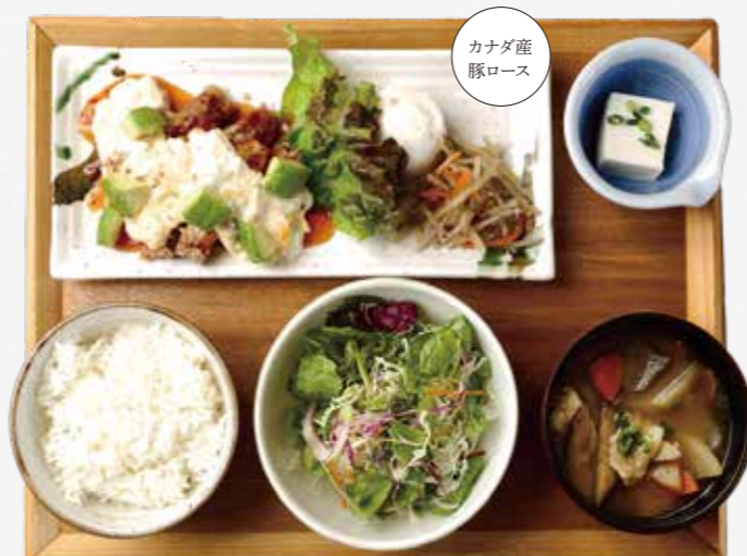
ポーク南蛮ごはん