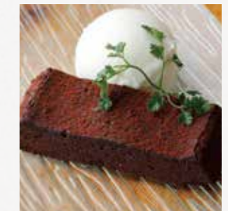
ガトーショコラ しっとり仕上げました。 ¥540