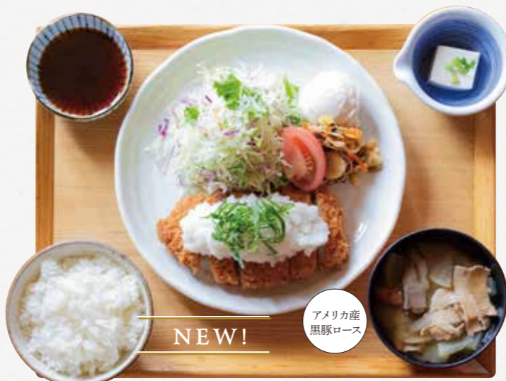
おろしとんかつごはん