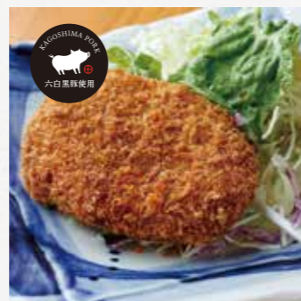
ジュシーメンチカツ ¥380