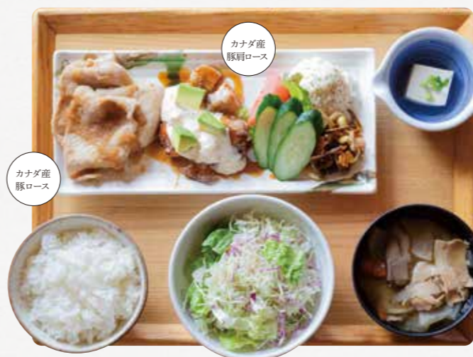
生姜焼きと ポーク南蛮ごはん