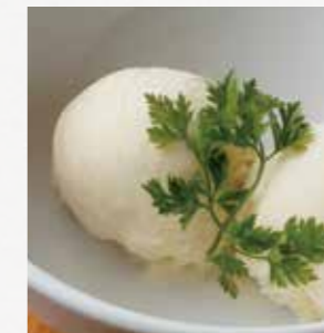
本日のアイス 内容はスタッフまでお尋ね下さい。 ¥330