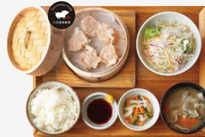
黒ぶたしゅうまいごはん ¥1,380