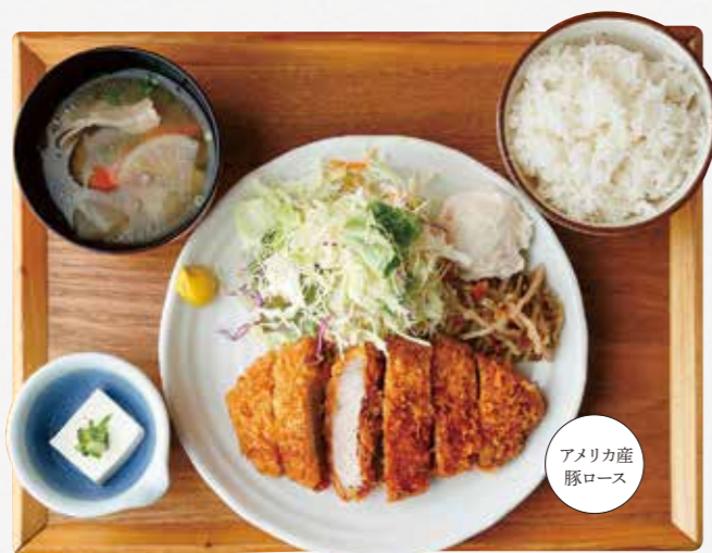
ロースカツごはん