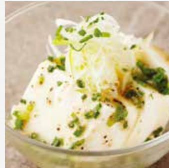
さっぱりネギ塩やっこ ¥500