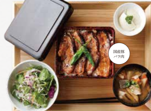
特選豚バラ蒲焼重 ¥1,360