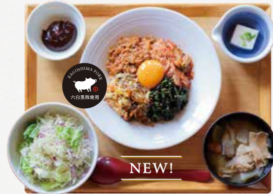
黒ぶたやのビビンバ丼 ¥1,360