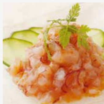
コラーゲン梅なんこつ ¥580