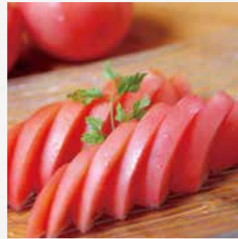
完熟冷やしトマト ¥480