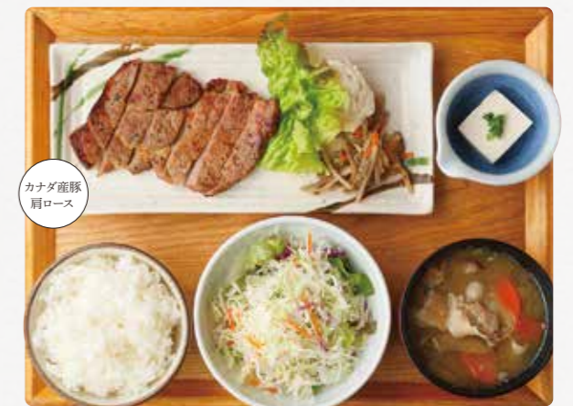
肩ロースの西京味噌焼きごはん ¥1,290