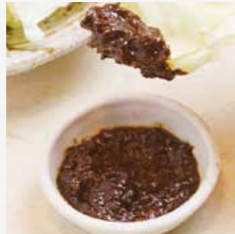
ぶたみそキャベツ ¥330