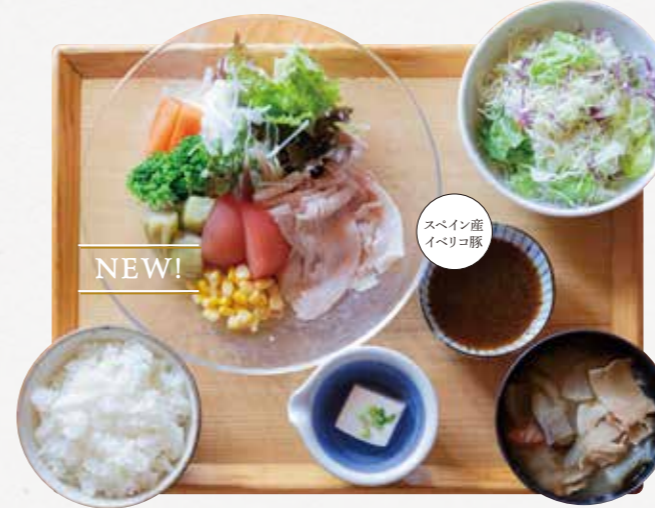
イベリコ豚の冷しゃぶごはん ¥1,380