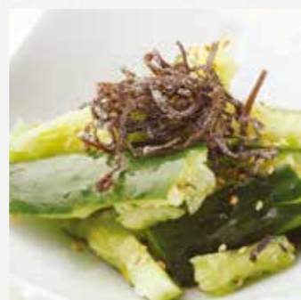
塩昆布たたききゅうり ¥500