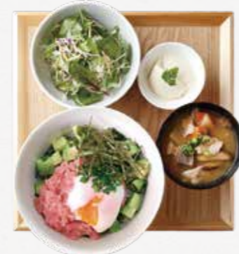
ネギトロアボカド丼 ¥1,250