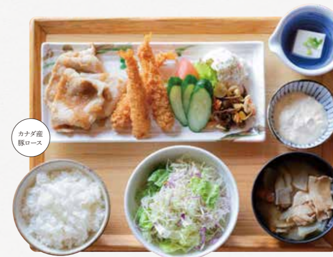
生姜焼きと エビフライごはん

特定原材料: 卵 / 乳 / 小麦 / 豚肉 / さば / 大豆 / ごま / りんご