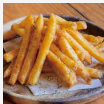
ガーリックフライドポテト ¥600