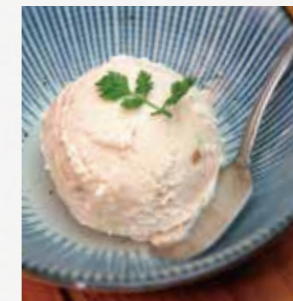
さくらじま黒糖アイス 本場鹿児島の黒糖を使った絶品! ¥480