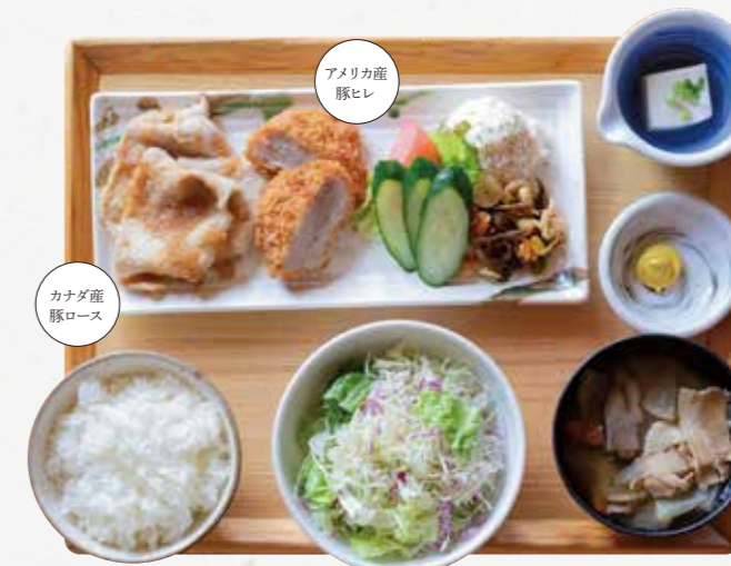
生姜焼きと ヒレカツごはん