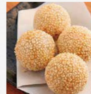
胡麻だんご 熱々のおいしさ! ¥580