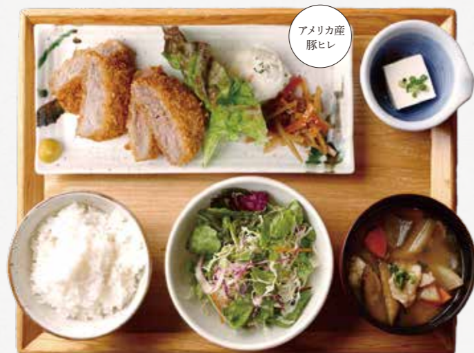
やわらかヒレカツごはん

特定原材料: 卵 / 乳 / 小麦 / えび / 豚肉 / 大豆 / ごま / りんご