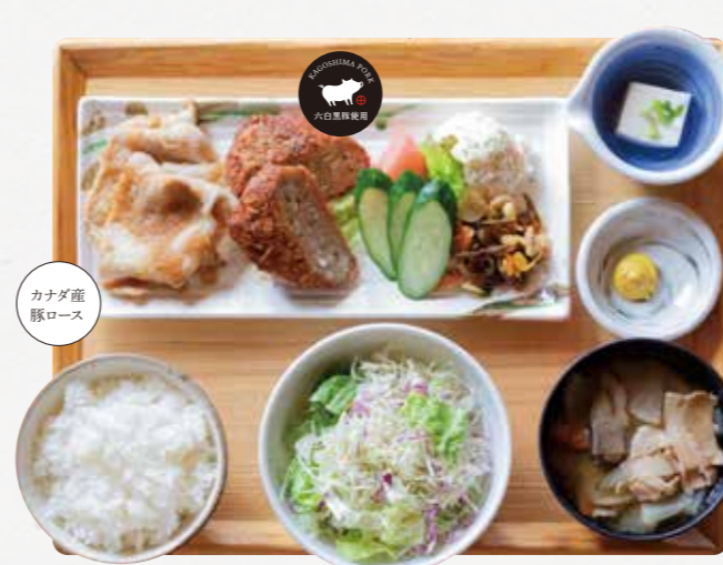
生姜焼きと 六白黒豚メンチカツごはん