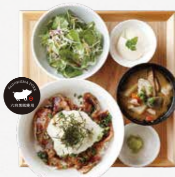
とろろわさびぶた丼 ¥1,190