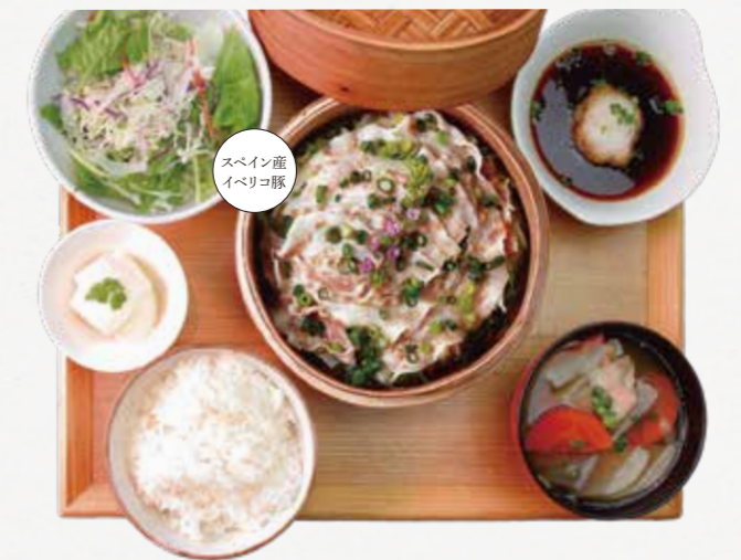
イベリコ豚の蒸ししゃぶごはん ¥1,380