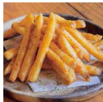
ガーリックフライドポテト