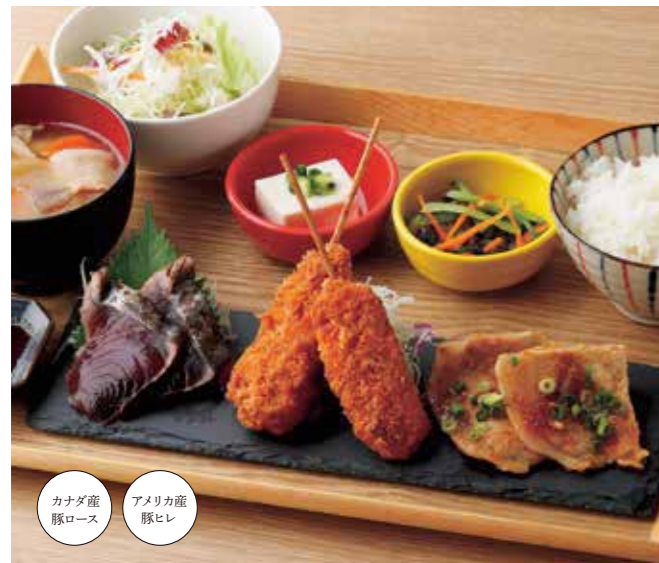
黒ぶたやの満足定食 ¥1,780