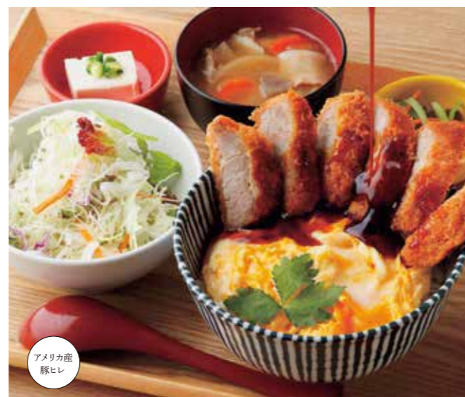
とろたまヒレカツ丼 ¥1,580