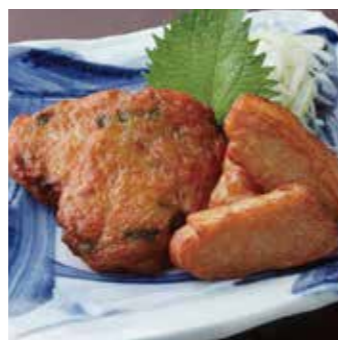
串木野直送 寺田屋のつけ揚げ (さつま揚げ)