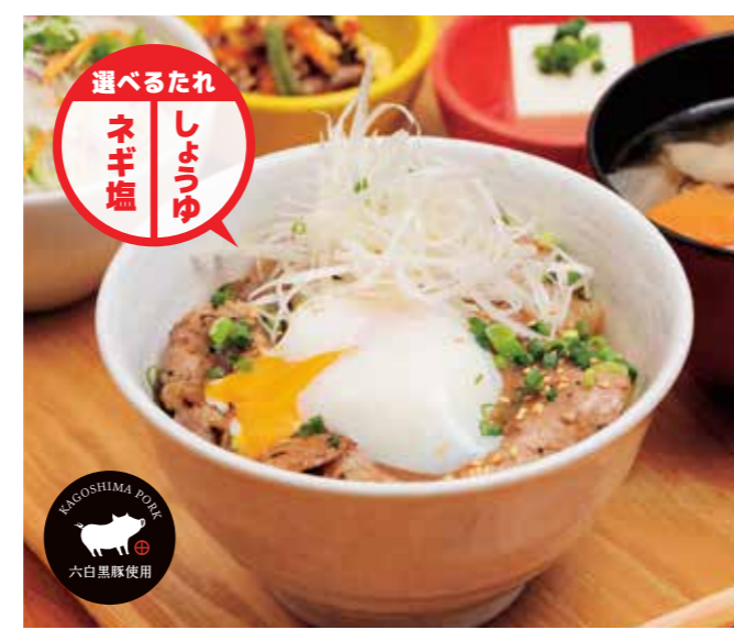
網焼き黒ぶた井 ¥1,180 (温玉のせ +¥100)

人気の黒ぶた井にとろろを乗せて。 特定原材料: 小麦 / さば / 豚肉 / 大豆 / ごま / 山芋