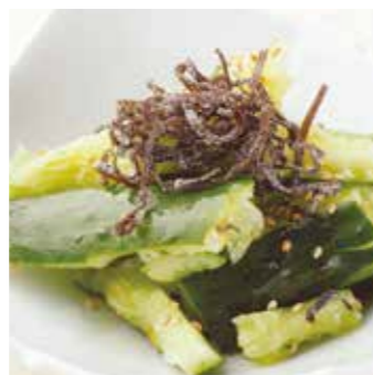
塩昆布たたききゅうり