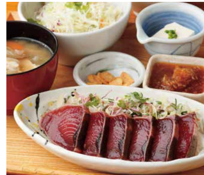
鹿児島 枕崎直送かつおたたき定食 ¥1,680