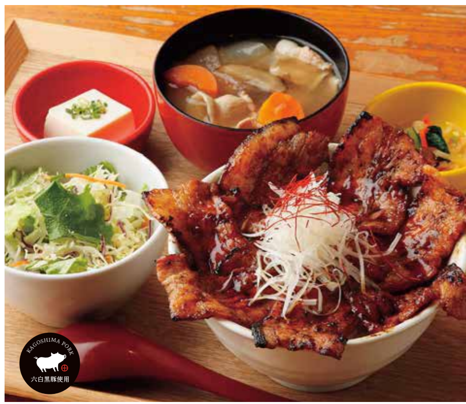
六白黒豚の炙りカルビ井 ¥1,580