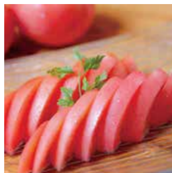
完熟冷やしトマト