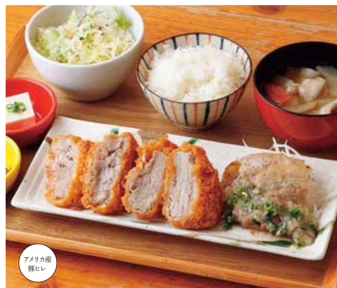
ヒレカツ&ネギ塩カルビ定食 ¥1,680