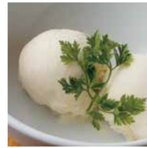
本日のアイス 内容はスタッフまでお尋ね下さい。 ¥330