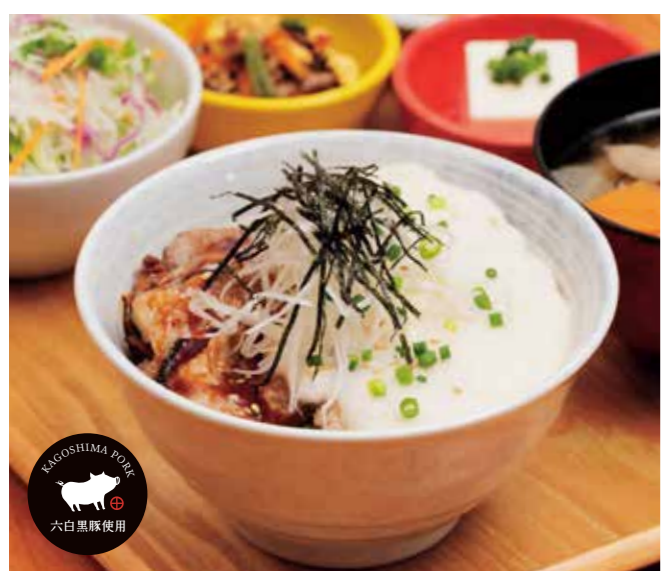
とろろわさびぶた井 ¥1,380

人気の黒ぶた井にとろろを乗せて。 特定原材料: 小麦 / さば / 豚肉 / 大豆 / ごま / 山芋