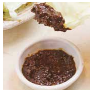
ぶたみそキャベツ