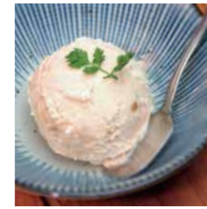
さくらじま黒糖アイス 本場鹿児島黒糖を使った絶品! ¥480