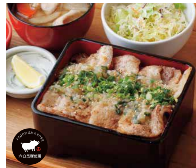
黒ぶたネギ塩カルビ重 ¥1,500