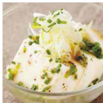
さっぱりネギ塩やっこ