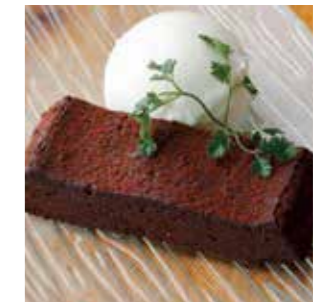
ガトーショコラ しっとり仕上げました。 ¥540