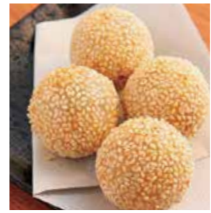
胡麻だんご 熱々のおいしさ! ¥580