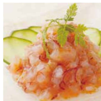
コラーゲン梅なんこつ