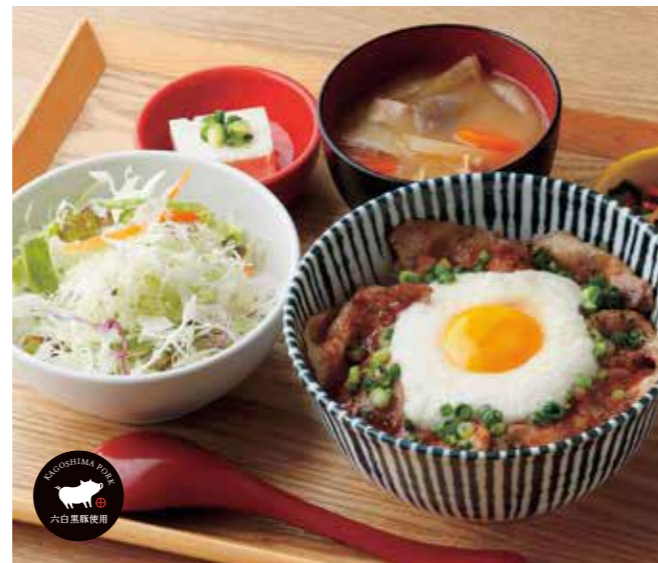
黒ぶたとろろ月見丼 ¥1,380

特定原材料: 豚肉 / ゴマ / 卵 / りんご / 小麦 / 大豆 / 乳 / ゼラチン