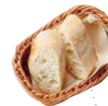
一緒にどうぞ BAGUETTE バゲット 200