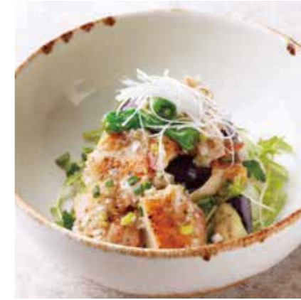
GREEN ONION SALT SAUCE CHICKEN