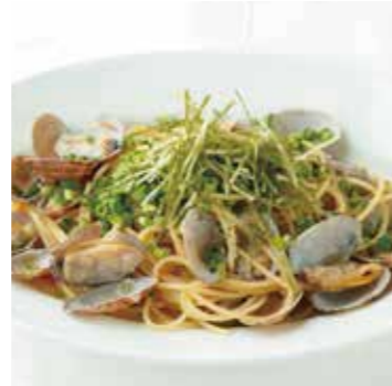
BUTTERED CLAM W/SOYSAUCE あさりバター醤油 1100