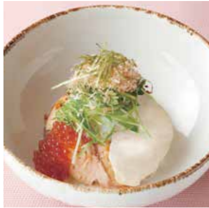
SALMON, SALMON ROE HALF BOILED EGG & POUNDED YAM