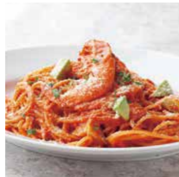
SOFT SHELL SHRIMP & AVOCADO TOMATO CREAM ソフトシェルシュリンプとアボカドのトマトクリーム 1250