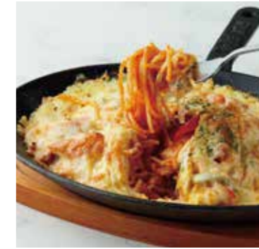
SPA-PIZZA スパピザ 1250