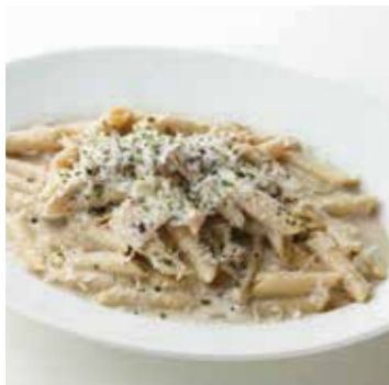
CREAMY CHICKEN & PORCINI PENNE チキンのポルチーニクリームペンネ 1100