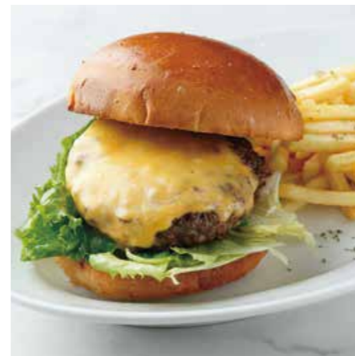
BEEF CHEESE BURGER W/FRENCH FRIES ビーフチーズバーガー (ポテト付き) 1000