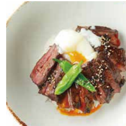
SAUTEED BEEF OUTSIDE SKIRT