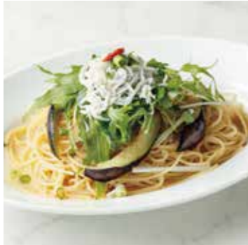
JACO & FRIED EGGPLANT じゃこと揚げ茄子 1000