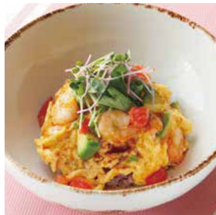
SHRIMP & AVOCADO OMELET