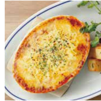
LASAGNA ラザニア 1100