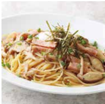
BACON & MUSHROOM, SOY SAUCE ベーコンときのこの和風 1100