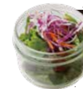
一緒にどうぞ MINI SALAD ミニサラダ 250