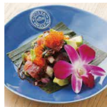
TUNA & AVOCADO POKE マグロとアボカドのポキ