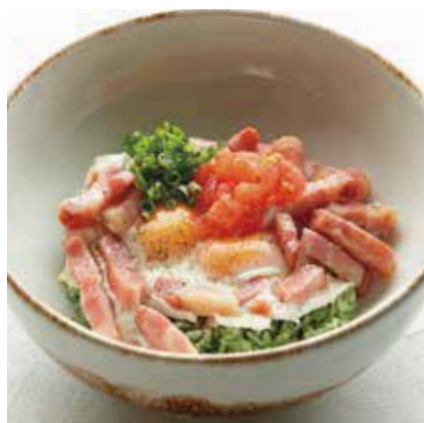
BACON EGG RICE