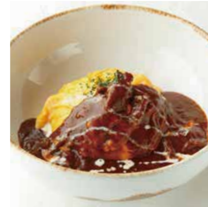
OMELET W/BEEF CURRY