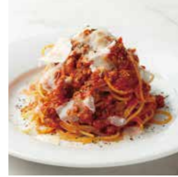
BOLOGNESE ボロネーズ 1100