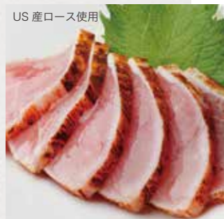
炙り生ハムの刺身 鹿児島醤油で