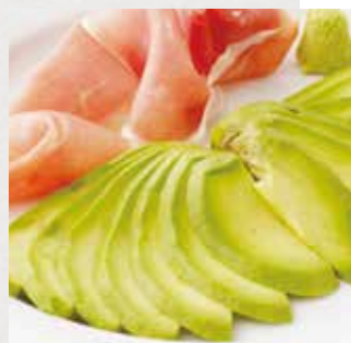
アボカドの刺身 生ハム添え