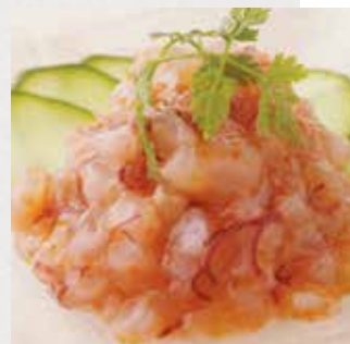
コラーゲン梅なんこつ