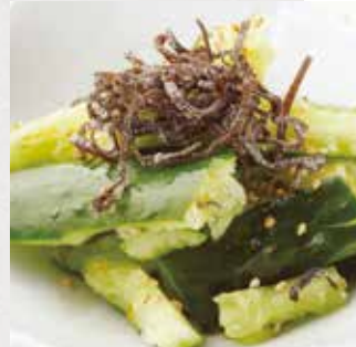
塩昆布 たたききゅうり