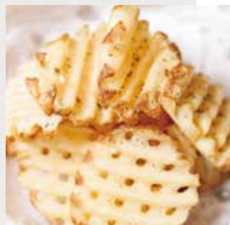
ガーリックフライドポテト