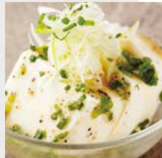
さっぱりネギ塩やっこ