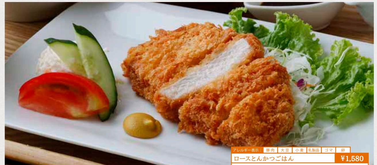
アレルギー表示: 豚肉 大豆 小麦 乳製品 ゴマ 卵 ロースとんかつごはん ¥1,580 柔らかお肉とサクサク衣。