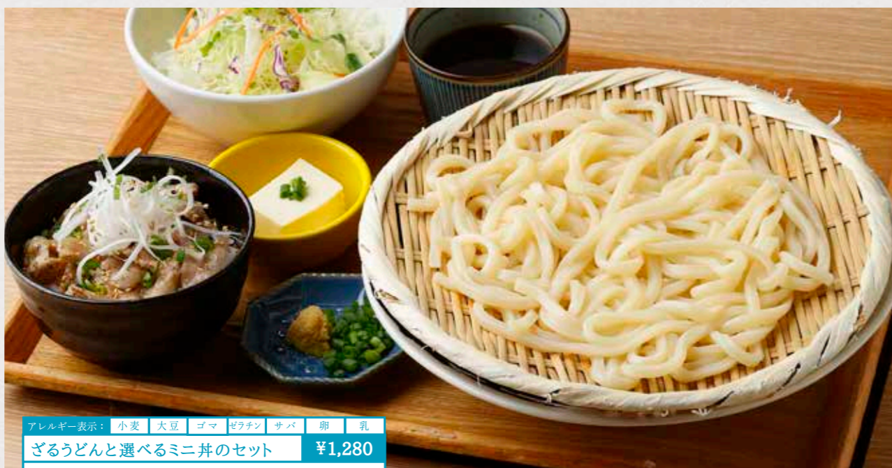
アレルギー表示: 小麦 大豆 ゴマ ゼラチン サバ 卵 乳 ざるうどんと選べるミニ丼のセット ¥1,280 ざるうどんとセットのミニ丼を6種類からお選びください