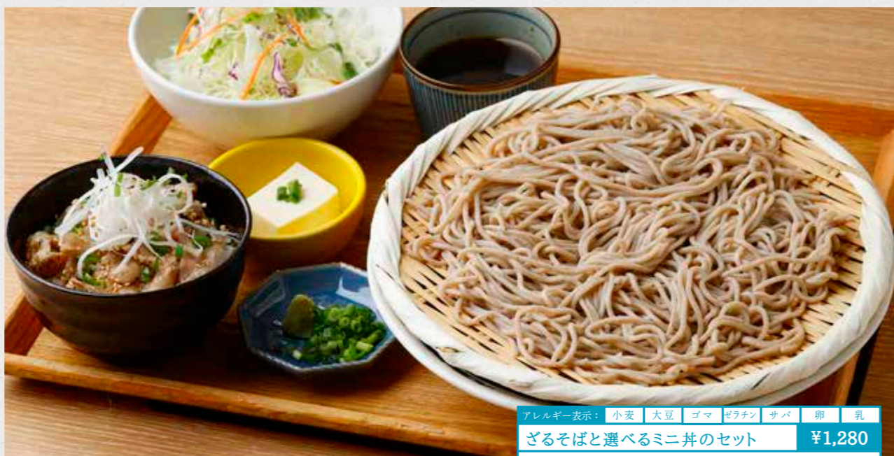
アレルギー表示: 小麦 大豆 ゴマ ゼラチン サバ 卵 乳 ざるそばと選べるミニ丼のセット ¥1,280 ざるそばとセットのミニ丼を6種類からお選びください