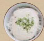
ミニとろろごはん