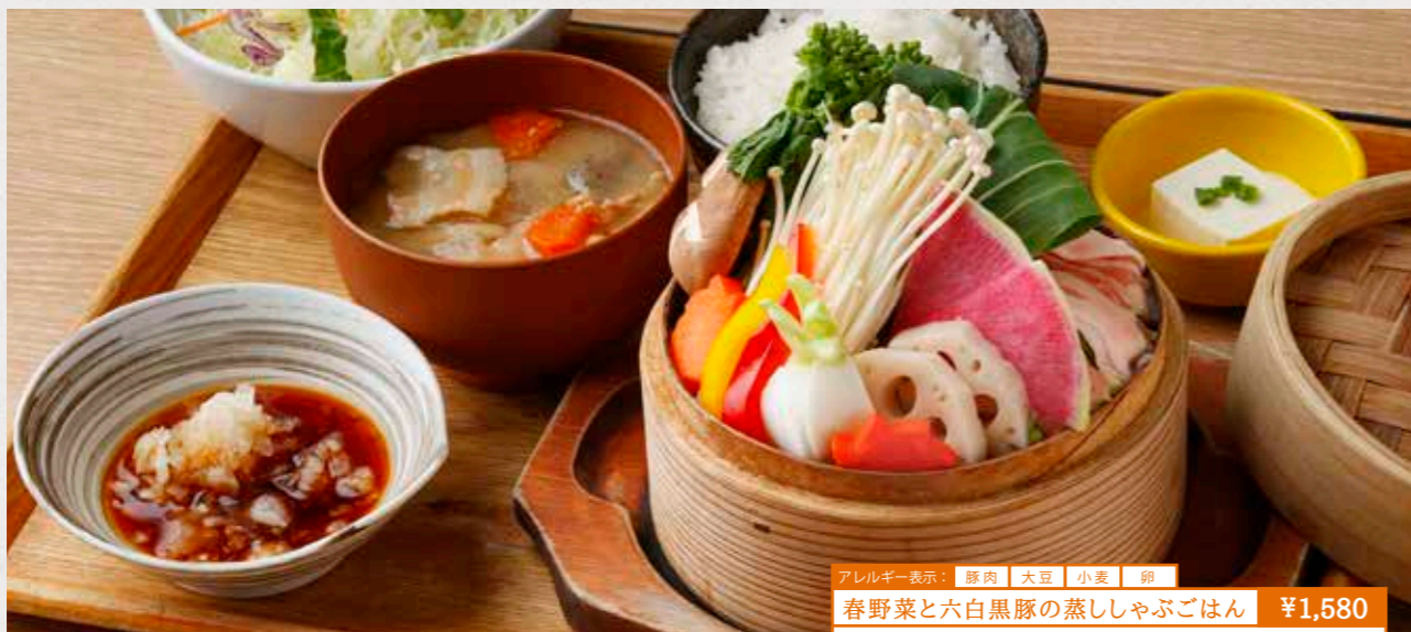
アレルギー表示: 豚肉 大豆 小麦 卵 春野菜と六白黒豚の蒸ししゃぶごはん ¥1,580 春野菜と六白黒豚バラをせいろで蒸してお持ちします。