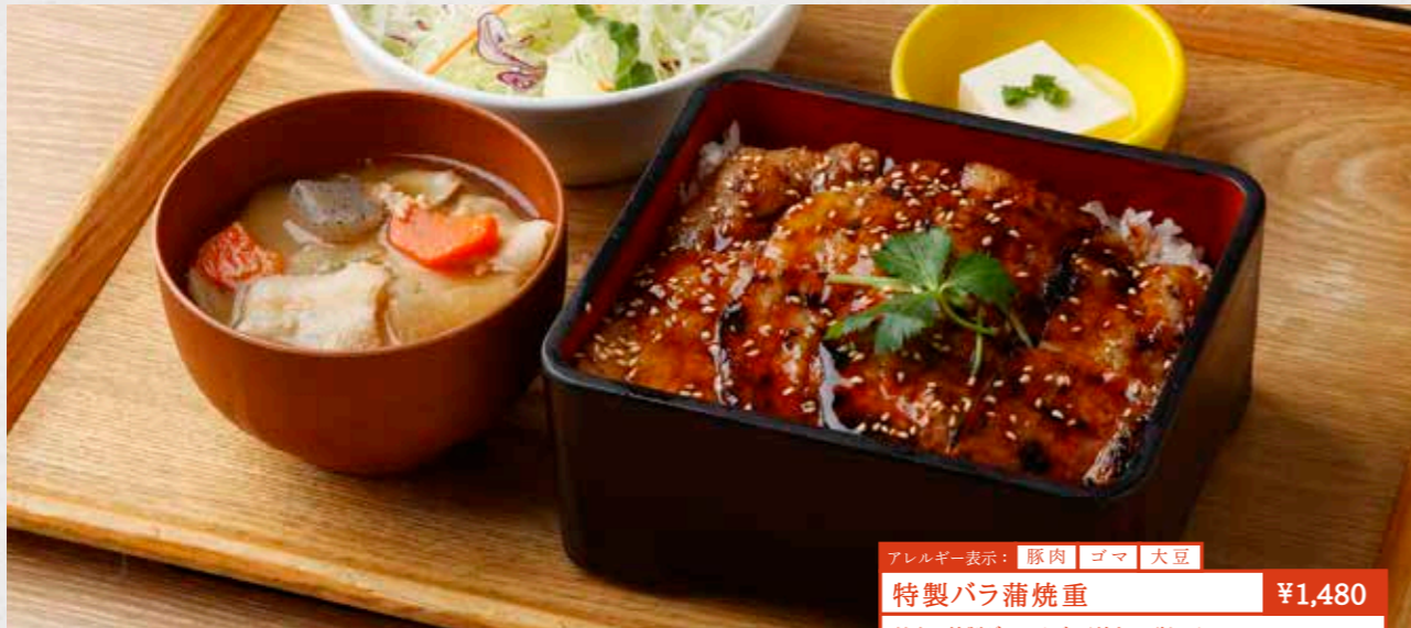
アレルギー表示: 豚肉 ゴマ 大豆 特製バラ蒲焼重 ¥1,480 甘辛い特製ダレで香ばしく焼き上げました。