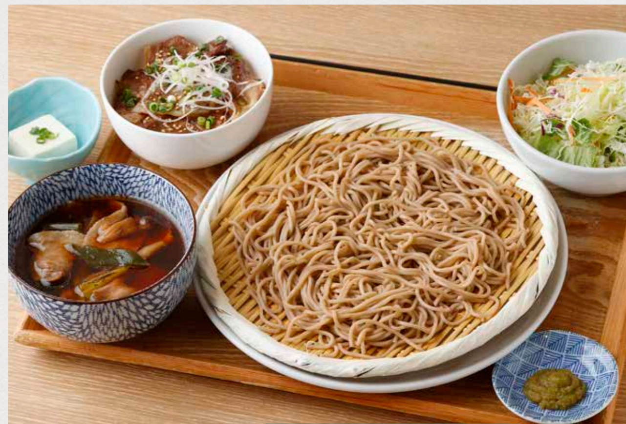
アレルギー表示: 小麦 豚肉 ゴマ ゼラチン サバ 卵 乳 柚子香る豚バラときのこのあったかつけそばと選べるミニ丼のセット ¥1,380 黒豚の旨みが出た熱々のつけ汁で。お好みでゆず胡椒を入れてどうぞ。