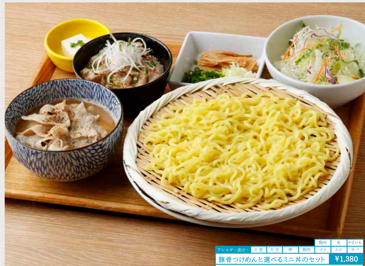
アレルギー表示: 小麦 大豆 卵 豚肉 ゴマ エビ サバ 鶏肉 乳 やまいも 豚骨つけめんと選べるミニ丼のセット ¥1,380 特製魚介トコヅつけめんとセットのミニ丼を6種類からお選び下さい