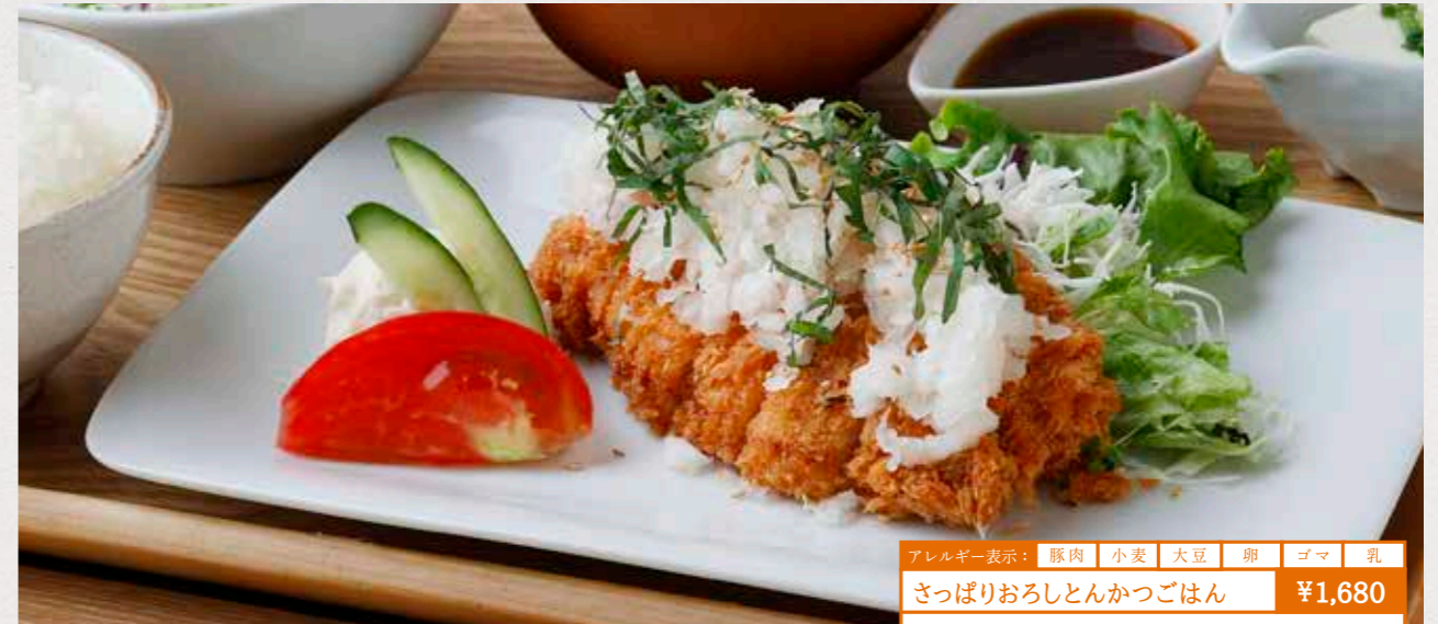
アレルギー表示: 豚肉 小麦 大豆 卵 ゴマ 乳 さっぱりおろしとんかつごはん ¥1,680 食感も楽しめる鬼おろしと刻み大葉にポン酢でさっぱりと