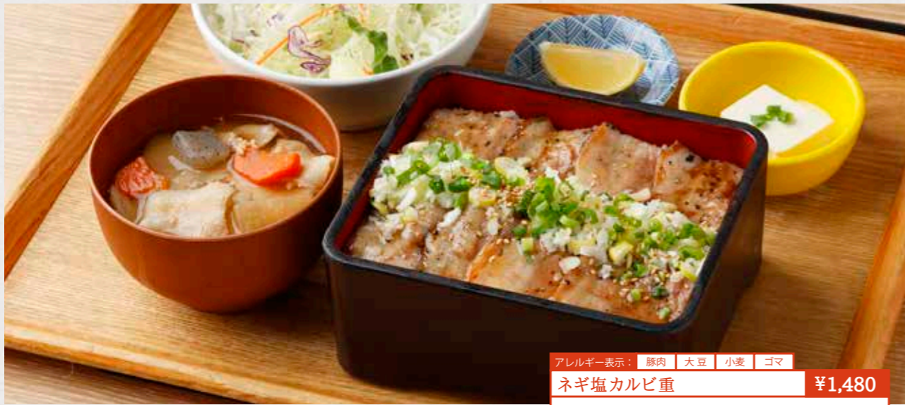
アレルギー表示: 豚肉 大豆 小麦 ゴマ ネギ塩カルビ重 ¥1,480 厚切りカルビにレモン絞ってさっぱり塩だれで。