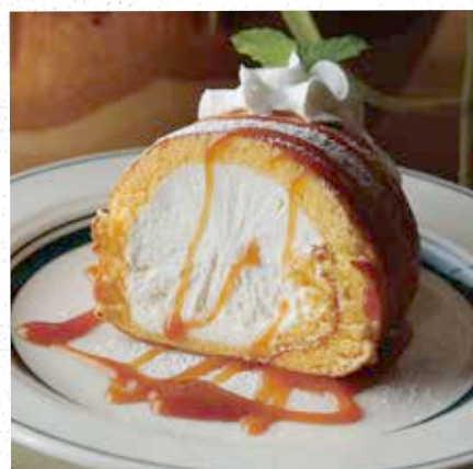
ROLL CAKE ロールケーキ 500