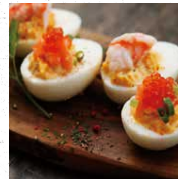
SALMON & SHRIMP DEVILED EGGS サーモンとシュリンプのデビルドエッグ 600