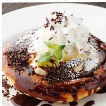
CHOCOLATE & BANANA PANCAKE チョコバナナパンケーキ 900