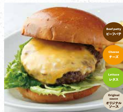
BEEF CHEESE BURGER ビーフチーズバーガー 880

All burgers comes with FRENCH FRIES. すべてのバーガーにポテトが付きます