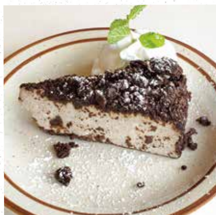
COOKIE & CREAM CHEESE CAKE クッキー & クリームチーズケーキ 550