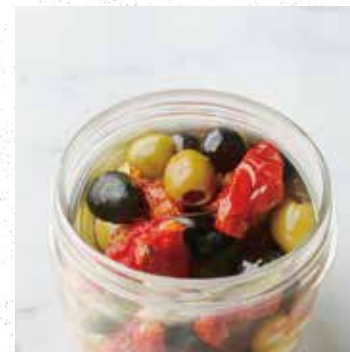
OLIVE & DRIED TOMATO オリーブとセミドライトマトのマリネ 400