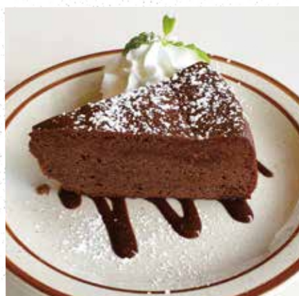
CHOCOLATE CAKE ガトーショコラ 550