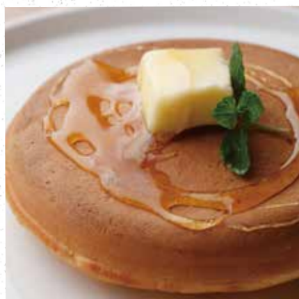
BUTTER & MAPLE PANCAKE バター&メープルパンケーキ 730