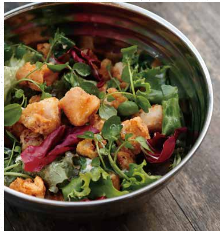
CALAMARI SALAD カラマリサラダ 980