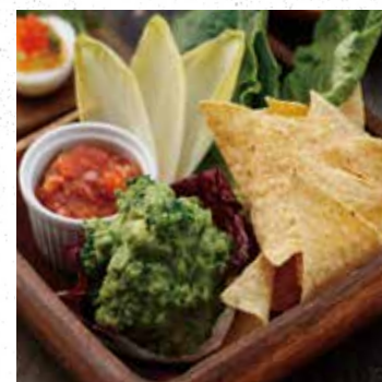
VEGE & AVOCADO DIP ベジ&アボカドディップ 750