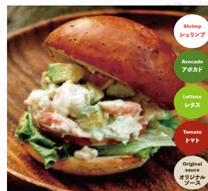
SHRIMP & AVOCADO シュリンプアボカドバーガー 880