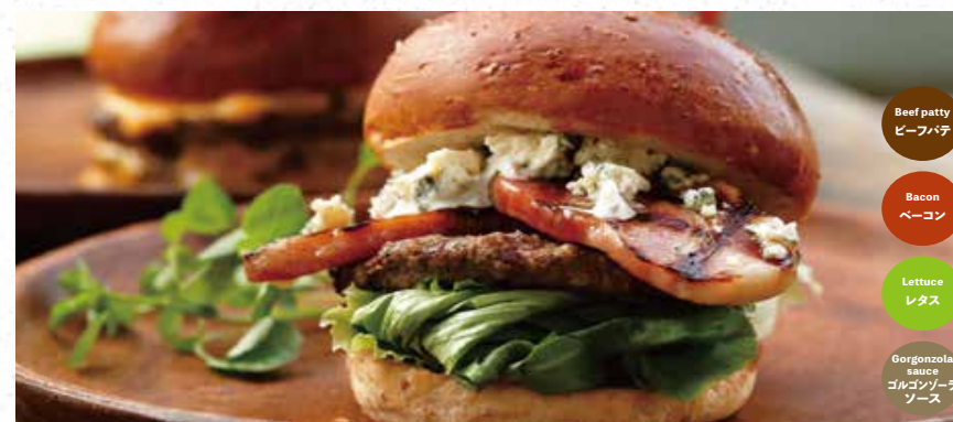
SMOKEY BACON & GORGONZOLA スモークベーコン & ゴルゴンゾーラバーガー 1180