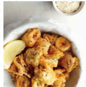
CALAMARI FRITTER カラマリフリット 700