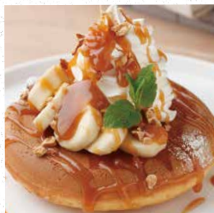
BANANA & CARAMEL NUTS PANCAKE バナナキャラメルナッツパンケーキ 900