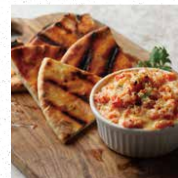
CRAB DIP クラブディップ 800