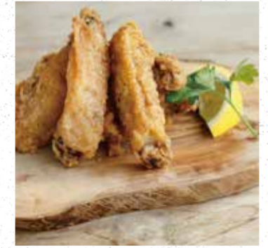
CHICKEN RIBS FRITTER チキンリブフリット 750