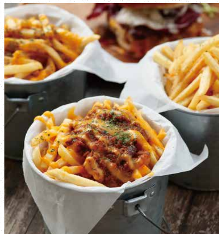
FRENCH FRIES フレンチフライ 450