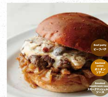
SMOKEY MUSHROOM スモークマッシュルームバーガー 1180