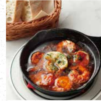
SHRIMP AJILLO W/BAGUETTE 2P 海老のアヒージョ (バゲット 2P 付き) 800