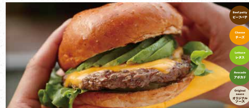
AVOCADO & CHEESE アボカドチーズバーガー 980