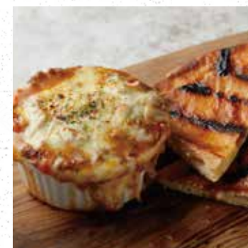
BEEF ENCHILADA DIP ビーフエンチラーダディップ 750