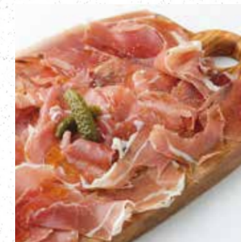
PROSCIUTTO 生ハムプレート 1200