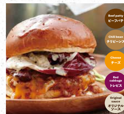
MEXICAN BEEF メキシカンビーフバーガー 980