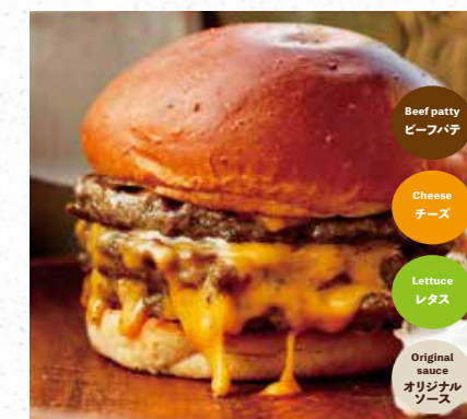
TRIPLE BEEF & CHEESE トリプルビーフチーズバーガー 1880