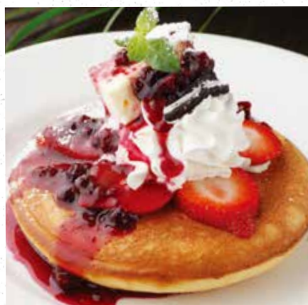
STRAWBERRY CHEESECAKE PANCAKE ストロベリーチーズケーキのパンケーキ 950