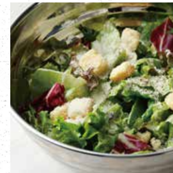
CAESAR SALAD シーザーサラダ 880