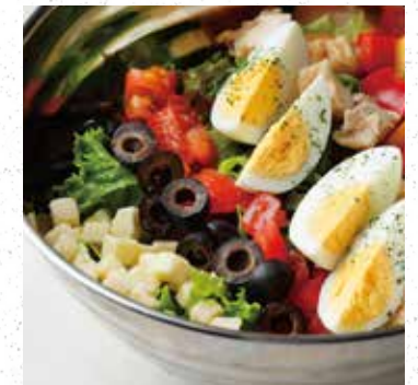
COBB SALAD ディキシーコブサラダ 980