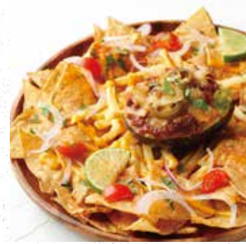
AVOCADO NACHOS アボカドナチョス 1100