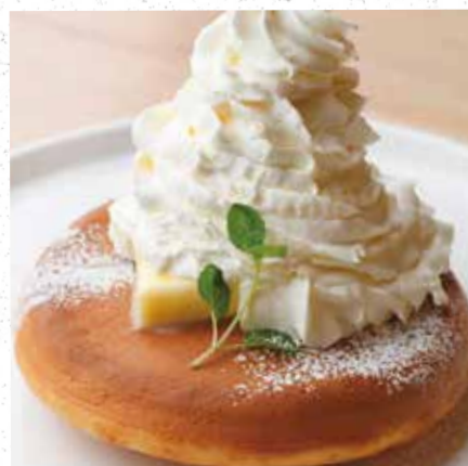
BUTTER & WHIPPED CREAM PANCAKE バター&ホイップパンケーキ 800