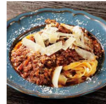
BEEF CHEEK RAGOUT PASTA 牛ホホ肉のラグーパスタ ¥1650