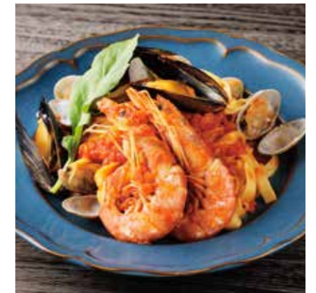
PESCATORA ペスカトーレ ¥1750