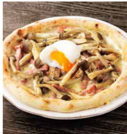
BACON & 4 MUSHROOMS, HALF BOILED EGG PIZZA たっぷりベーコンと 4種キノコのピザ ¥1750