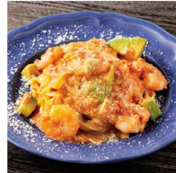
SHRIMP & AVOCADO TOMATO CREAM PASTA 小海老とアボカドの トマトクリームパスタ ¥1600

食物アレルギーのある方はスタッフにお声がけ下さい PLEASE TELL US IF YOU HAVE FOOD ALLERGY.