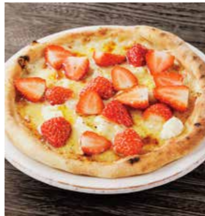
STRAWBERRY, HONEY & RICOTTA CHEESE PIZZA 苺とハチミツ、 リコッタチーズのピザ ¥1850