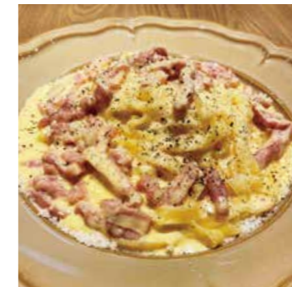
CARBONARA ベーコンたっぷり 濃厚カルボナーラ ¥1400