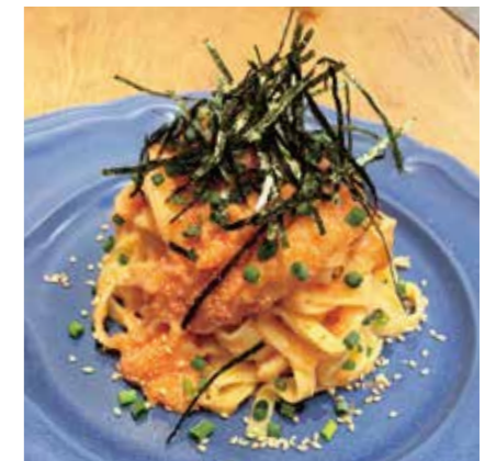
GRAIZED DAIKON & MENTAIKO & PASTA 和風明太おろしパスタ ¥1200