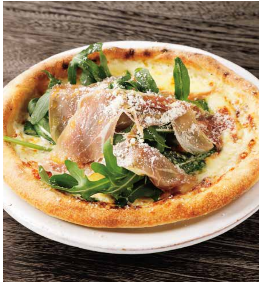
PROSCIUTTO & ARGULA PIZZA 生ハムとルッコラのピザ ¥1700