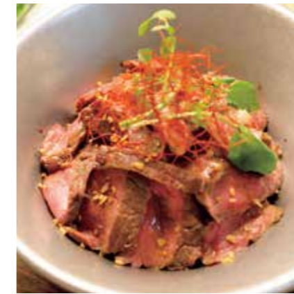
BEEF SIRLOIN CUT STEAK RICE BOWL 自家製甘辛だれの牛サーロインステーキ丼 ¥1950 (税込 ¥2145)