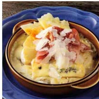
PROSCIUTTO & QUATRO CHEESE DORIA 生ハムと4種チーズのドリア ¥1480 (税込 ¥1628)