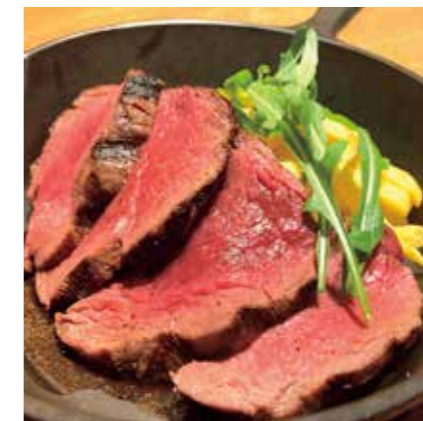
BEEF TENDERLOIN STEAK 牛フィレステーキ / 180g ¥2400 (税込 ¥2640)