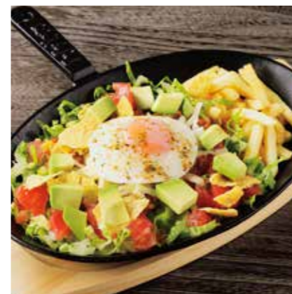
TACO RICE タコライス ¥1100 (税込 ¥1210)