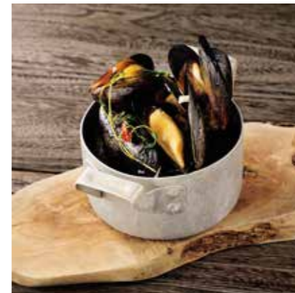
STEAMED MUSSELS ムール貝の白ワイン蒸し ¥980 (税込 ¥1078)