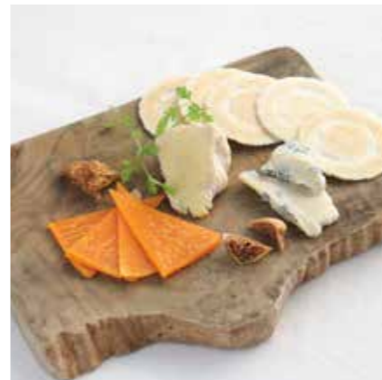
ASSORTED CHEESE PLATE チーズ盛り合わせ ¥780 (税込 ¥858)