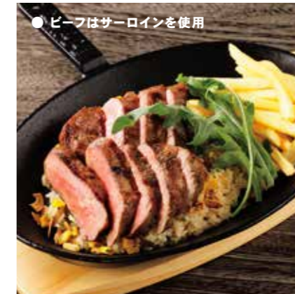
DOUBLE BEEF SIRLOIN COMBO ビーフ & ビーフコンボ ¥1980 (税込 ¥2178)