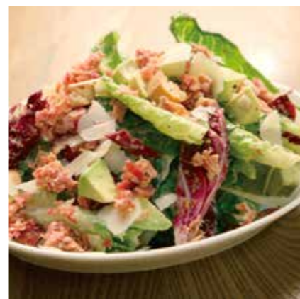
BACON & AVOCADO CLASSIC CAESAR SALAD ベーコンとアボカドの クラシックシーザーサラダ レギュラーサイズ ¥1180 (税込 ¥1298) ハーフサイズ ¥750 (税込 ¥825)