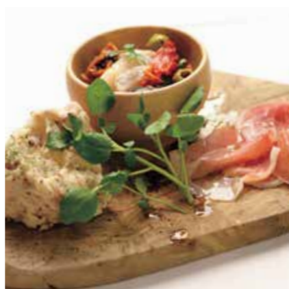
ASSORTED APPETIZERS OF THE DAY 本日の前菜盛合せ ¥880 (税込 ¥968)