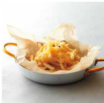
FRENCH FRIES フレンチフライ CAJUN SPICE / PARMESAN / PLAIN / PLAIN & KETCHUP ケイジャンスパイス / パルメザンチーズ プレーン / プレーン&ケチャップ ¥380 (税込 ¥418)