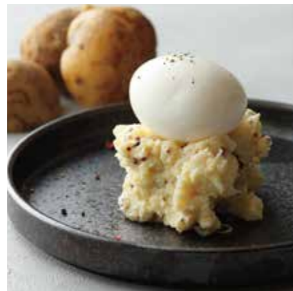
POTATO SALAD W/ HALF BOILED EGG ポテトサラダ 半熟卵のせ ¥580 (税込 ¥638)