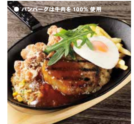
LOCO MOCO & FRIED CHICKEN COMBO ロコモコ & フライドチキンコンボ ¥1750 (税込 ¥1925)