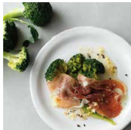
BROCCOLI & PROSCIUTTO ANCHOVY GARLIC SAUCE ブロッコリーと生ハム アンチョビガーリックソース ¥580 (税込 ¥638)