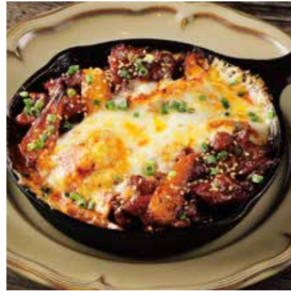
CHEESE DAK GALBI STYLE DORIA チキンとチーズのダッカルビ風ドリア ¥1180 (税込 ¥1298)