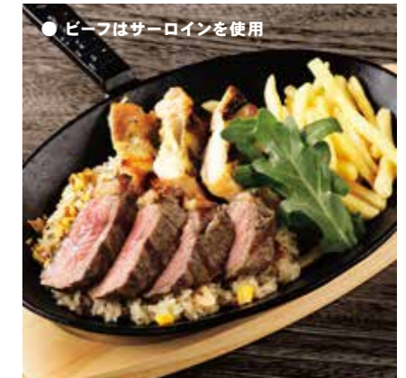
BEEF SIRLOIN & CHICKEN COMBO ビーフ & チキンコンボ ¥1750 (税込 ¥1925)