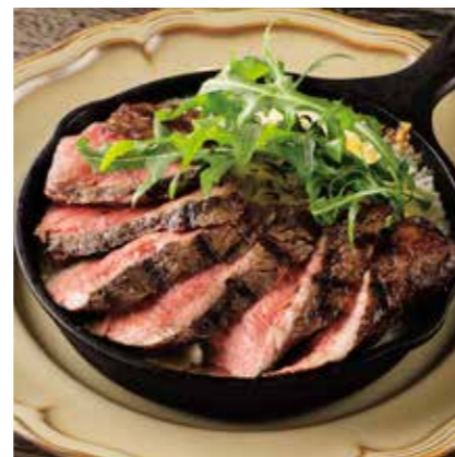
BEEF SIRLOIN STEAK DORIA 牛サーロインステーキドリア ¥1950 (税込 ¥2145)