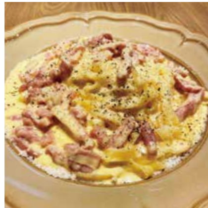
CARBONARA ベーコンたっぷり濃厚カルボナーラ ¥1350 (税込 ¥1485)