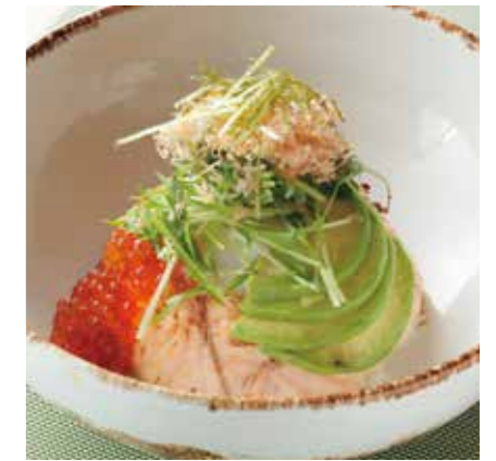
BROILED SALMON & SALMON ROE, W/ HALF BOILED EGG RICE BOWL 炙りサーモンといくらの親子丼温泉卵のせ ¥1400 (税込 ¥1540)