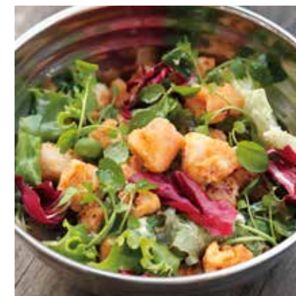
CALAMARI SALAD カラマリサラダ ¥1150 (税込 ¥1265)