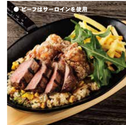
BEEF SIRLOIN & FRIED CHICKEN COMBO ビーフ & フライドチキンコンボ ¥1750 (税込 ¥1925)