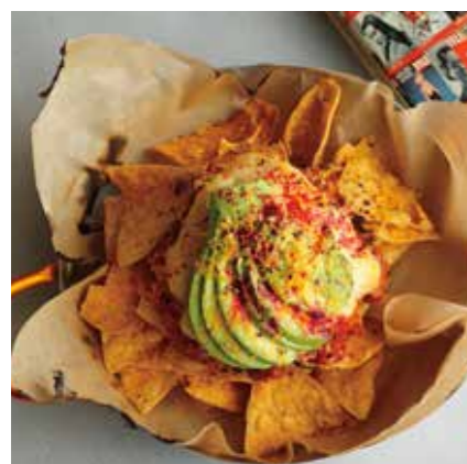
AVOCADO & CHEESE NACHOS アボカドチーズナチョス ¥780 (税込 ¥858)