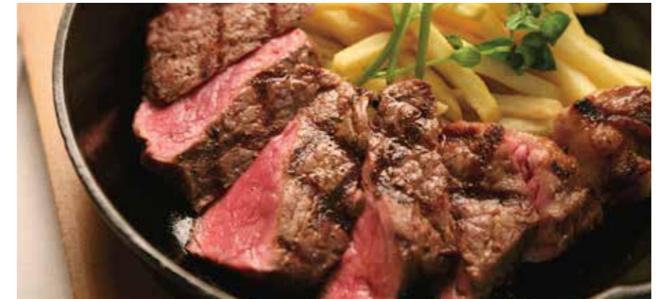
BEEF SIRLOIN STEAK 牛サーロインステーキ シングル/180g ¥1950 (税込 ¥2145) ダブル/360g ¥3280 (税込 ¥3608)

ステーキはミディアムレアに焼き上げます。 ウェルダン（よく火を通して）など、 焼き加減のご要望がございましたら スタッフにお申し付け下さい。