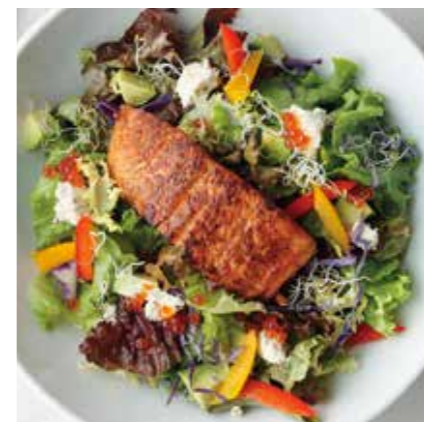
GRILLED SALMON & SALMON ROE SALAD グリルサーモンとイクラのサラダ ¥1380 (税込 ¥1518)