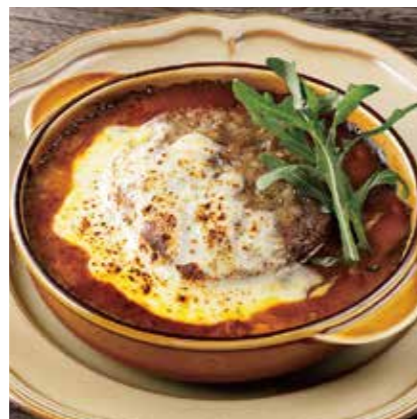
CURRY & HAMBURG DORIA 焼きカレーハンバーグドリア ¥1480 (税込 ¥1628)