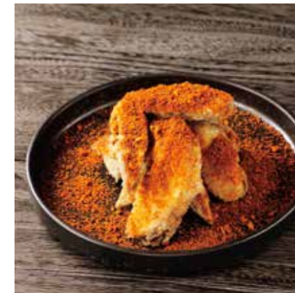
SPICY CHICKEN WING スパイシーチキンウィング ¥980 (税込 ¥1078)