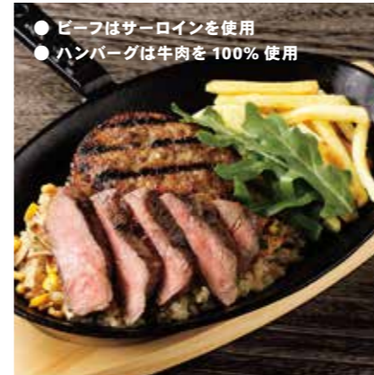
BEEF SIRLOIN & HAMBURG COMBO ビーフ & ハンバーグコンボ ¥1750 (税込 ¥1925)