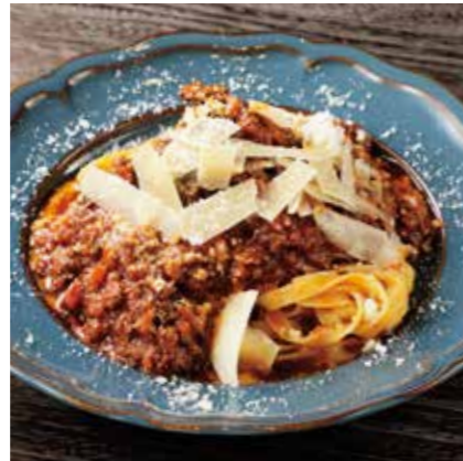
BEEF CHEEK RAGOUT PASTA 牛ホホ肉のラグーパスタ ¥1400 (税込 ¥1540)