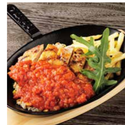
GRILLED CHICKEN W/ TOMATO SAUCE グリルチキン トマトソース ¥1200 (税込 ¥1320)