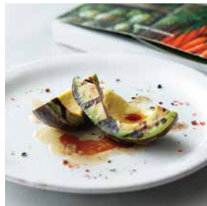
GRILLED AVOCADO W/BROWN BUTTER アボカドのグリル 焦がしバターソース ¥380 (税込 ¥418)