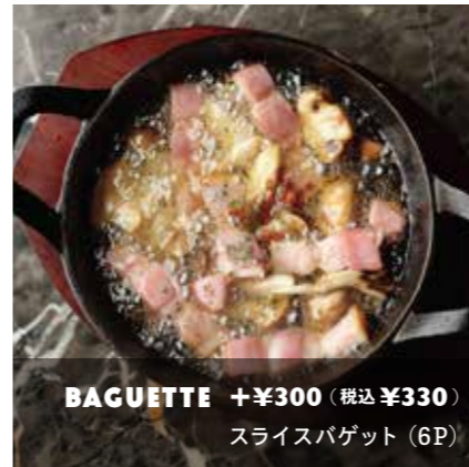
BACON & MUSHROOM AJILLO 4 種キノコとベーコンのアヒージョ ¥780 (税込 ¥858)