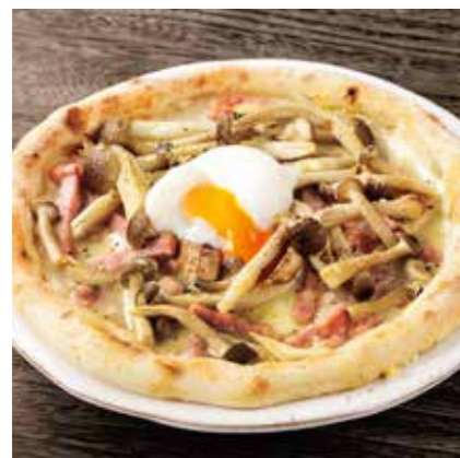
BACON & 4 MUSHROOMS, HALF BOILED EGG PIZZA たっぷりベーコンと 4 種キノコのピザ ¥1600 (税込 ¥1760)