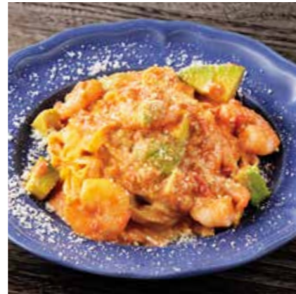
SHRIMP & AVOCADO TOMATO CREAM PASTA 小海老とアボカドの トマトクリームパスタ ¥1180 (税込 ¥1298)