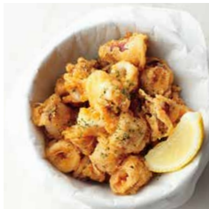
CALAMARI FRITTER 小ヤリイカのスパイシーフリット (カラマリ) ¥680 (税込 ¥748)