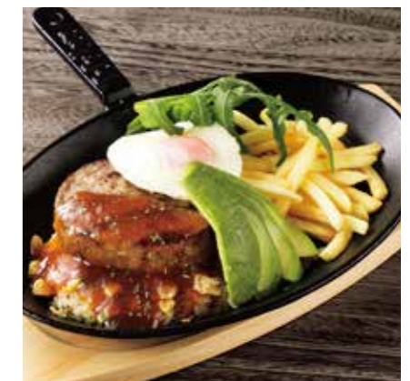
LOCO MOCO W/ GRAVY SAUCE ロコモコ グレービーソース ¥1200 (税込 ¥1320)