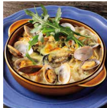
OYSTER & CLAM CHOWDER STYLE DORIA 牡蠣とあさりのクラムチャウダードリア ¥1480 (税込 ¥1628)