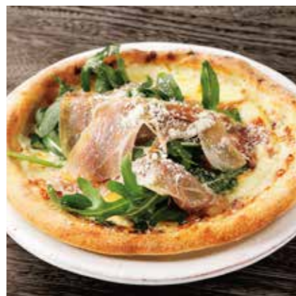
PROSCIUTTO & ARGULA PIZZA 生ハムとルッコラのピザ ¥1500 (税込 ¥1650)