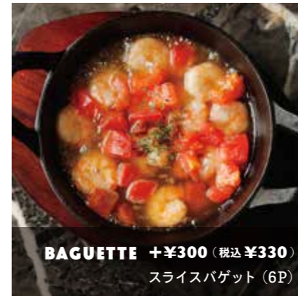
SHRIMP & TOMATO AJILLO 海老とトマトのアヒージョ ¥780 (税込 ¥858)