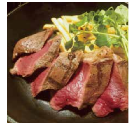
BEEF HEART STEAK 牛ハツのステーキ / 180g ¥2080 (税込 ¥2288)

食物アレルギーのある方はスタッフにお声がけ下さい PLEASE TELL US IF YOU HAVE FOOD ALLERGY.