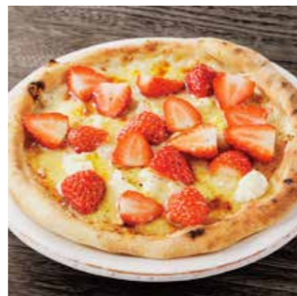
STRAWBERRY, HONEY & RICOTTA CHEESE PIZZA 苺とハチミツ、 リコッタチーズのピザ ¥1680 (税込 ¥1848)