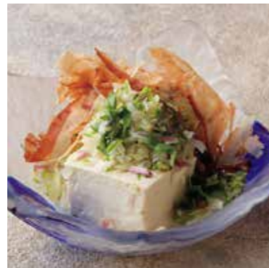
Cold tofu w/condiments 薬味たっぷりやっこ さっぱりヘルシー。