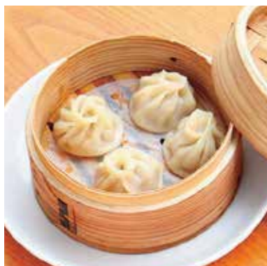
Steamed soup dumplings 小籠包 蒸したてあつあつ。