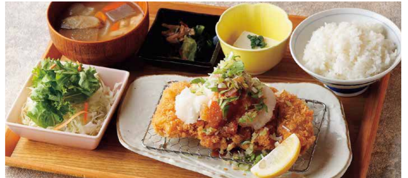
Roppaku Kurobuta pork Cutlet w/grated Daikon radish Set たっぷり薬味のおろしロースとんかつごはん ¥2,180

特定原材料および準ずるもの：卵 / 小麦 / 大豆 / ごま / りんご / 豚肉