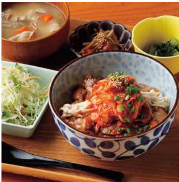
Roppaku Kurobuta pork w/Kimchi & Cheese Rice bowl Set 黒ぶたキムチーズ丼 ¥1,480

たっぷりの薬味と揚げ茄子、大根おろしが相性抜群。 特定原材料および準ずるもの： 小麦 / 大豆 / ごま / 鶏肉 / 豚肉 / セラチン