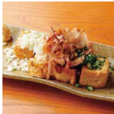
Deep fried tofu w/condiments 自家製厚揚げ 揚げたて! 薬味をたっぷりのせて。