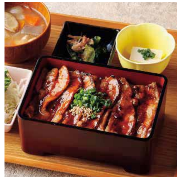
Sautéed Roppaku Kurobuta pork on the Rice Set 黒ぶた蒲焼き重 ¥1,580

定番の黒ぶた丼にとろろを乗せて。 特定原材料および準ずるもの： 小麦 / 大豆 / 山芋 / ごま / さば / りんご / 豚肉