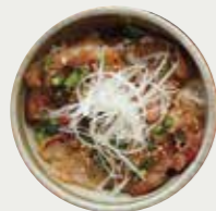
黒ぶた丼 (醤油 / ねぎ塩 / 辛みそ)

特定原材料および準ずるもの: (醤油) 小麦 / 大豆 / ごま / さば / 豚肉 (ねぎ塩) 小麦 / 大豆 / ごま / 鶏肉 / 豚肉 / セラチン (辛みそ) 小麦 / 大豆 / ごま / 豚肉