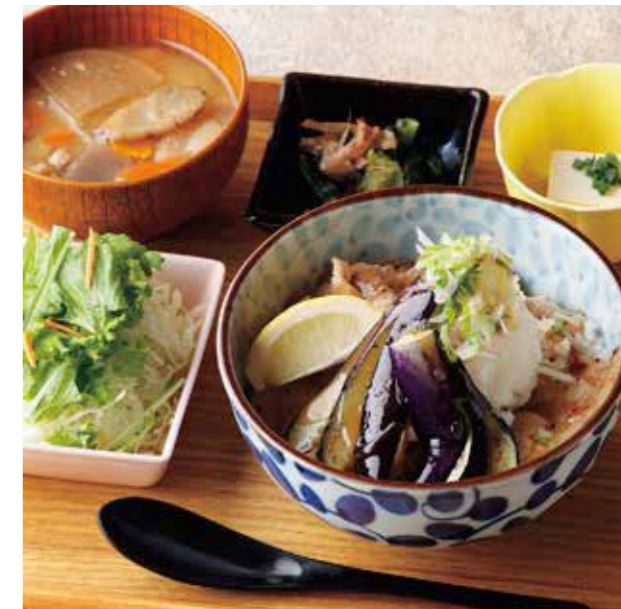
Roppaku Kurobuta pork & Fried Eggplant Rice bowl Set 薬味たっぷり! 揚げ茄子おろしぶた丼 ¥1,480

栄養たっぷり! まろやかな味わい。 特定原材料および準ずるもの： 卵 / 小麦 / 大豆 / 山芋 / ごま / さば / りんご / 豚肉