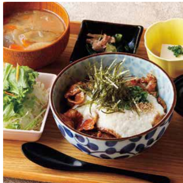
Roppaku Kurobuta pork w/Pounded Yam Rice bowl Set とろろわさびぶた丼 ¥1,380

濃厚なチーズとキムチの相性抜群! 特定原材料および準ずるもの： 乳 / 小麦 / えび / 大豆 / ごま / さば / 豚肉