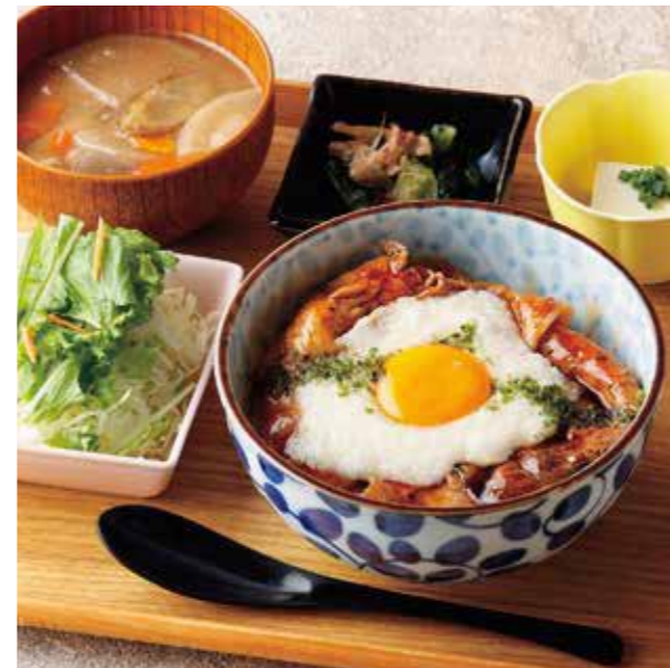
Roppaku Kurobuta pork w/Pounded Yam & Egg Rice bowl Set とろろ月見ぶた丼 ¥1,380

香ばしく焼き上げた黒ぶたをお好みのタレで。 特定原材料および準ずるもの： 卵 / 小麦 / 大豆 / ごま / さば / 鶏肉 / りんご / 豚肉 / セラチン