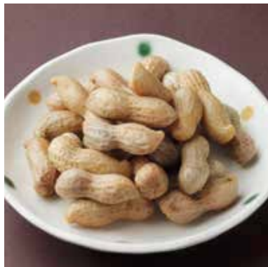
Boiled whole peanuts 塩茹で落花生 鹿児島特産。止まらない美味しさ。