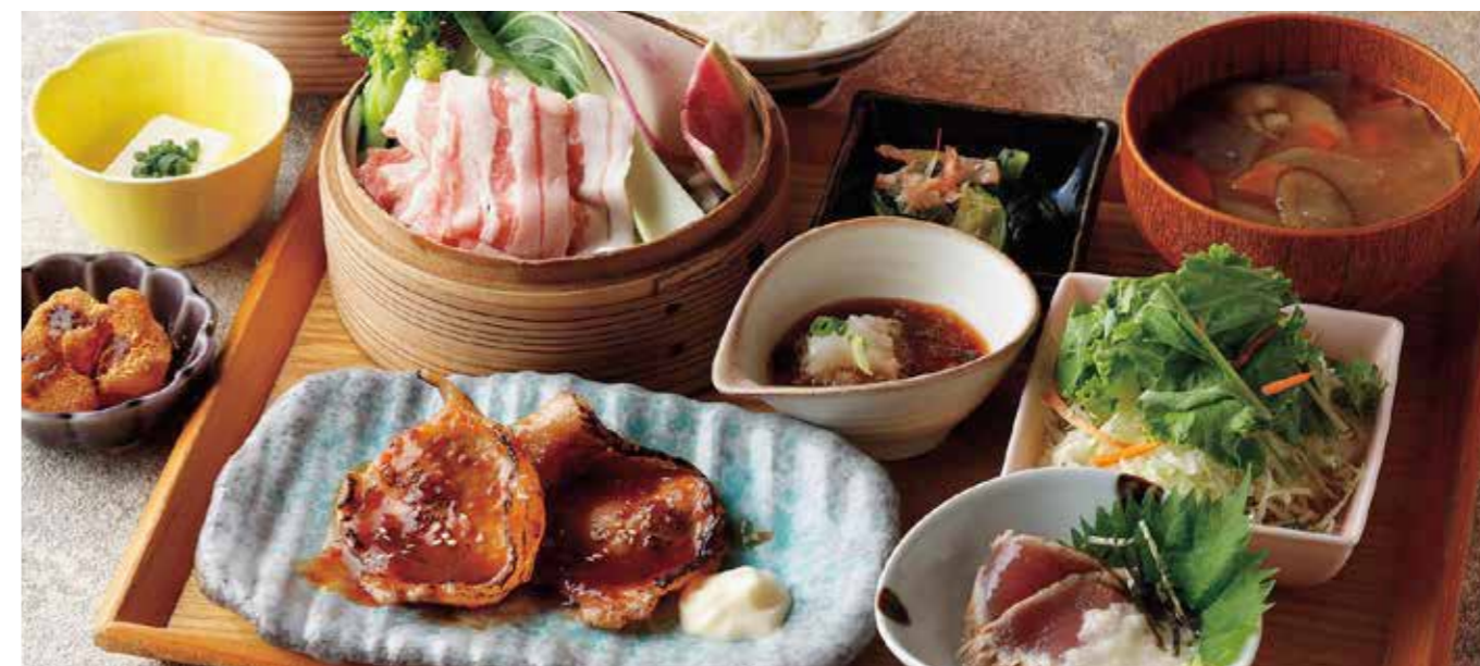
Steamed Kurobuta pork & veggie, Seared Bonito & Choice of Tender srewed Pork or Pork Ginger Set

特定原材料および準ずるもの：卵 / 乳 / 小麦 / 大豆 / ごま / りんご / 豚肉