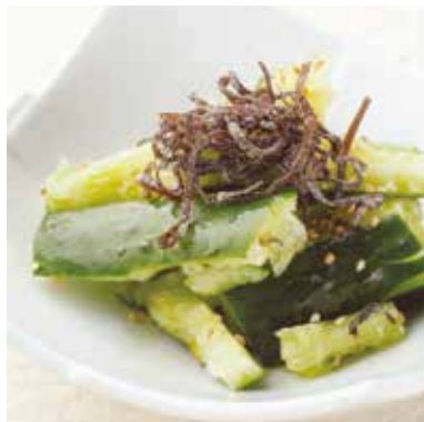
Cucumber w/ salted kelp 塩昆布たたききゅうり あっさり味の人気の一品。