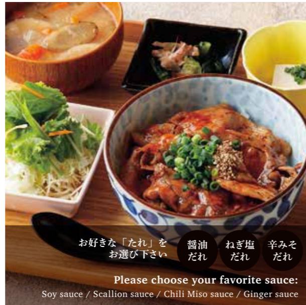
好きな「たれ」をお選び下さい 醤油だれ / ねぎ塩だれ / 辛みそだれ Please choose your favorite sauce: Soy sauce / Scallion sauce / Chili Miso sauce / Ginger sauce Sautéed Roppaku Kurobuta pork Rice bowl Set 網焼き黒ぶた丼 (醤油 / ねぎ塩 / 辛みそ) ¥1,280 (温玉のせ +¥100)

Toppings 追加トッピング 各¥150 Raw egg 生たまご Half boiled egg 温玉 Pounded yam とろろ