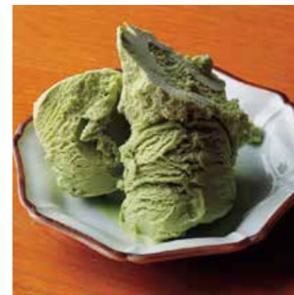
Chiran green tea ice cream