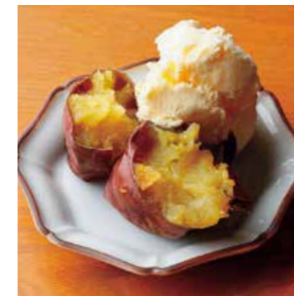
Baked sweet potato & vanilla ice cream