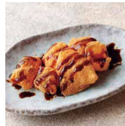
Warabi mochi w/roasted soybean flour