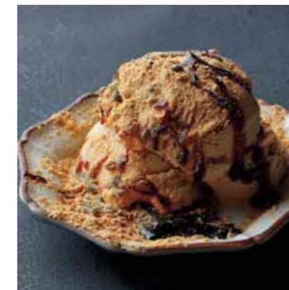
Soybean flour & brown sugar ice cream