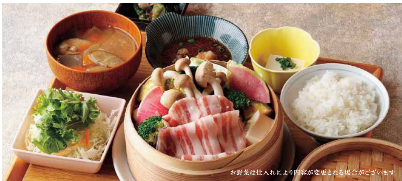
Steamed Roppaku Kurobuta pork & Vegetables Set

特定原材料および準ずるもの：卵 / 小麦 / 大豆 / 山芋 / ごま / さば / りんご / 豚肉