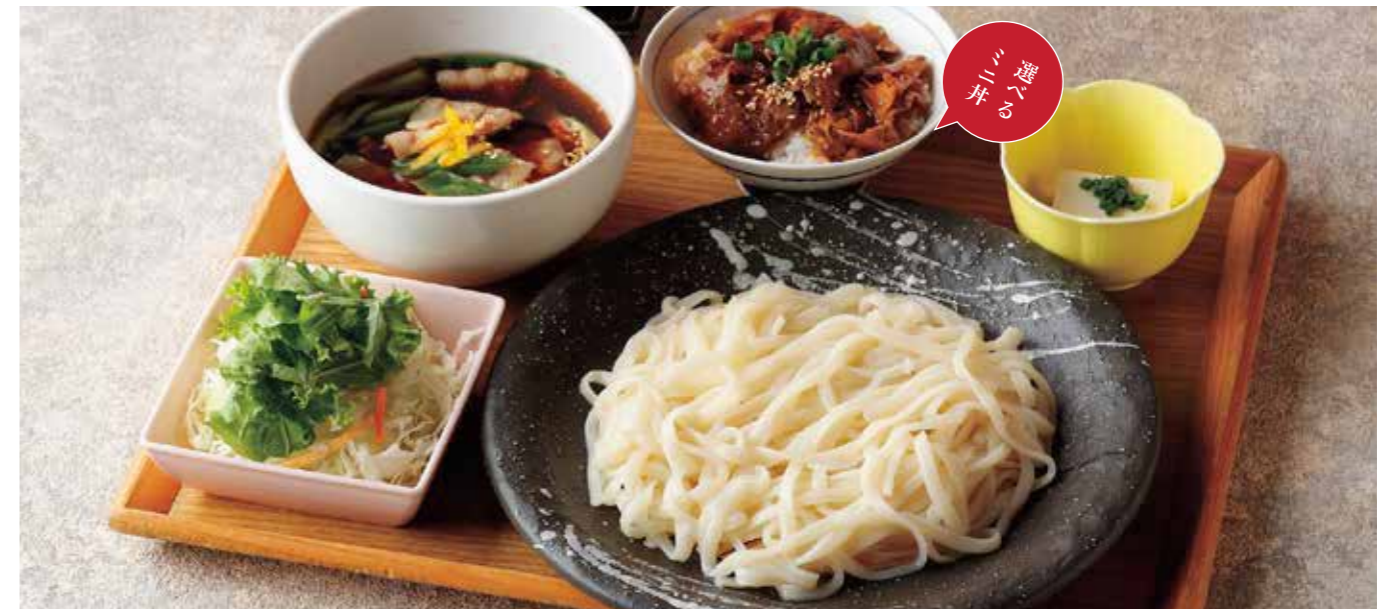
Soba or Udon w/Leek & Pork dip soup, & Choice of small rice bowl Set

特定原材料および準ずるもの：卵 / 小麦 / そば / 大豆 / ごま / 豚肉