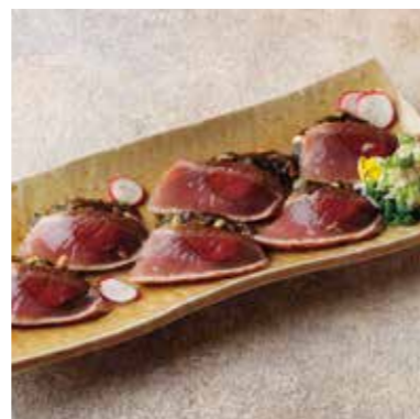
Seared bonito carpaccio 枕崎かつおのカルパッチョ 香ばしい炭火焼きのかつおをカルパッチョ仕立てに。