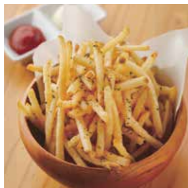
Fried Potatoes フライドポテト みんな大好き定番おつまみ。