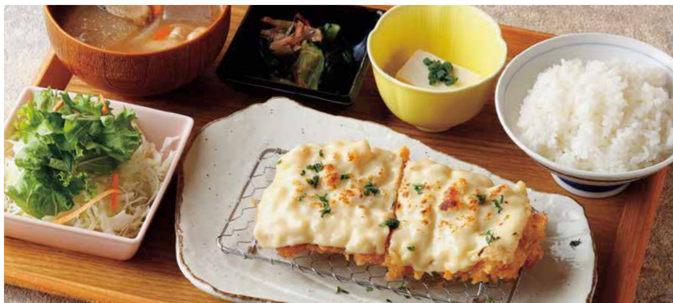
Roppaku Kurobuta pork Cutlet w/cheese sauce Set