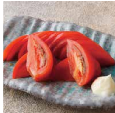
Chilled fresh tomato 冷やしトマト 冷たくひやしてシンプルに。