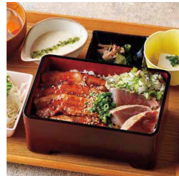
Roppaku Kurobuta pork & Seared Bonito on the Rice Set 黒ぶた蒲焼きと枕崎かつおの合い盛り重 ¥1,780

肉厚な黒ぶたを特製ダレに漬け込み、香ばしく焼き上げました。 特定原材料および準ずるもの： 小麦 / 大豆 / ごま / さば / りんご / 豚肉