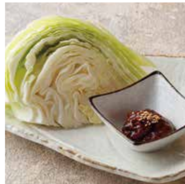
Fresh cabbage w/ pork miso ぶた味噌キャベツ 鹿児島産みそを使用、黒ぶたや特製です。