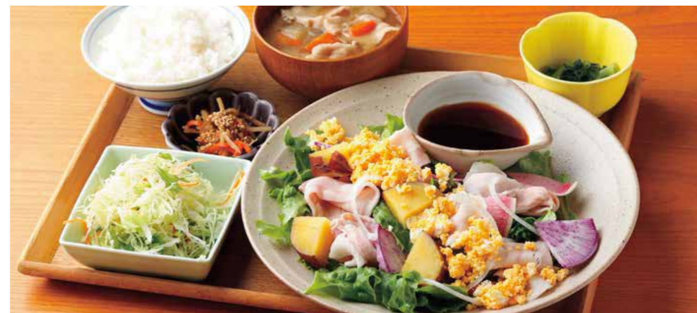
Seasonal Vegetables & Boiled Kurobuta pork plate Set