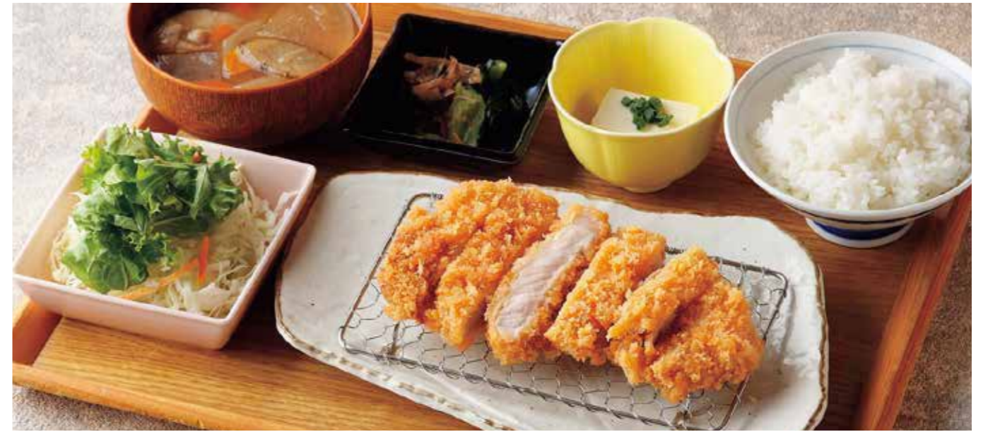
Roppaku Kurobuta pork Cutlet Set 黒ぶたロースとんかつごはん ¥2,080