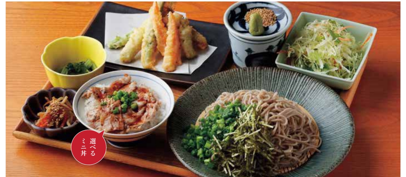
Soba or Udon w/ Seasonal Vegetables Tempura, & Choice of small rice bowl Set