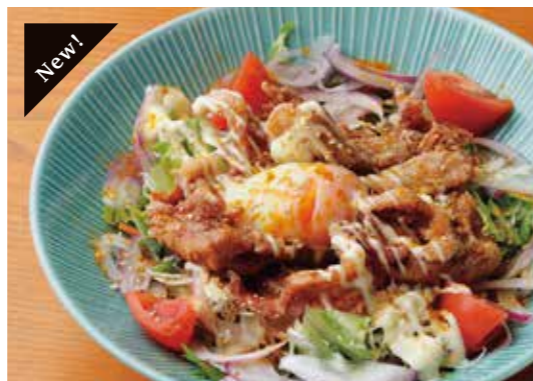
Deep fried pork loin & half boiled egg salad ロースの唐揚げと温玉のサラダ カレー風味の唐揚げをたっぷりの野菜と一緒に。 ¥980