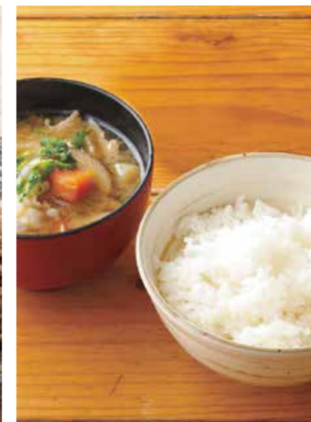
Rice & pork miso soup set