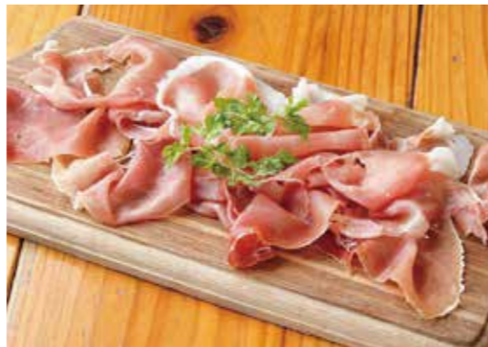
Prosciutto 山盛りプロシュート 生ハム好きにはたまりません。 ¥880