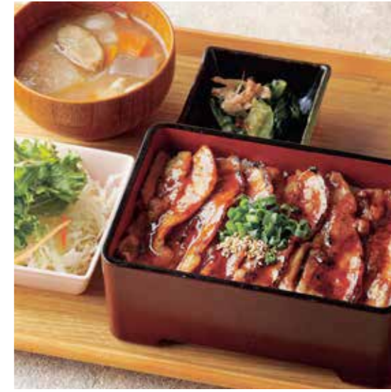
Sautéed Roppaku Kurobuta pork on the Rice Set 黒ぶた蒲焼き重 ¥1,730

特定原材料および準ずるもの： 小麦 / 大豆 / ごま / 鶏肉 / 豚肉 / セラチン