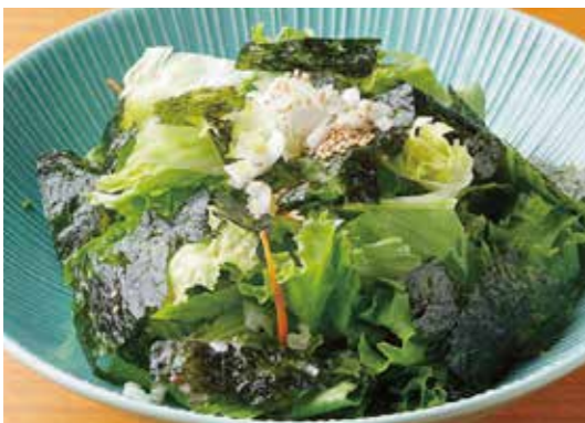
Korean style Green Salad w/Nori Seaweed 韓国海苔のグリーンサラダ 韓国風の醤油ベースドレッシングで。 ¥780