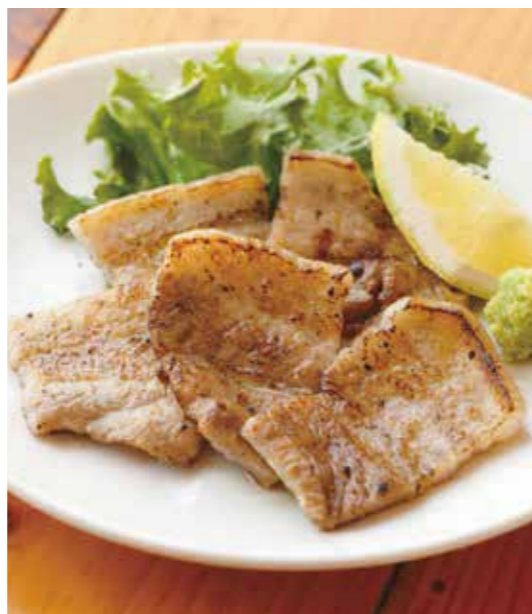
Grilled pork short ribs