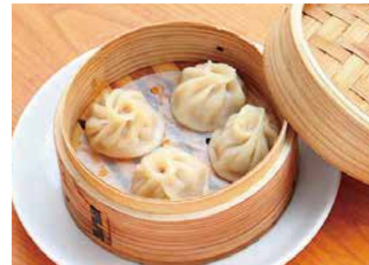
Steamed soup dumplings 小籠包 蒸したてあつあつ。 ¥700