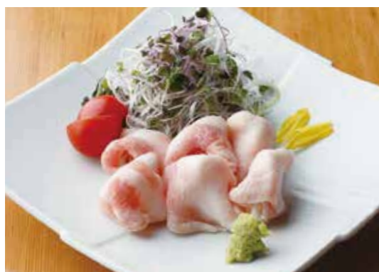
Raw cooked Roppaku kurobuta pork loin 黒ぶたわさ 黒ぶたや自慢の一品。ロース肉をお刺身感覚で。 ¥880