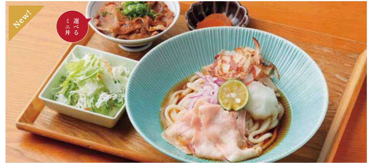
Udon or Soba w/ boiled pork & sudachi lemon & Choice of small rice bowl Set