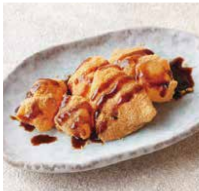
Warabi mochi w/roasted soybean flour きな粉わらび餅 優しい甘さに香ばしいきな粉のほっと落ち着くデザート。 ¥500