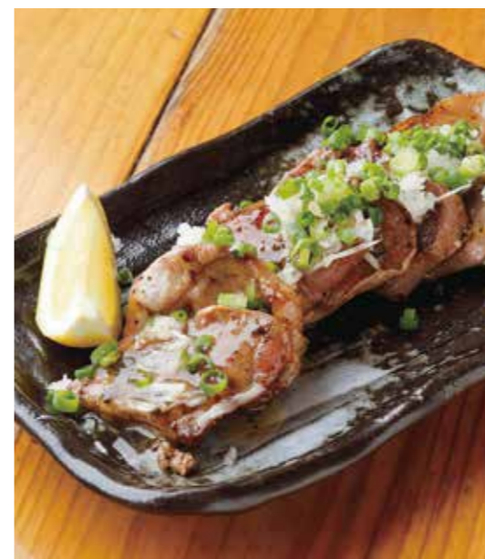
Grilled pork tongue w/scallion salt sauce