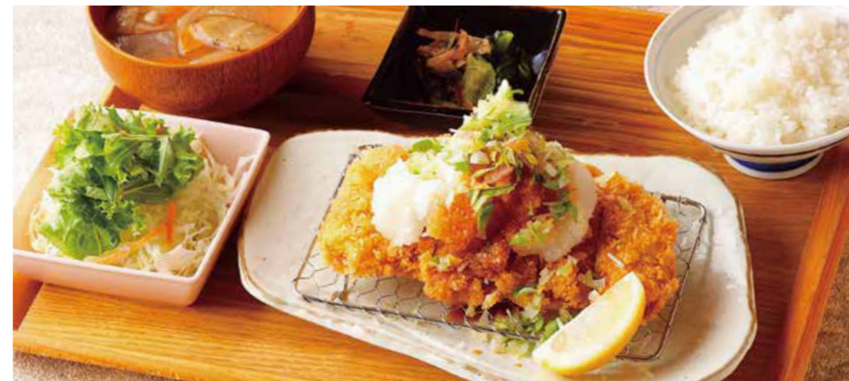
Roppaku Kurobuta pork Cutlet w/grated Daikon radish Set たっぷり薬味のおろしロースとんかつごはん ¥2,330

特定原材料および準ずるもの：卵 / 小麦 / 大豆 / ごま / りんご / 豚肉