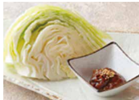
Fresh cabbage w/pork miso ぶた味噌キャベツ 鹿児島麦みそを使用、黒ぶたや特製です。 ¥500