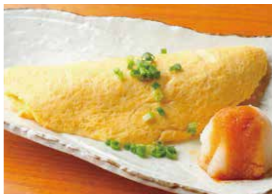
Dashi flavored Omelette w/grated daikon turnip 出汁巻きオムレツ だしの旨みがじんわり優しい一品。 ¥700