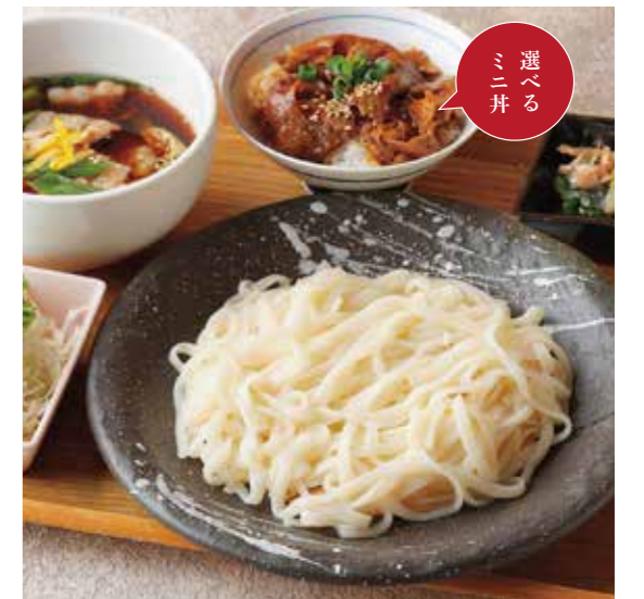
Soba or Uson w/ Leek & Pork dip soup, & Choice of small rice bowl Set

特定原材料および準ずるもの：卵 / 小麦 / そば / 大豆 / ごま / さば