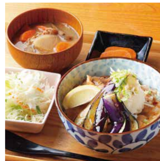
Roppaku Kurobuta pork & Fried Eggplant Rice bowl Set 薬味たっぷり! 揚げ茄子おろしぶた丼 ¥1,580

特定原材料および準ずるもの： 乳 / 小麦 / えび / 大豆 / ごま / さば / 豚肉