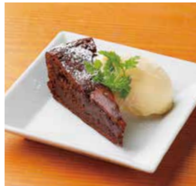
Gateaux au chocolat 自家製ガトーショコラ しっとり濃厚。 ¥700