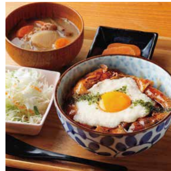
Roppaku Kurobuta pork w/Pounded Yam & Egg Rice bowl Set とろろ月見ぶた丼 ¥1,480

特定原材料および準ずるもの： 卵 / 小麦 / 大豆 / ごま / さば / 鶏肉 / りんご / 豚肉 / セラチン