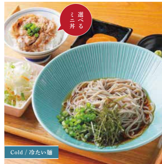
Roppaku Kurobuta pork w/ Kimchi & Cheese Rice bowl Set