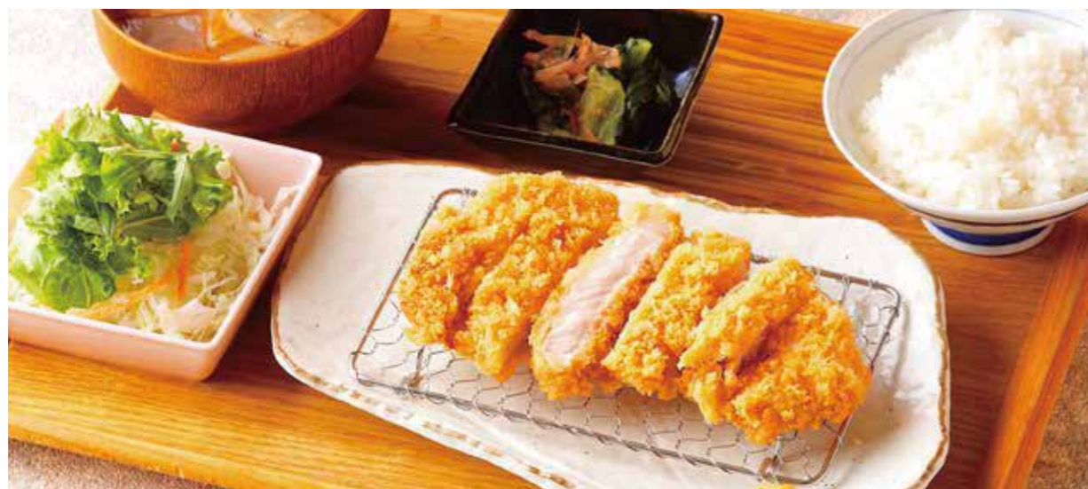
Roppaku Kurobuta pork Cutlet Set 黒ぶたロースとんかつごはん ¥2,230