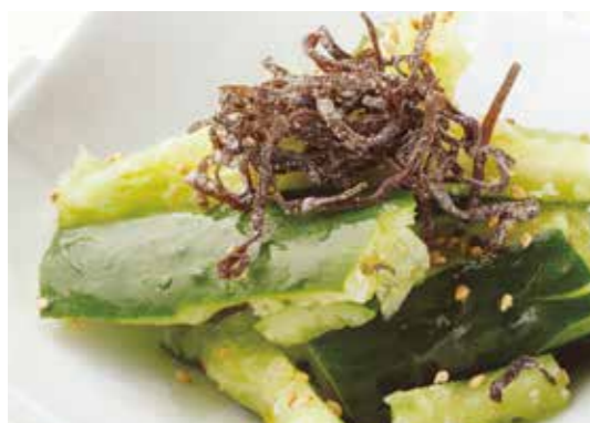
Cucumber w/ salted kelp 塩昆布たたききゅうり あっさり味の人気の一品。 ¥500