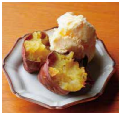
Baked sweet potato & vanilla ice cream 鹿児島産焼き芋とバニラアイス 鹿児島といえばさつまいも。 温かいお芋と冷たいバニラアイスのコンビネーション。 ¥700