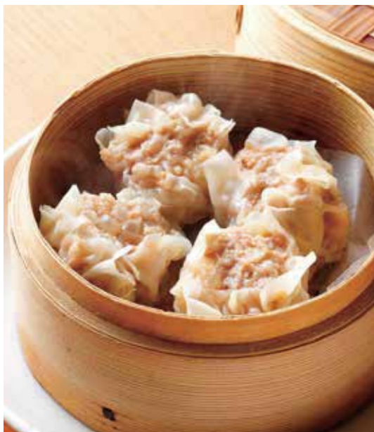
Steamed Roppaku Kurobuta pork shumai dumplings