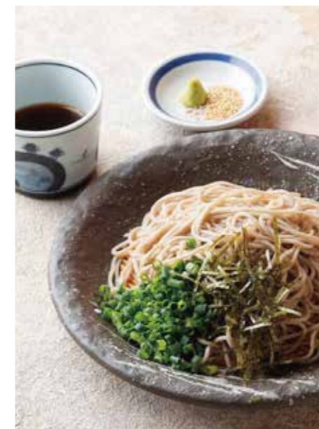
Soba or Udon