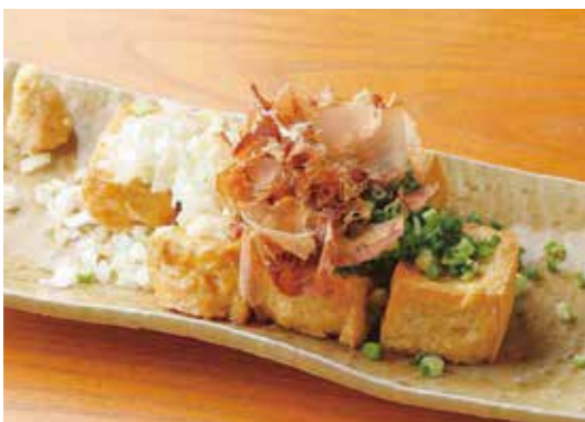
Deep fried tofu w/condiments 自家製厚揚げ 揚げたて! 薬味をたっぷりのせて。 ¥700