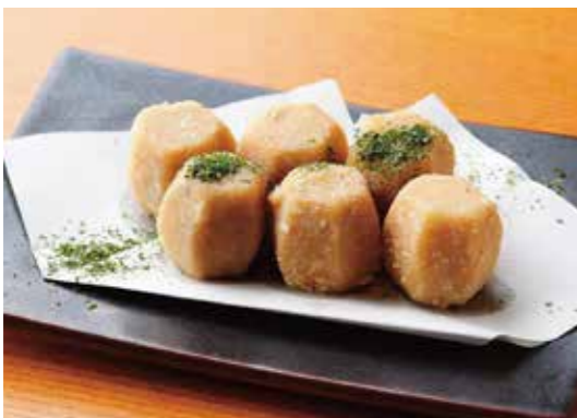
Japanese taro fritter 里芋のから揚げ カリッとホクホク、旬の味覚です。 ¥600