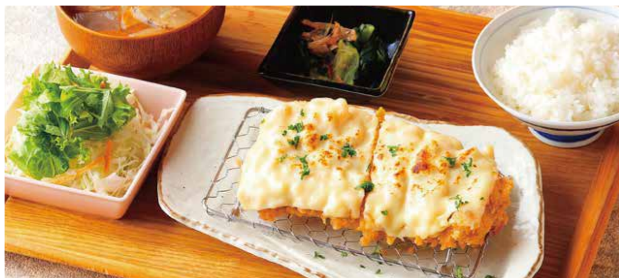
Roppaku Kurobuta pork Cutlet w/cheese sauce Set とろーりチーズのロースとんかつごはん ¥2,330

特定原材料および準ずるもの：卵 / 小麦 / 大豆 / ごま / りんご / 豚肉