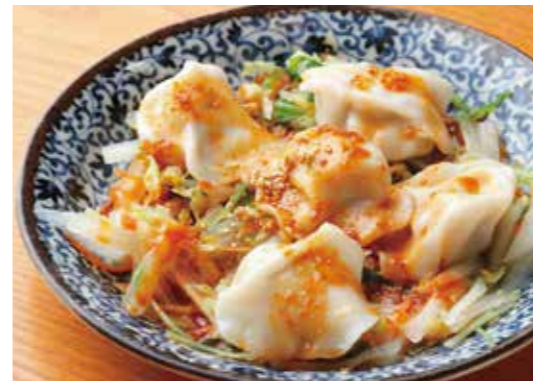
Boiled pork dumplings w/ Chinese chili sesame sauce 坦々水餃子 ツルンとした水餃子に濃厚ゴマだれと自家製ラー油。 ¥880