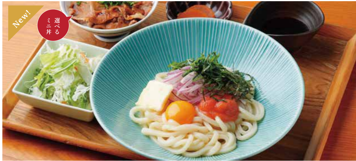
Mentaiko, raw egg & butter Udon & Choice of small rice bowl Set