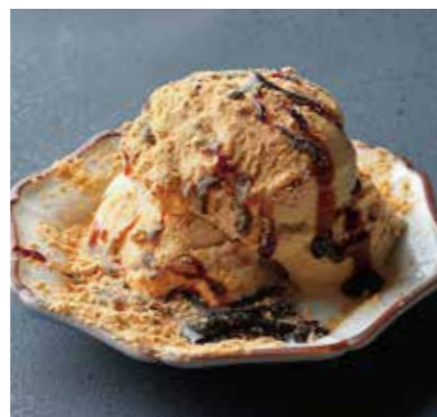
Sakurajima Brown sugar ice cream さくらじま黒糖あيس 鹿児島県南九州市の名産、知覧茶のほどよい ほろ苦さと和三盆の上品な甘さのアイスクリーム。 ¥700