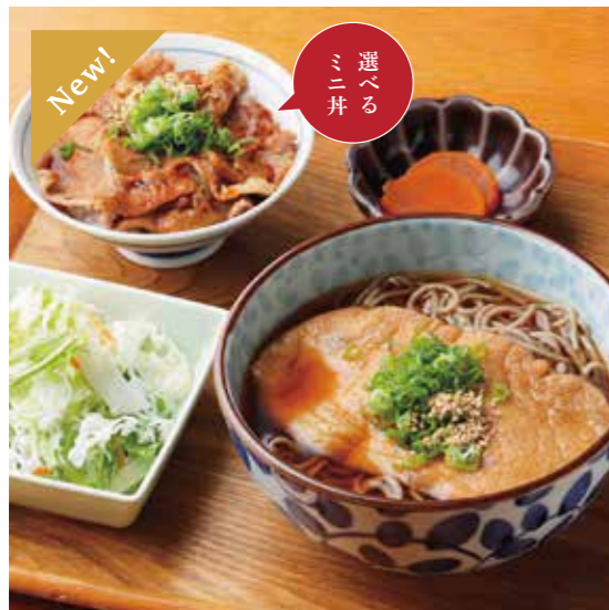
Udon or Soba w/ deep fried tofu & Choice of small rice bowl Set

特定原材料および準ずるもの：卵 / 小麦 / そば / 大豆 / ごま / 豚肉