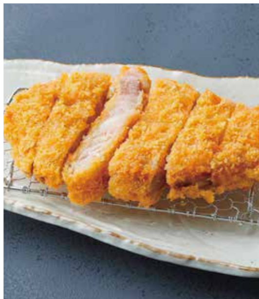
Roppaku Kurobuta pork sirloin cutlet