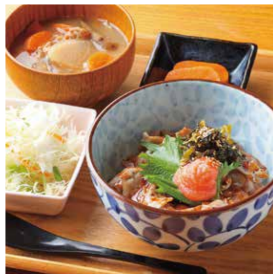
Spicy cod roe & stir-fried Takana pickles Rice bowl Set 明太高菜丼 ¥1,480

特定原材料および準ずるもの： 小麦 / 大豆 / 山芋 / ごま / さば / りんご / 豚肉