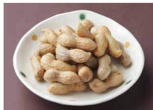
Boiled whole peanuts 塩茹で落花生 鹿児島特産。止まらない美味しさ。 ¥500