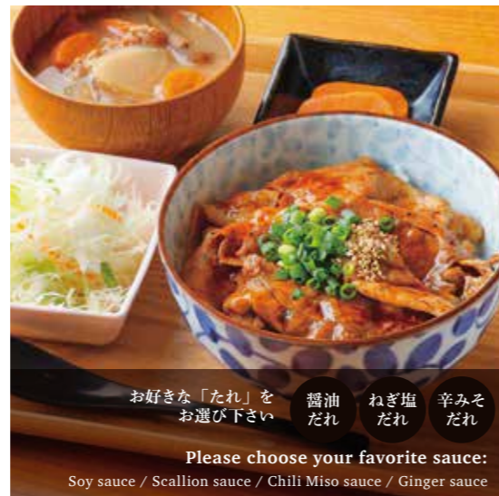
Sautéed Roppaku Kurobuta pork Rice bowl Set 網焼き黒ぶた丼 (醤油 / ねぎ塩 / 辛みそ) ¥1,380 (温玉のせ +¥150)