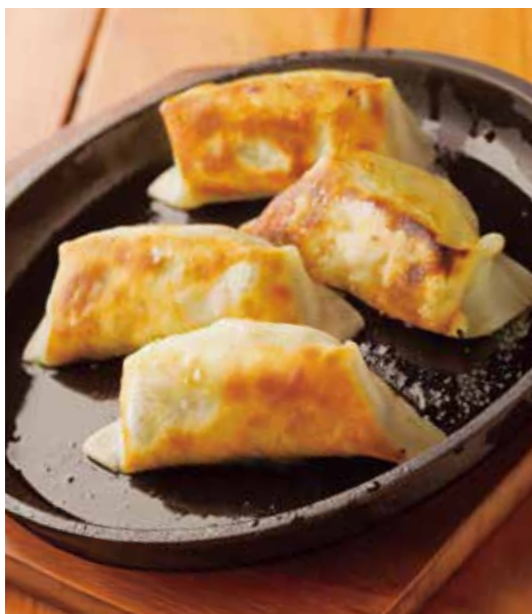
Kurobuta pork Gyoza dumplings