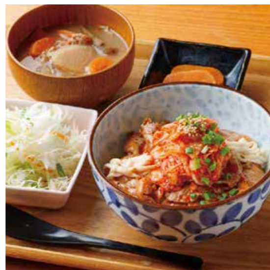
Roppaku Kurobuta pork w/Kimchi & Cheese Rice bowl Set 黒ぶたキムチチーズ丼 ¥1,580

特定原材料および準ずるもの： 卵 / 小麦 / 大豆 / ごま / さば / りんご / 豚肉