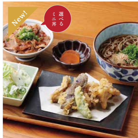
Udon or Soba w/ Today's Tempura, & Choice of small rice bowl Set