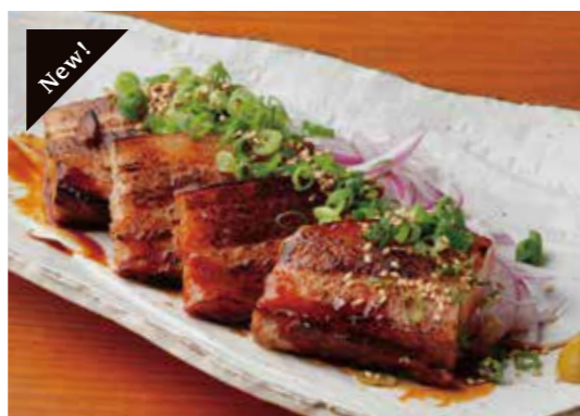
Housemade Char siu pork 自家製 厚切りチャーシュー 自家製の柔らかチャーシュー! ¥880