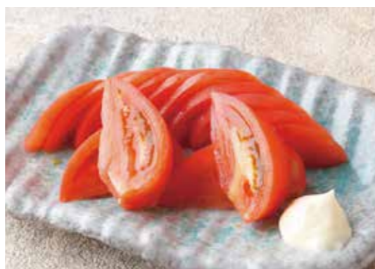
Chilled fresh tomato 冷やしトマト 冷たくひやしてシンプルに。 ¥500