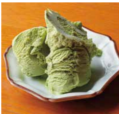
Chiran green tea ice cream 知覧茶と和三盆のアイス 鹿児島県南九州市の名産、知覧茶のほどよい ほろ苦さと和三盆の上品な甘さのアイスクリーム。 ¥700