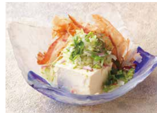
Cold tofu w/condiments 薬味たっぷりやっこ さっぱりヘルシー。 ¥500