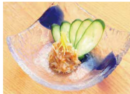
Chicken cartilago in Pickled plum paste コラーゲン梅なんこつ コリコリ食感が楽しい。コラーゲンたっぷり。 ¥600