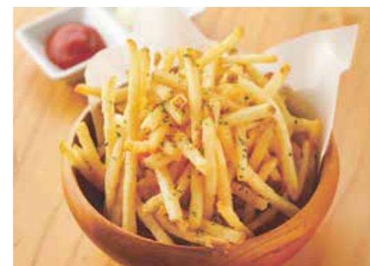
Fried Potatoes フライドポテト みんな大好き定番おつまみ。 ¥650