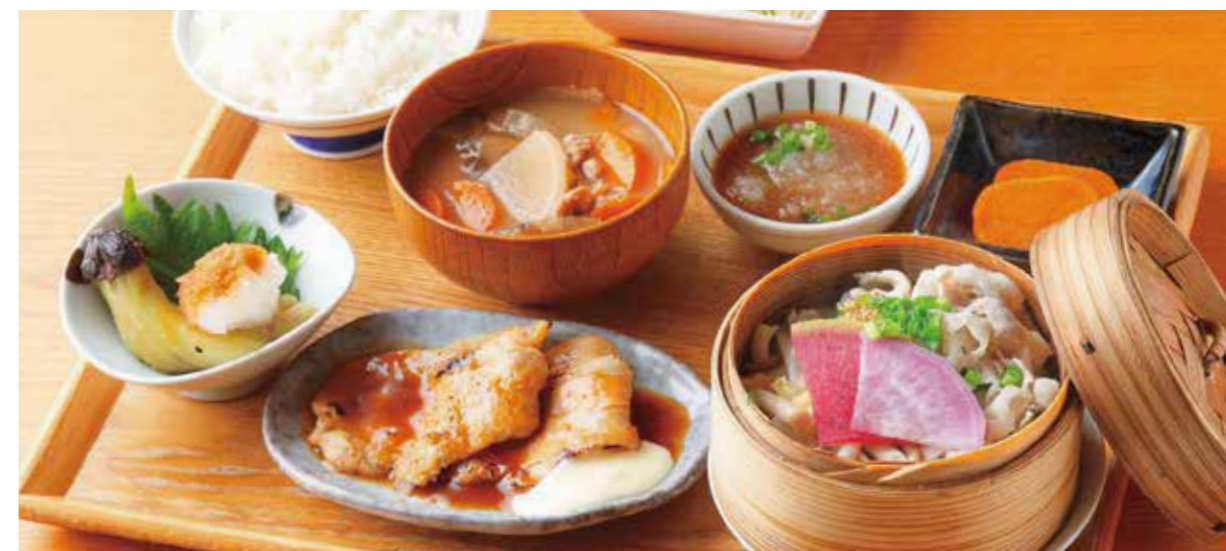
Steamed Kurobuta pork & veggie, Baked eggplant, & Choice of Asparagus Rolled Pork Cutlet or Pork Ginger Set 黒ぶたやの満足定食 お選び下さい アスパラカツ または 生姜焼き ¥2,380

特定原材料および準ずるもの：卵 / 乳 / 小麦 / 大豆 / ごま / りんご / 豚肉