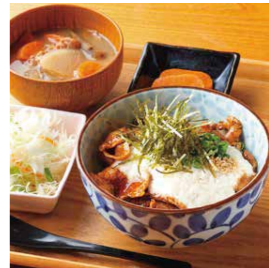
Roppaku Kurobuta pork w/Pounded Yam Rice bowl Set とろろわさびぶた丼 ¥1,480

特定原材料および準ずるもの： 卵 / 小麦 / 大豆 / 山芋 / ごま / さば / りんご / 豚肉