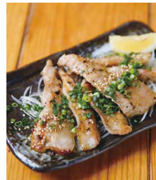
Grilled pork jowls meat