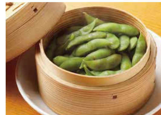
Steamed Green Soy bean 茶豆せいろ蒸し まずはこれ! せいろで熱々をお持ちします。 ¥600