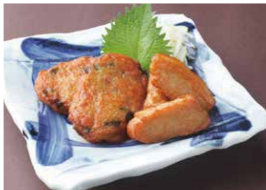
'Tsuke-Age' -Deep fried fish paste ball- 寺田屋のつけ揚げ 鹿児島県串木野から、寺田屋さんこだわりの手作りさつま揚げ。 ¥780