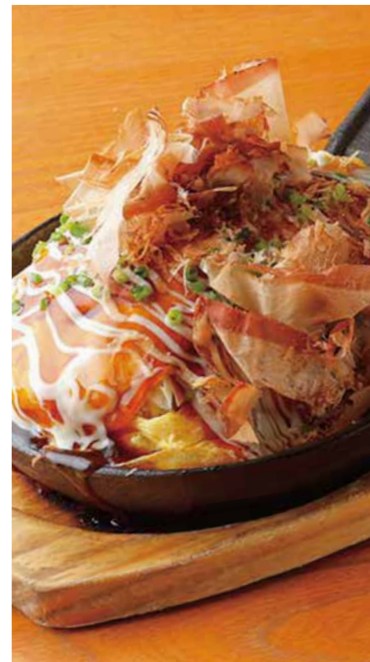
Pork, cabbage & mozzarella omelette とろーりチーズのとん平焼き たっぶりキャベツにとろ〜りチーズ、 香ばしいブレンドソースで。 ¥880