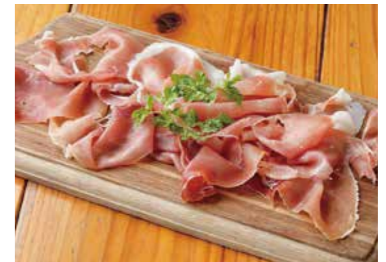
Prosciutto 山盛りプロシュート 生ハム好きにはたまりません。