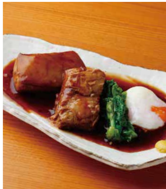
Tender stewed Roppaku Kurobuta pork