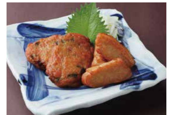
'Tsuke-Age' -Deep fried fish paste ball- 寺田屋のつけ揚げ 鹿児島県串木野から、寺田屋さんこだわりの手作りさつま揚げ。