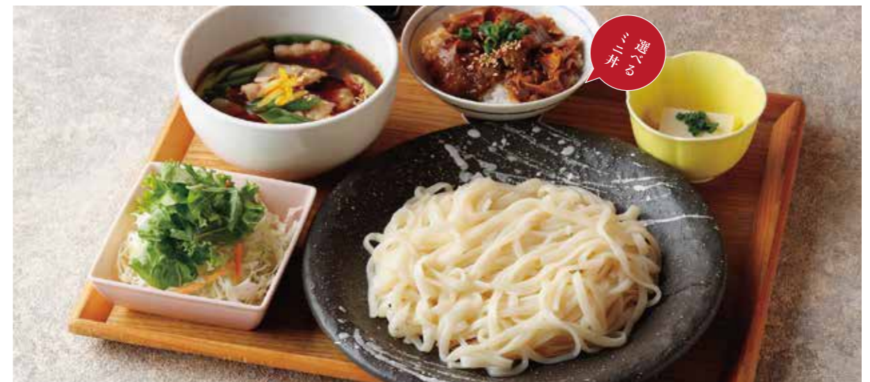
Soba? w/Leek & Pork dip soup, & Choice of small rice bowl Set 九条ねぎと柚子香る黒ぶたつけそば または うどん & 選べるミニ丼

特定原材料および準ずるもの：卵 / 小麦 / そば / 大豆 / ごま / 豚肉