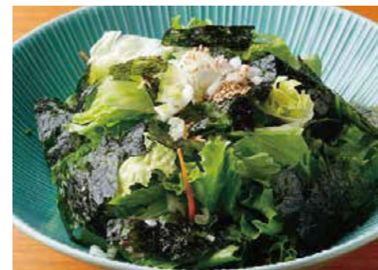
Korean style Green Salad w/Nori Seaweed 韓国海苔のグリーンサラダ 韓国風の醤油ベースドレッシングで。