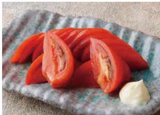
Chilled fresh tomato 冷やしトマト 冷たくひやしてシンプルに。