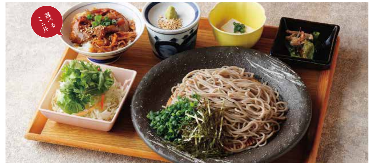
Soba or Udon, & Choice of small rice bowl Set せいろそば または うどん & 選べるミニ丼 ¥1,480