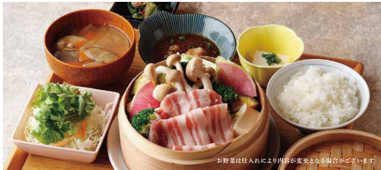
Steamed Roppaku Kurobuta pork & Vegetables Set

特定原材料および準ずるもの：卵 / 小麦 / 大豆 / 山芋 / ごま / さば / りんご / 豚肉