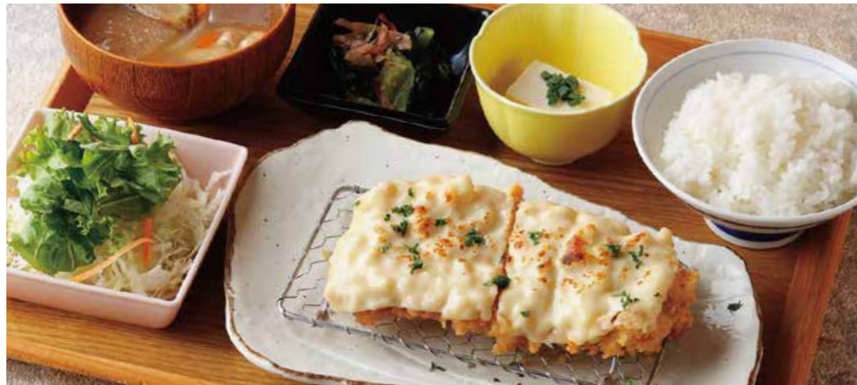
Roppaku Kurobuta pork Cutlet w/cheese sauce Set