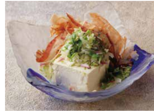
Cold tofu w/condiments 薬味たっぷりやっこ さっぱりヘルシー。