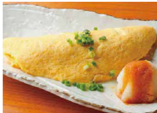
Dashi flavored Omelette w/grated daikon turnip 出汁巻きオムレツ