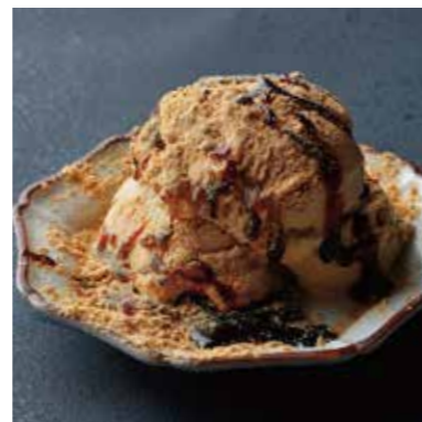
Soybean flour & brown sugar ice cream