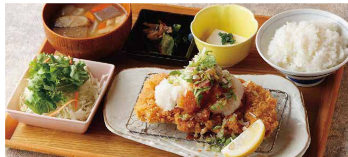
Roppaku Kurobuta pork Cutlet w/grated Daikon radish Set たっぷり薬味のおろしロースとんかつごはん ¥2,280

特定原材料および準ずるもの：卵 / 小麦 / 大豆 / ごま / りんご / 豚肉