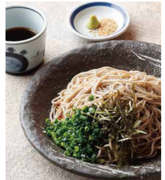
Soba or Udon