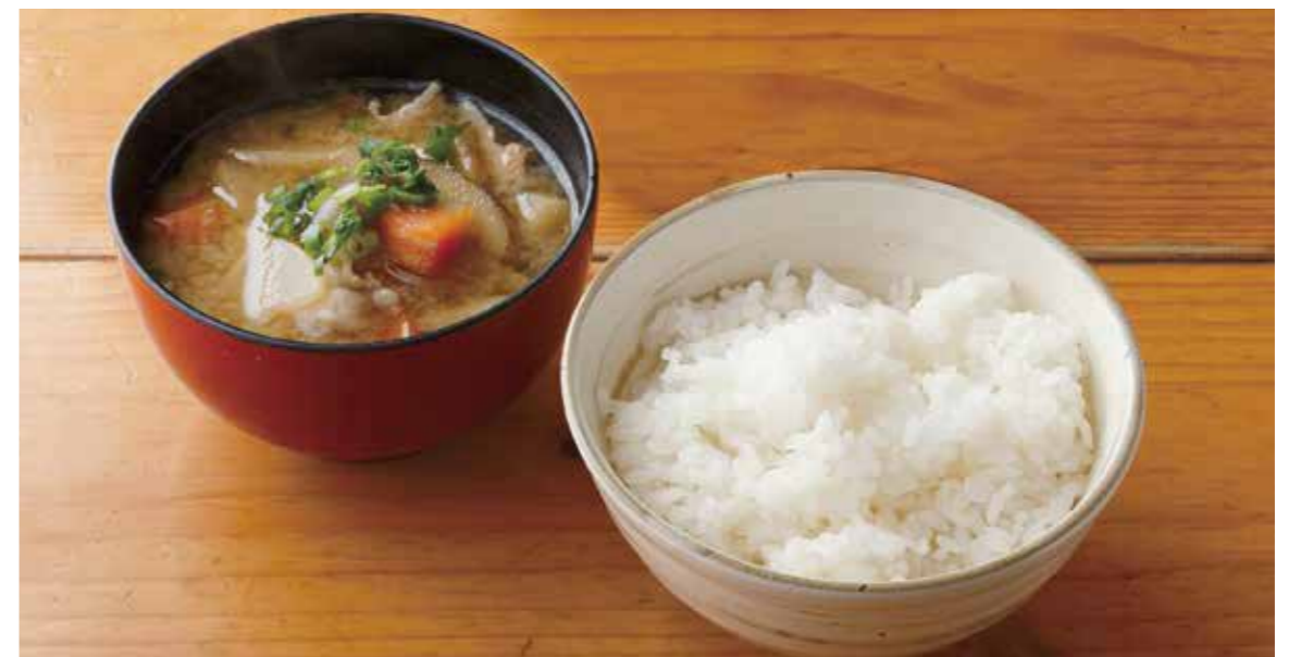
Rice & pork miso soup set