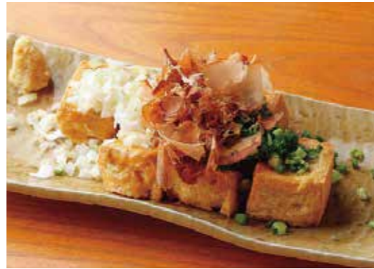
Deep fried tofu w/condiments 自家製厚揚げ