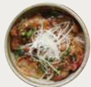
黒ぶた丼 (醤油 / ねぎ塩 / 辛みそ)

特定原材料および準ずるもの： (醤油) 小麦 / 大豆 / ごま / さば / 豚肉 (ねぎ塩) 小麦 / 大豆 / ごま / 鶏肉 / 豚肉 / セラチン (辛みそ) 小麦 / 大豆 / ごま / 豚肉