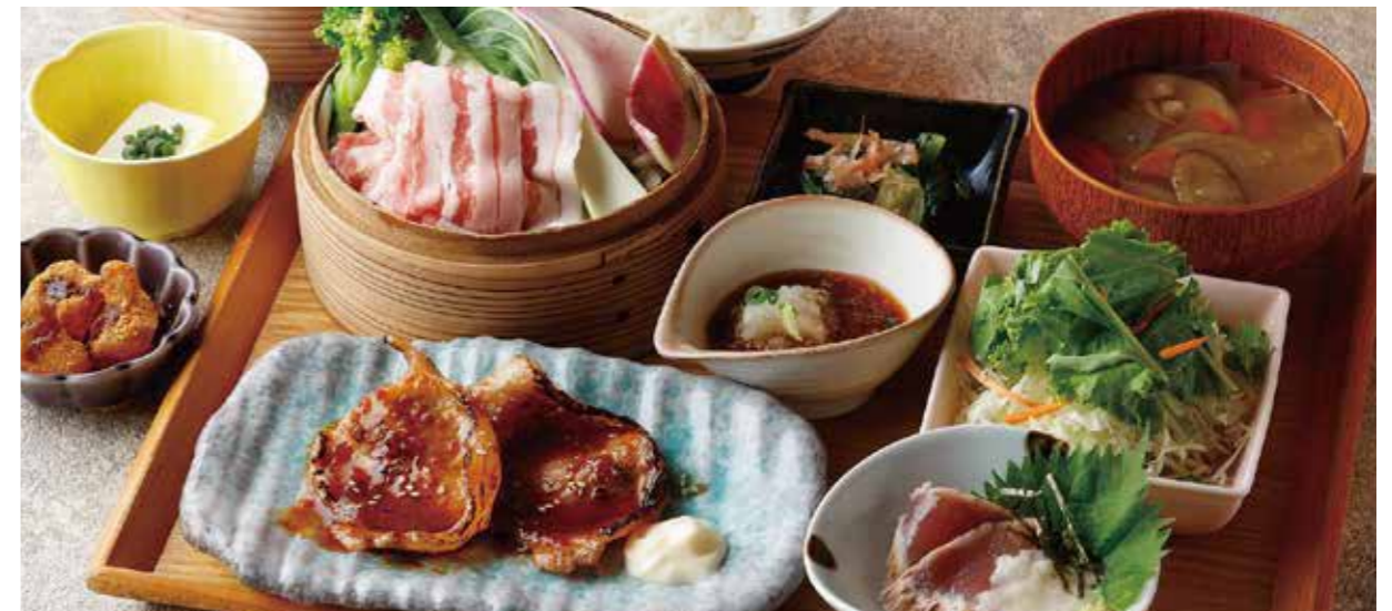
Steamed Kurobuta pork & veggie, Seared Bonito & Choice of Tender srewed Pork or Pork Ginger Set

特定原材料および準ずるもの：卵 / 乳 / 小麦 / 大豆 / ごま / りんご / 豚肉