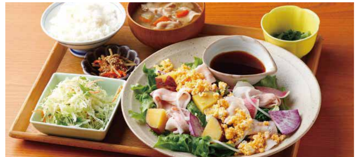
Seasonal Vegetables & Boiled Kurobuta pork plate Set