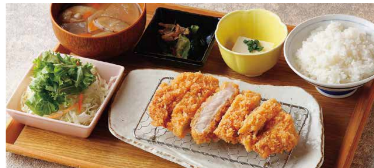
Roppaku Kurobuta pork Cutlet Set 黒ぶたロースとんかつごはん ¥2,180