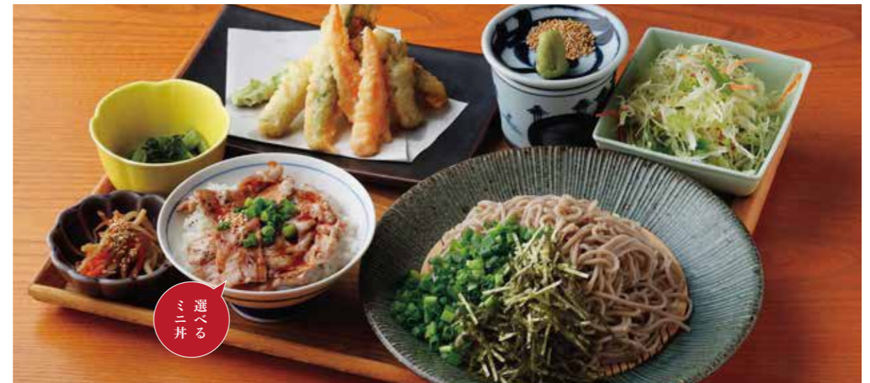
Soba or Udon w/ Seasonal Vegetables Tempura, & Choice of small rice bowl Set 季節野菜の天ぷらそば または うどん & 選べるミニ丼