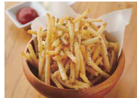
Fried Potatoes フライドポテト みんな大好き定番おつまみ。