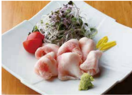
Raw cooked Roppaku kurobuta pork loin 黒ぶたわさ