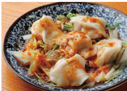
Boiled pork dumplings w/ Chinese chili sesame sauce 坦々水餃子