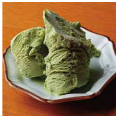
Chiran green tea ice cream