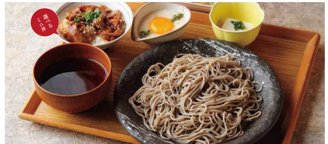
Soba w/punded yam & raw egg, & Choice of small rice bowl Set とろろ月見そば または うどん & 選べるミニ丼 ¥1,680

特定原材料および準ずるもの：卵 / 小麦 / そば / 大豆 / ごま / さば