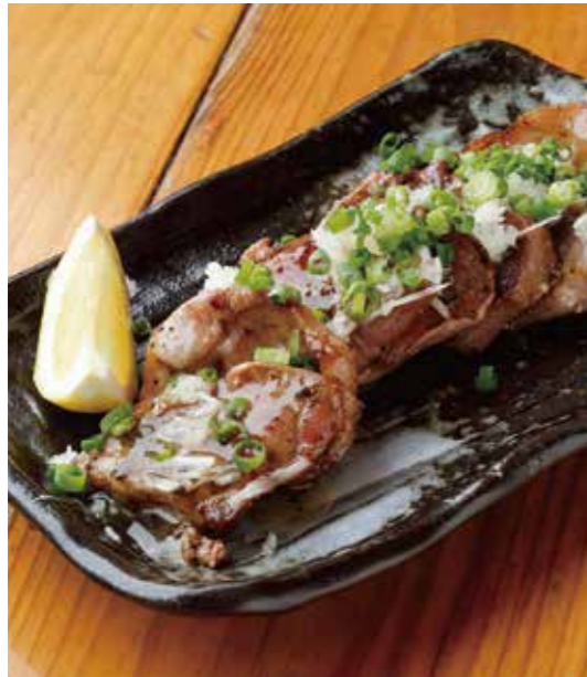
Grilled pork tongue w/scallion salt sauce