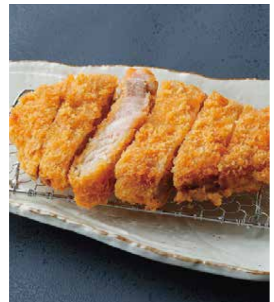
Roppaku Kurobuta pork sirloin cutlet 六白黒豚 ロースとんかつ