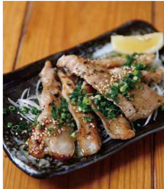
Grilled pork jowls meat

特定原材料および準ずるもの： 小麦 / 大豆 / ごま / 鶏肉 / セラチン / 豚肉