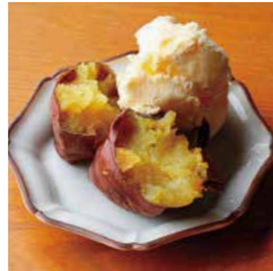
Baked sweet potato & vanilla ice cream