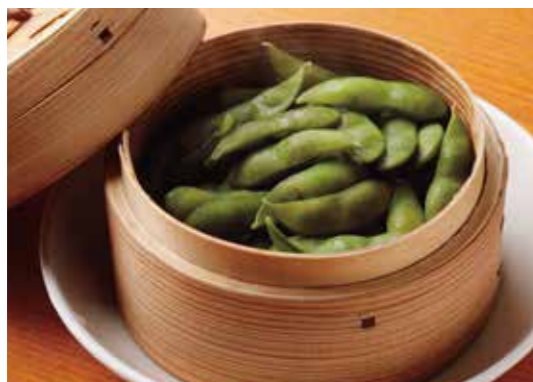
Steamed Green Soy bean 茶豆せいろ蒸し まずはこれ！せいろで熱々をお持ちします。