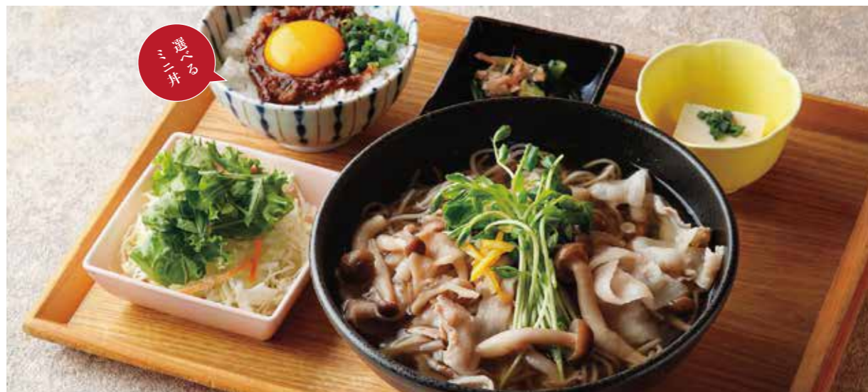
Seasonal mushrooms & Pork Udon, & Choice of small rice bowl Set たっぷりきのこ黒ぶたのそば または うどん & 選べるミニ丼

特定原材料および準ずるもの：卵 / 小麦 / そば / 大豆 / ごま / 豚肉