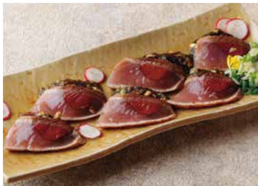
Seared bonito carpaccio 枕崎かつおのカルパッチョ