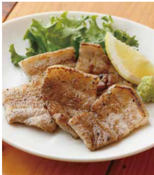
Grilled pork short ribs