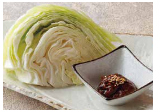
Fresh cabbage w/pork miso ぶた味噌キャベツ 鹿児島麦みそを使用、黒ぶたや特製です。