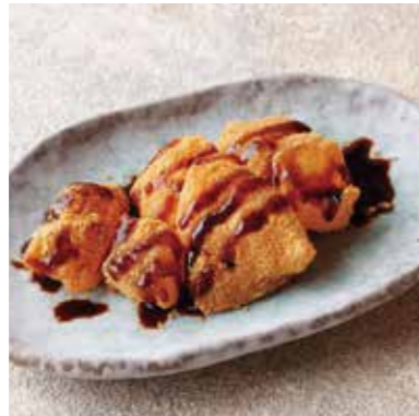
Warabi mochi w/roasted soybean flour