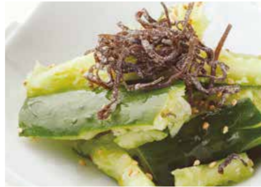
Cucumber w/ salted kelp 塩昆布たたききゅうり あっさり味の人気の一品。