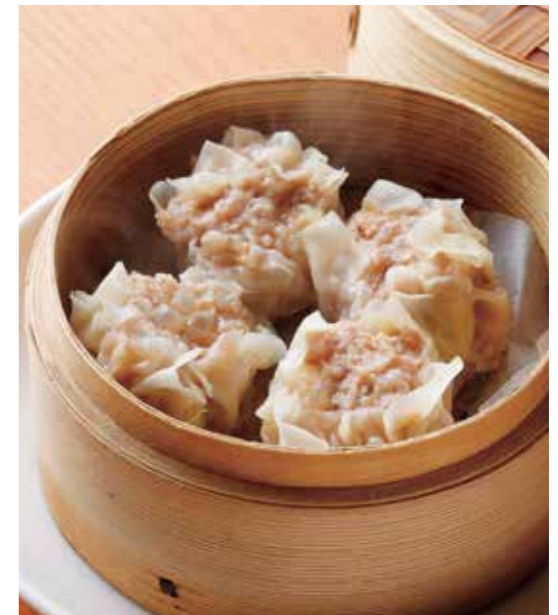
Steamed Roppaku Kurobuta pork shumai dumplings 黒ぶたしゅうまい