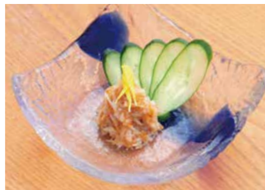
Chicken cartilago in Pickled plum paste コラーゲン梅なんこつ コリコリ食感が楽しい。コラーゲンたっぷり。