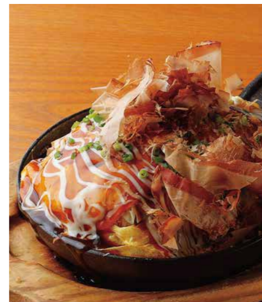
Pork, cabbage & mozzarella omelette とろーりチーズのとん平焼き