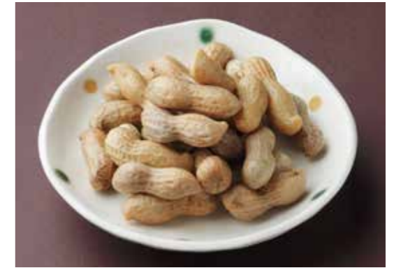
Boiled whole peanuts 塩茹で落花生 鹿児島特産。止まらない美味しさ。