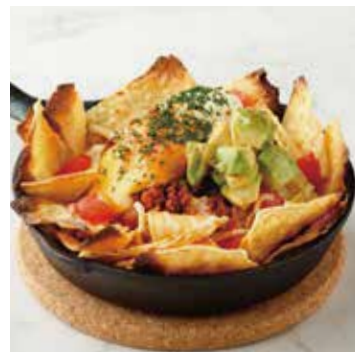
MEXICAN NACHOS メキシカンナチョス 800+税