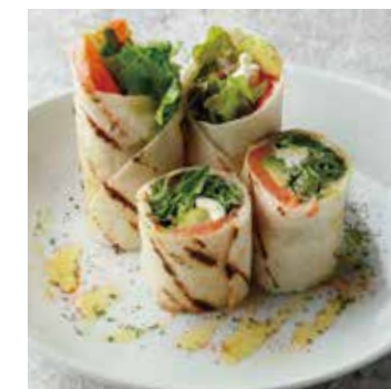
SALMON TORITILLA ROLL スモークサーモンのトルティーヤロール