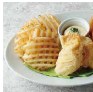
FISH & CHIPS フィッシュ&チップス 800+税