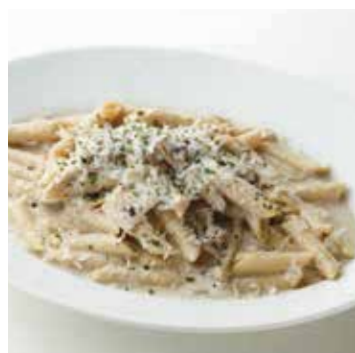
CREAMY CHICKEN & PORCINI PENNE