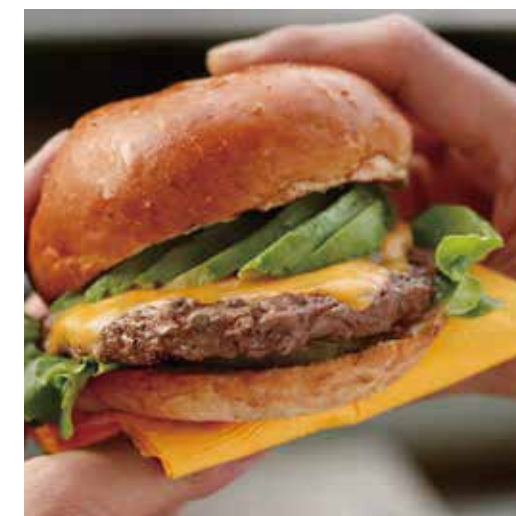
AVOCADO CHEESE BURGER W/FRENCH FRIES アボカドチーズバーガー (ポテト付き) 1000+税