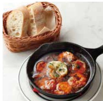
SHRIMP AJILLO 海老のアヒージョ(バゲット付き) 800+税