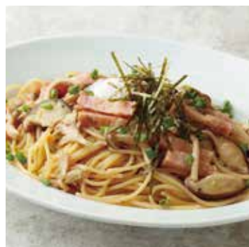
BACON & MUSHROOM, SOY SAUCE