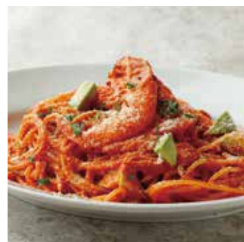
SOFT SHELL SHRIMP & AVOCADO TOMATO CREAM