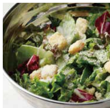
CAESAR SALAD シーザーサラダ 780+税