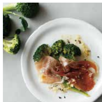
ANCHOVY BROCCOLI アンチョビブロッコリー