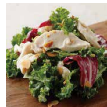
KALE & CHICKEN ケールと蒸し鶏