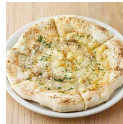
QUATTRO FORMAGGI クアトロチーズ 1200+税