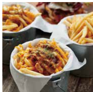
FRENCH FRIES フレンチフライ 500+税

..... TOPPINGS ・CHEESE ・CHILI BEAN ・GRAVY 追加トッピング 各 +150 ・チーズ ・チリビーンズ ・グレービー