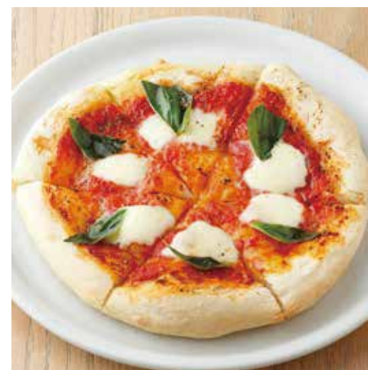
MARGHERITA マルゲリータ 1000+税