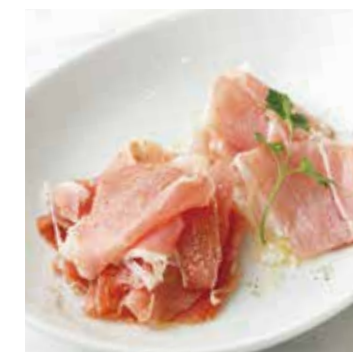
ASSORTED PROSCIUTTO 生ハム2種盛合せ