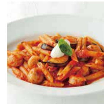
SALSICCIA & EGGPLANT PENNE