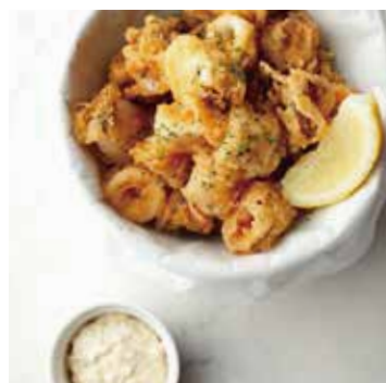
CALAMARI FRITTER カラマリフリット