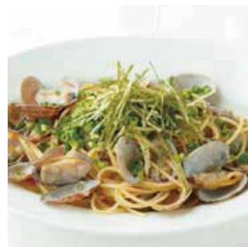
BUTTERED CLAM W/SOYSAUCE