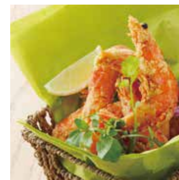
GARLIC SHRIMP (4P) ガーリックシュリンプ (4p)