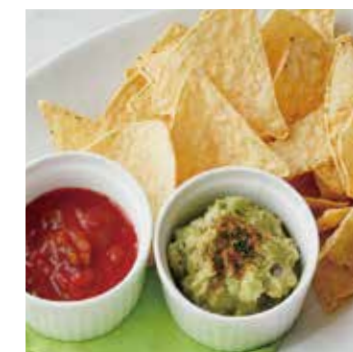
AVOCADO DIP アボカドディップ