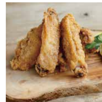
SPICY CHICKEN FRITTER スパイシーチキンフリット