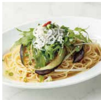
JACO & FRIED EGGPLANT