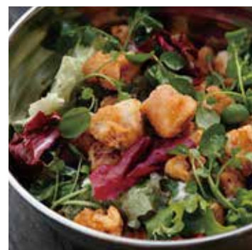
CALAMARI SALAD カラマリサラダ 980+税