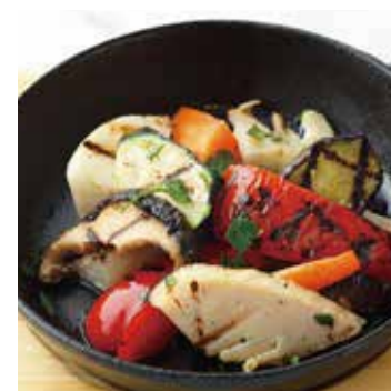
GRILLED VEGE MARINE 焼き野菜のマリネ