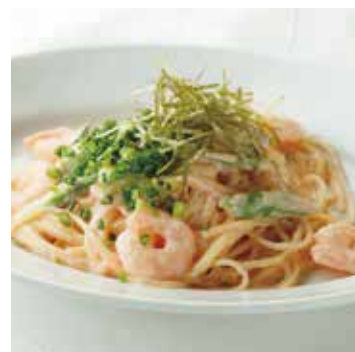
SHRIMP & ASPARAGUS, MENTAI CREAM