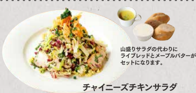
チャイニーズチキンサラダ Chinese Chicken Salad ¥ 900