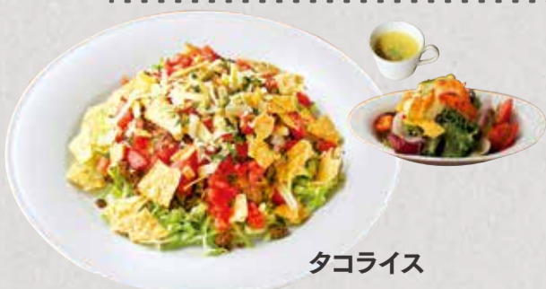
タコライス Taco Rice ¥ 900