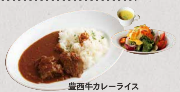
豊西牛カレーライス Toyonishi Beef Curry & Rice ¥ 900

tax included. we offer domestic grown rice. 価格は全て税込です。当店では国産米を使用しております。